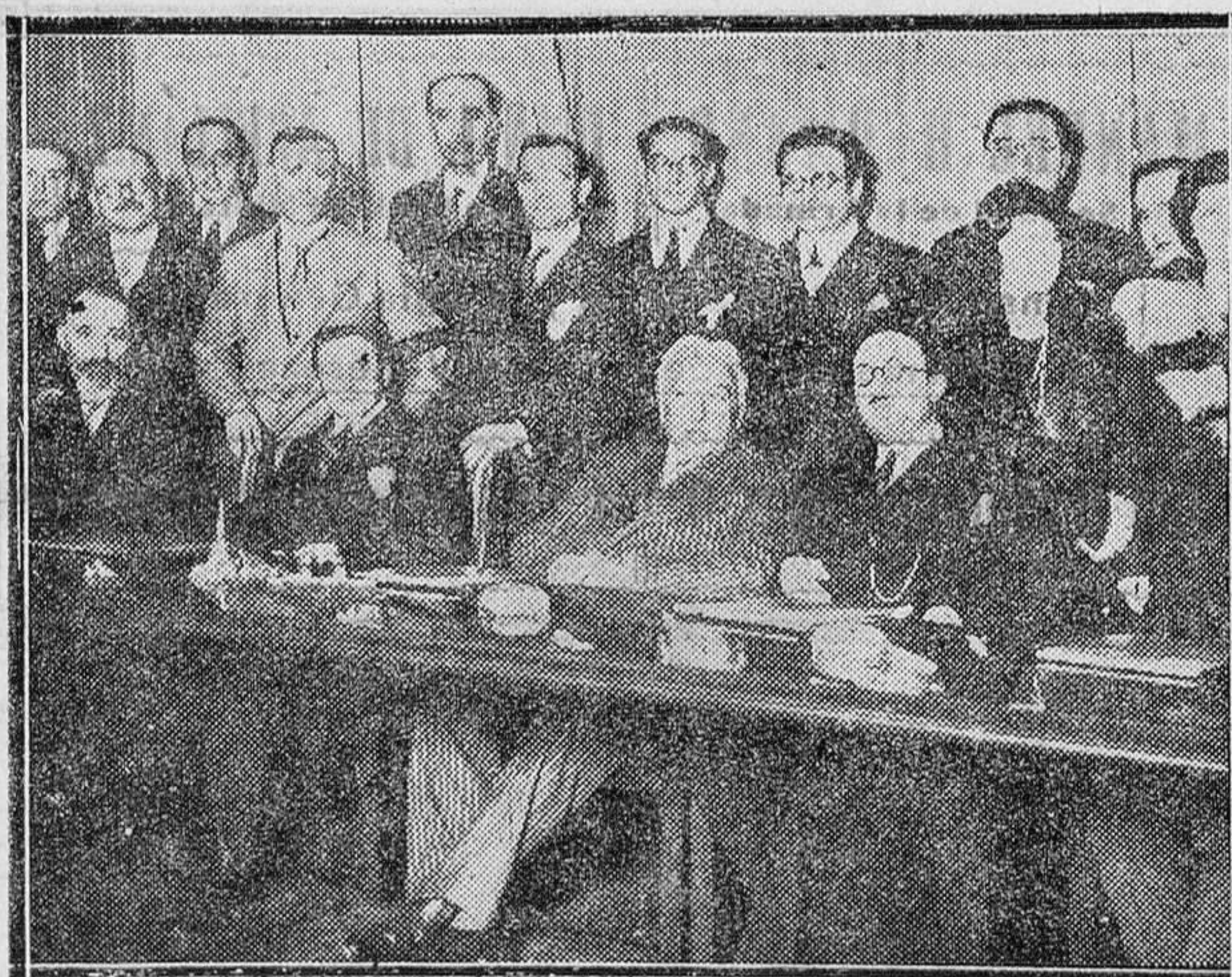
MADRID.—El Presidente de la República presidiendo la sesión del Congreso de Derecho de la Ciudad Universitaria