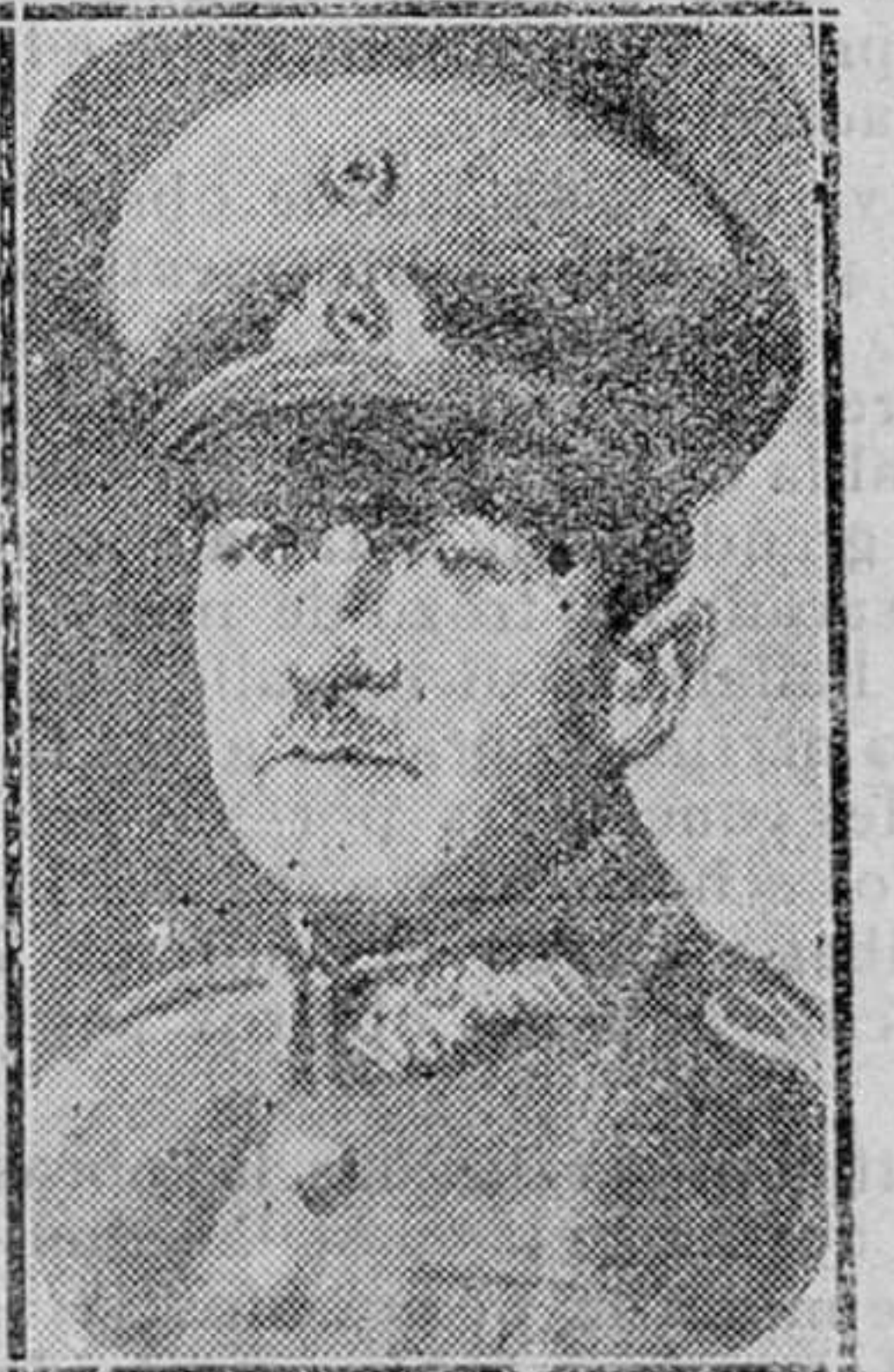
El general Schleicher, del que durante los preliminares de la lucha para la renovación del Reichstag, se venía hablando en Alemania como probable sucesor del Jefe del Gobierno prusiano. Otto Braun