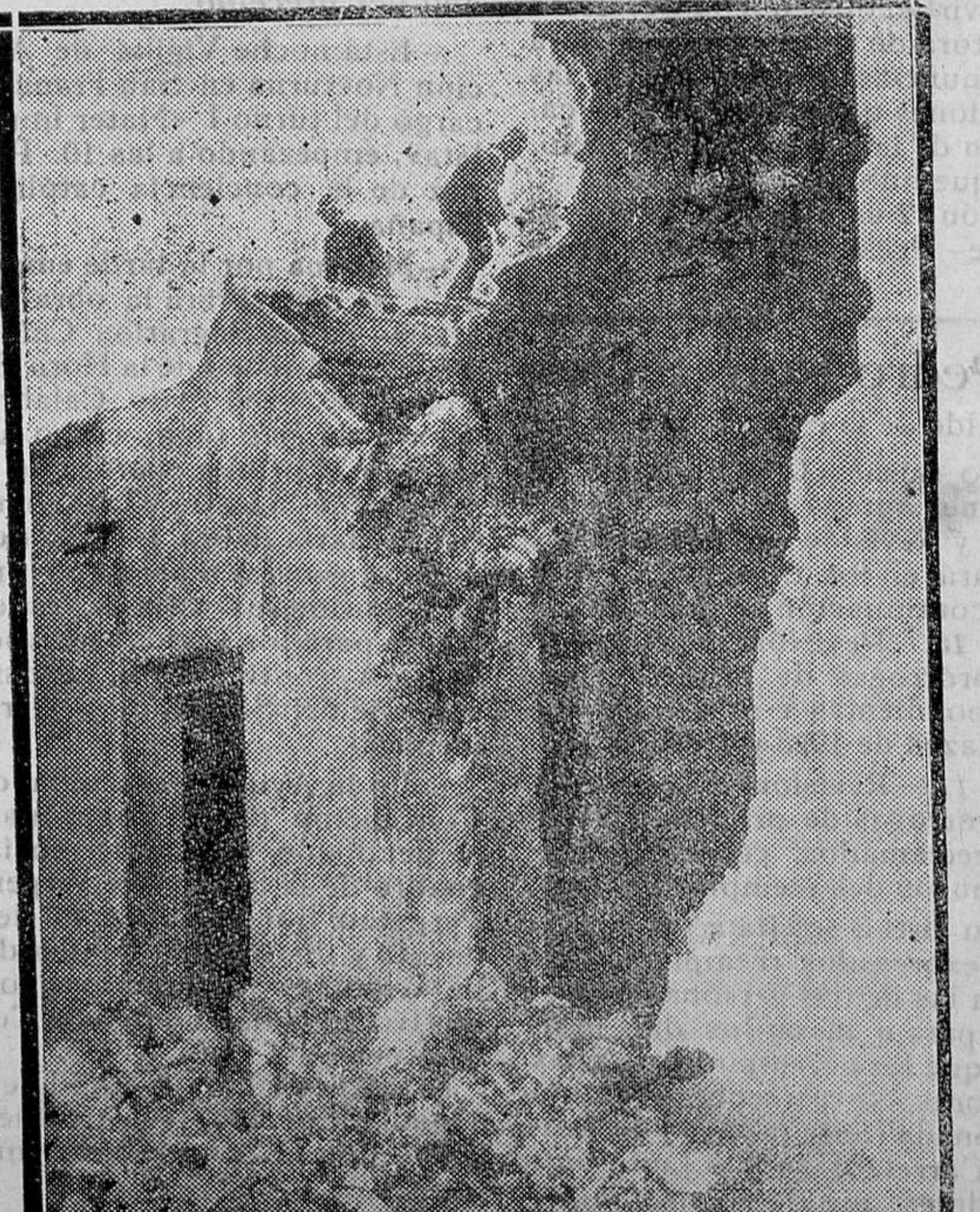
COLMENAR DE OREJA (Madrid).—La casa completamente destruida a causa del incendio, de un almacén de tinajas, reduciendo de Madrid varios tanques y bomberos