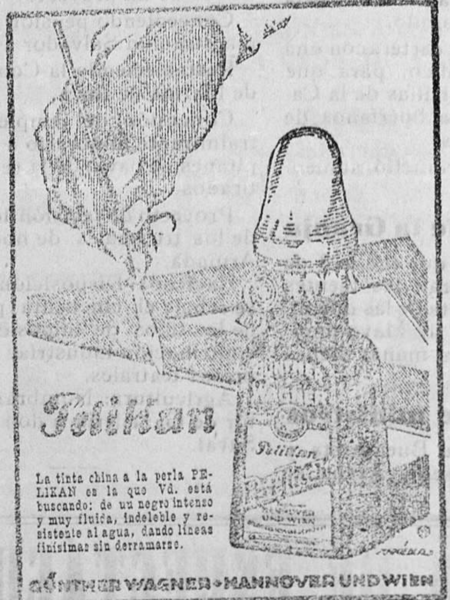
La tinta china a la perla PELIKAN es la que Vd. está buscando: de un negro intenso y muy fluida, indeleble y resistente al agua. Cada línea firmada es un triunfo.