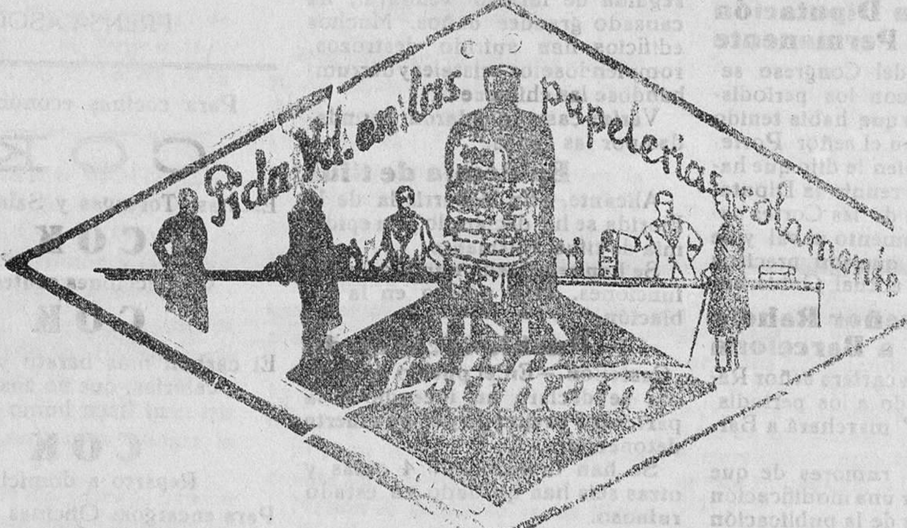
De venta en la Librería de MANUEL SINTES ROTGER, Plaza de Pablo Iglesias, 17, Mahón.

Libretas de alquiler, listas de embarque altas y bajas para la contribución industrial DE VENTA EN ESTA IMPRENTA Imp. de M. Sintes Rotger, Mahón