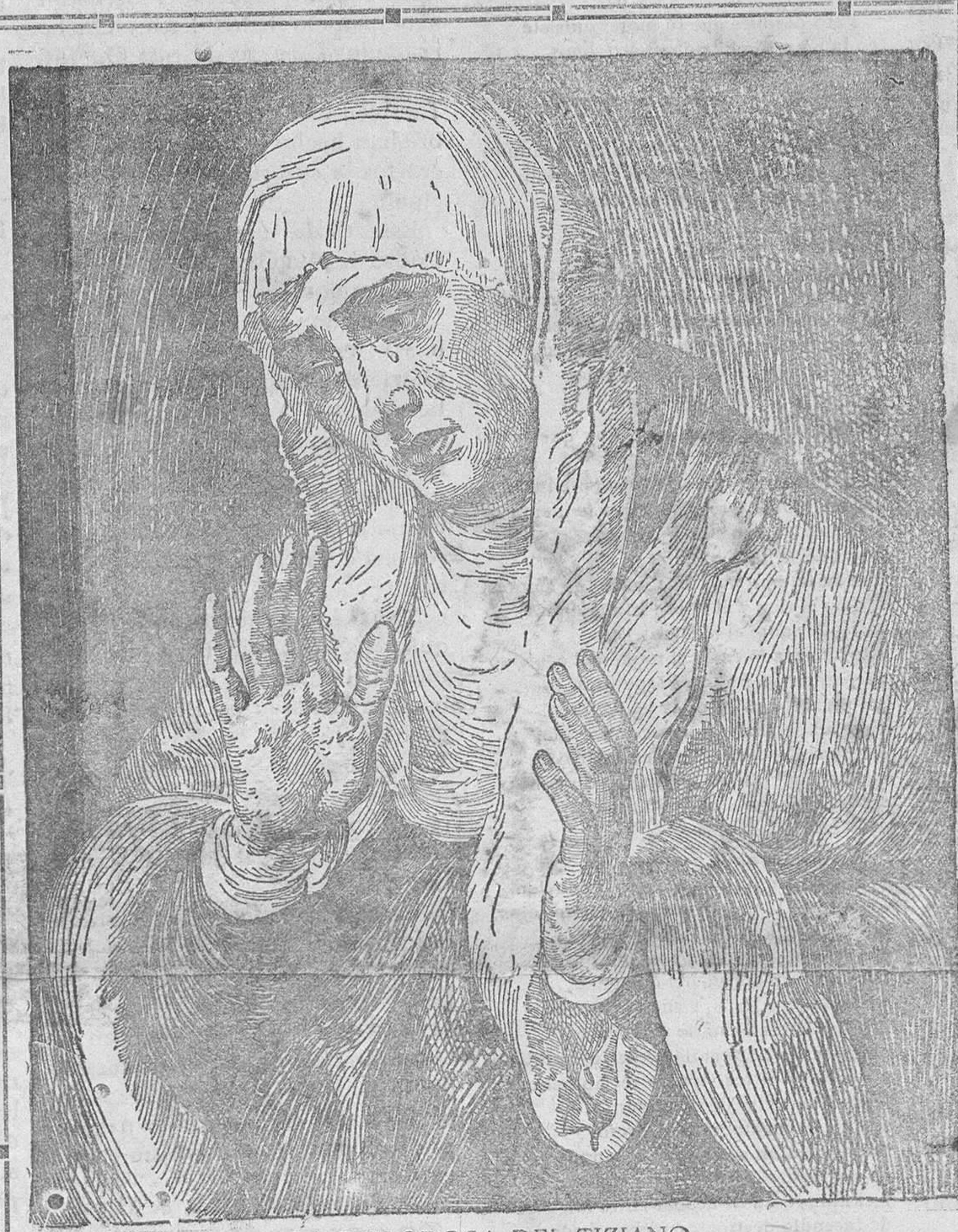
LA DOLOROSA DEL TIZIANO