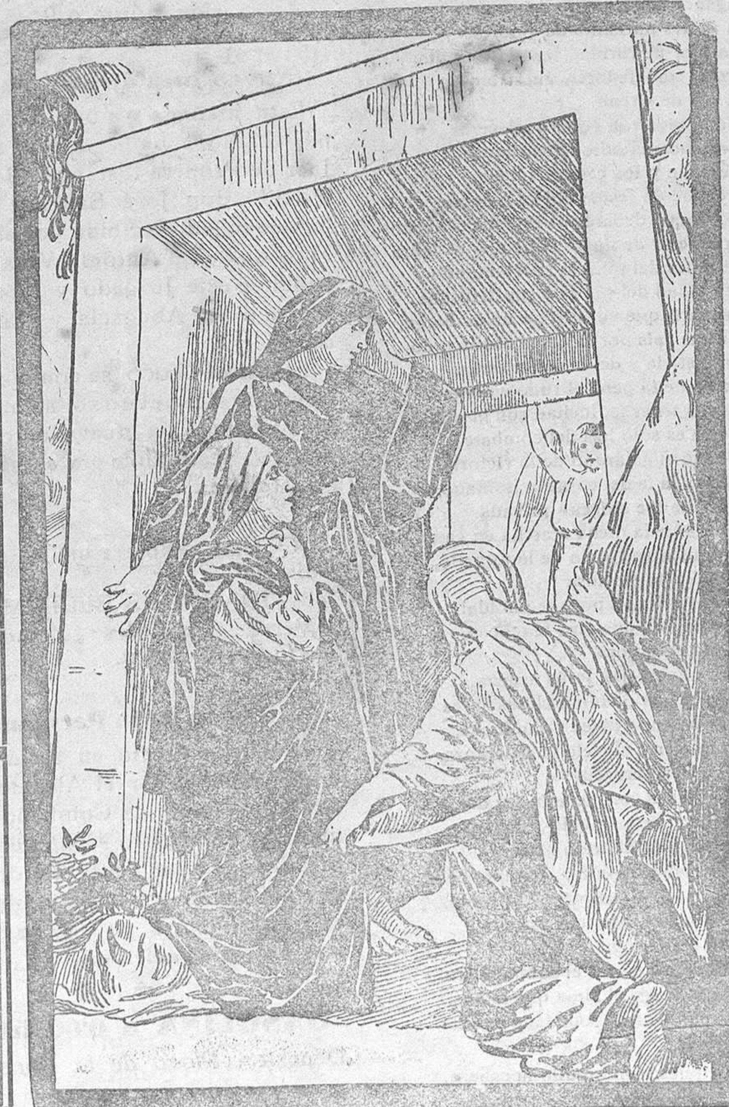
LAS SANTAS MUJERES ANTE LA TUMBA VACÍA DE JESÚS

(Celebre cuadro de W. BAUGEREAU, que se conserva en el Museo del Louvre).