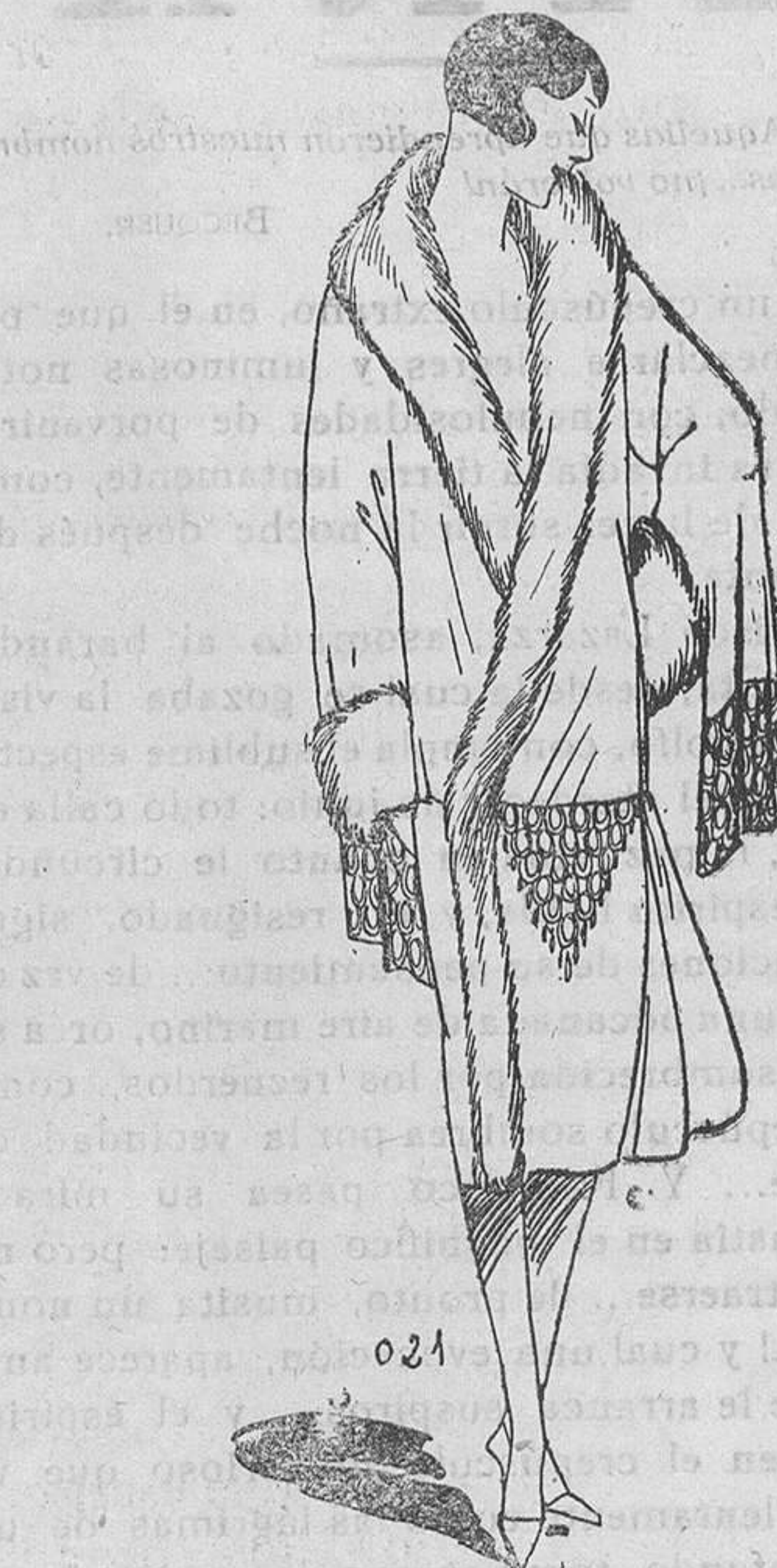
Manteau de terciopelo rubio dorado, adornado con Zorino de un rubio más oscuro y bordados en oro

elegantes. Se empieza a ver qué modelos ha elegido la parisiense entre las variadas colecciones, porque como es sabido siempre se produce cierta vacilación al comenzar una temporada, y sobre todo, como ocurre ahora, cuando la moda implica una transformación de la silueta.