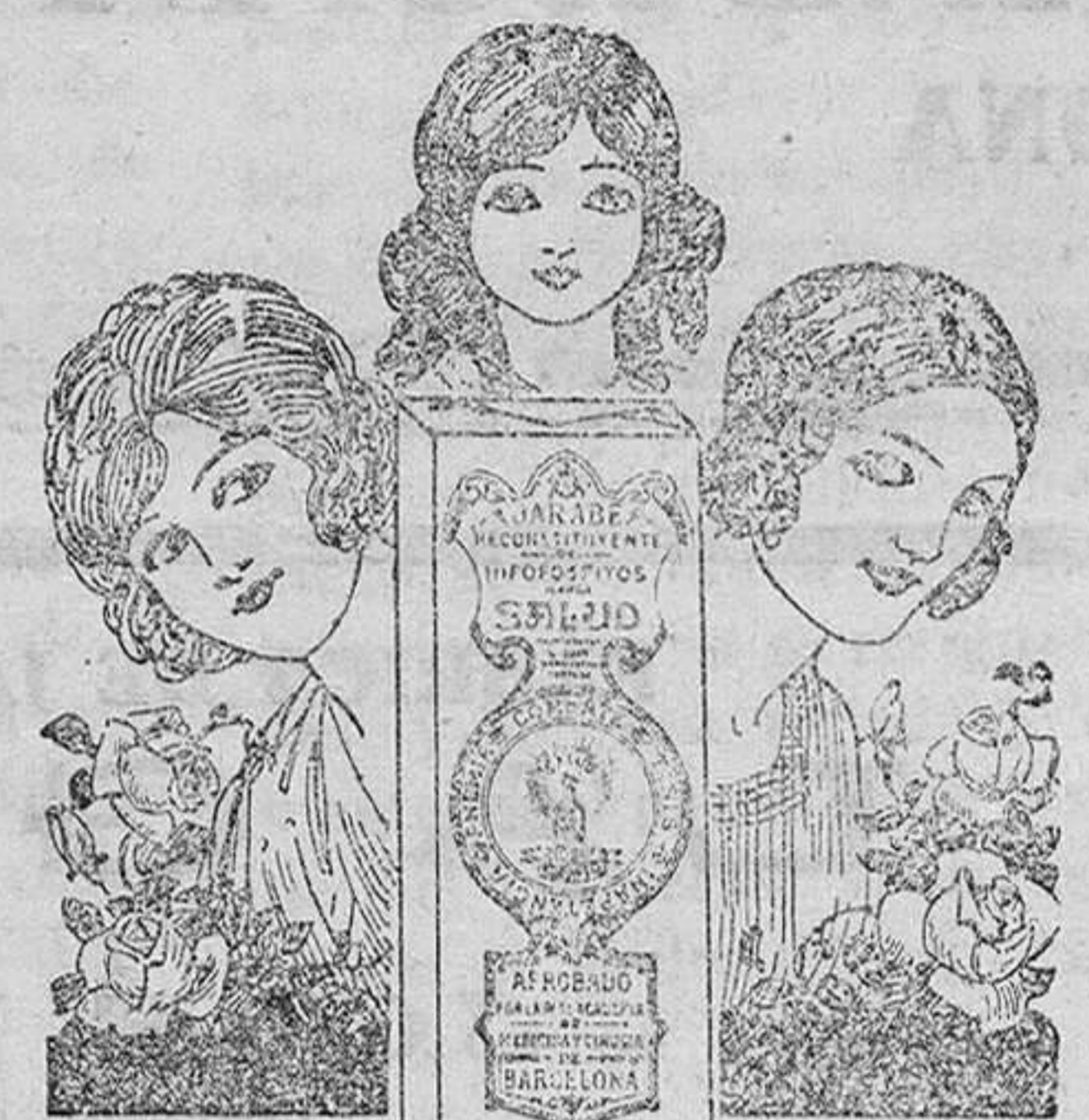
Entre flores vive la mujer defendida por el