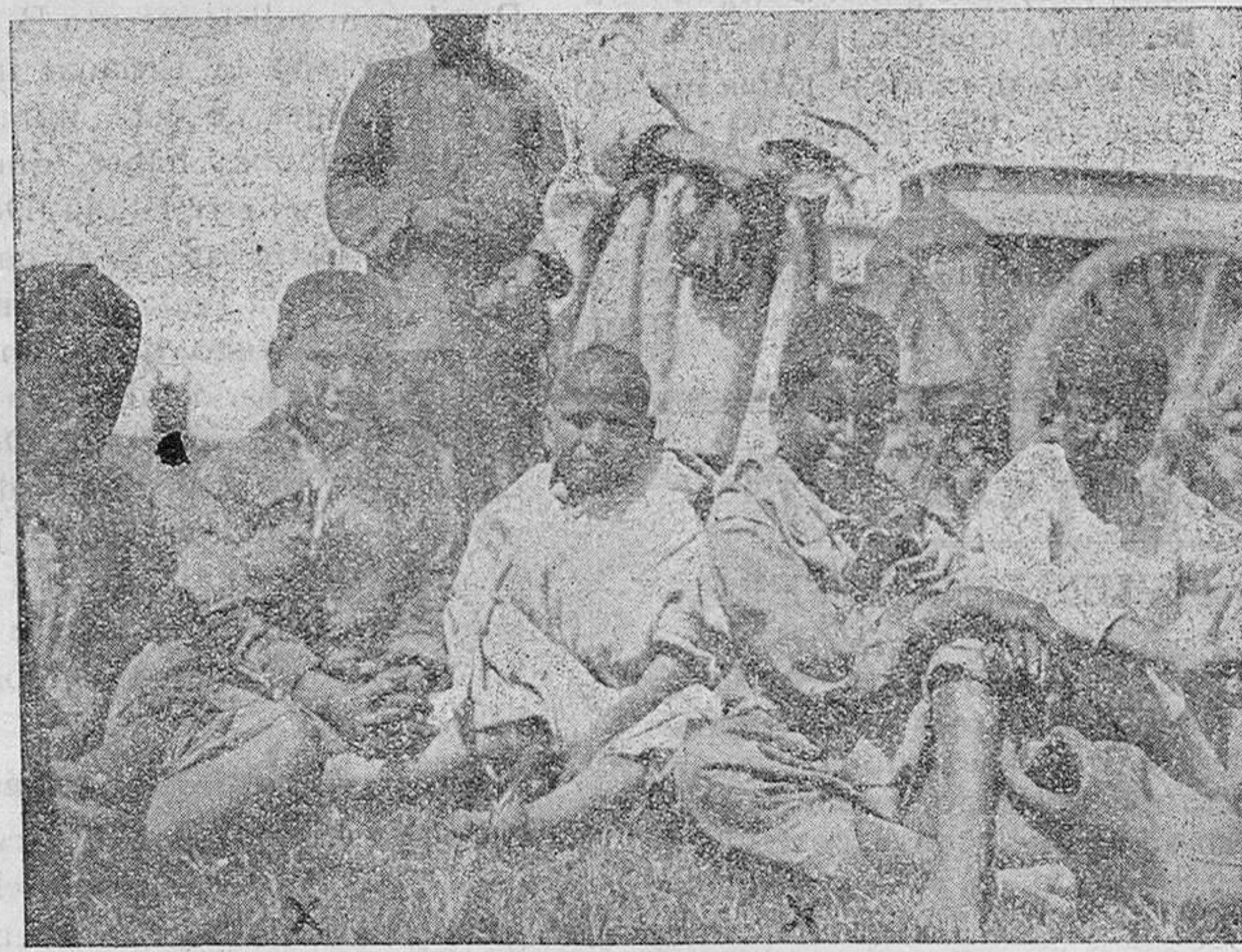
MORITOS DE MAZUZA

Por el sitio en que está situado, el campamento es naturalmente sucio a causa del mucho polvo que constantemente se levanta y sobre todo cuando hay viento poniente; entonces se forman torbellinos que todo lo invaden y hasta cuando se escribe a mano hay que soplar sobre el papel para quitar la polvareda. En tales instantes es imposible desenfundar la máquina de escribir, teniendo que aguardar que pase la ventolera para sacudir la capa de tierra que todo lo invade. Esta suciedad inevitable trae como acompañamiento las pulgas y las moscas; pero se habitúa uno a todo y se compensa la existencia de tales habitantes con la vecindad del agua del Fersit y del Geli para lavarse y lavar la ropa, y con una fuente cuya agua es fina y agradable. La única dificultad para proveer de agua estriba en que como acuden por ella todos los Cuerpos del Campamento, se pierde tiempo