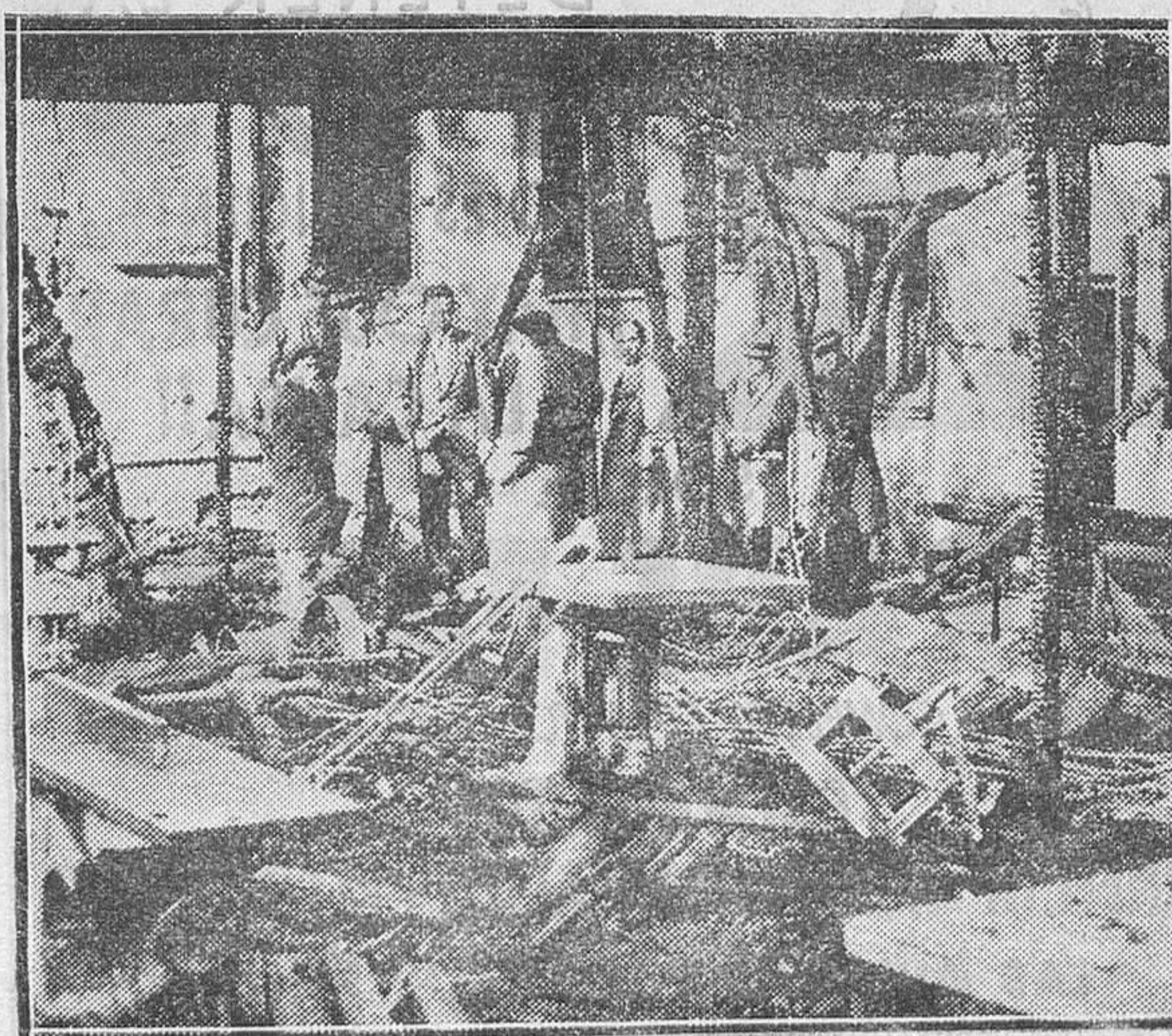
MADRID.—Estado en que quedó la nave principal del taller de ebanistería de la calle Fernández de la Hoz, después del incendio, y cuyas pérdidas ascienden a 200.000 ptas