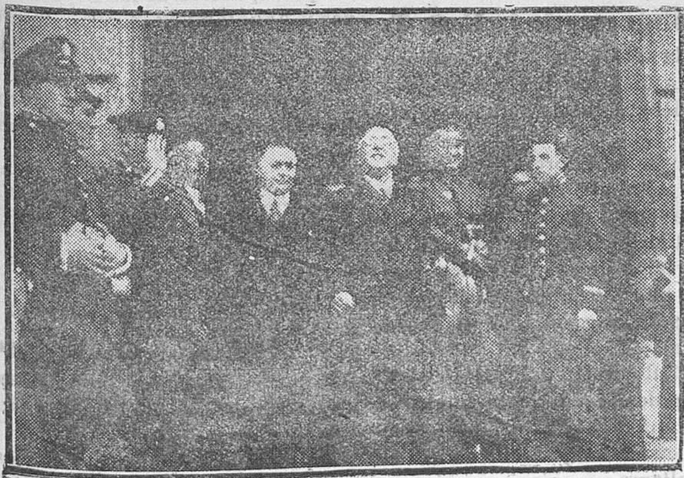
EL PRESIDENTE DE LA REPÚBLICA EN BURGOS.—El señor Alcalá Zamora correspondiendo al público de Burgos que le aclama y vitorea