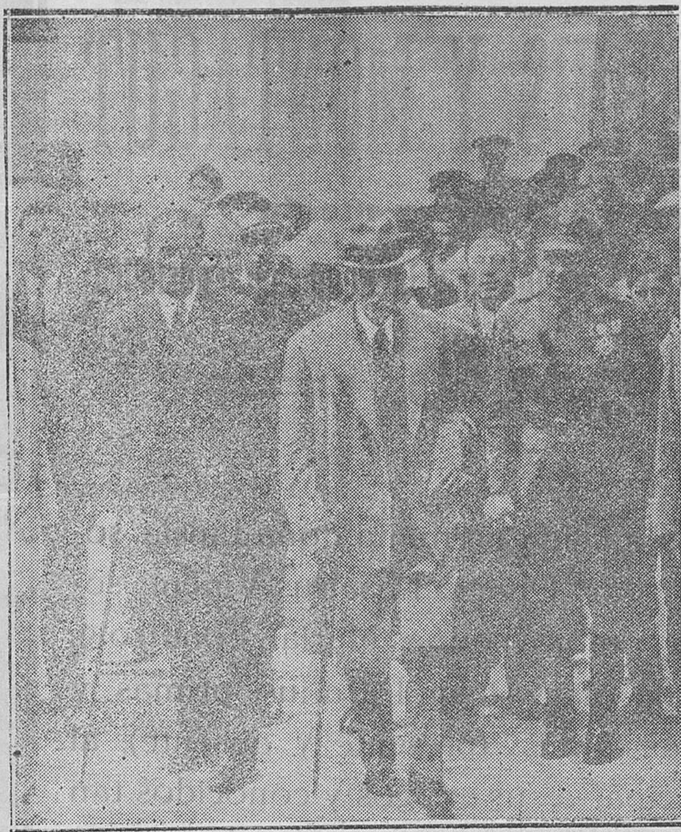
El Presidente de la Generalidad señor Maciá en una de las excursiones realizadas recientemente por algunos pueblos de la provincia de Gerona, a su llegada a la villa Soliña, acompañado del gobernador civil de la provincia