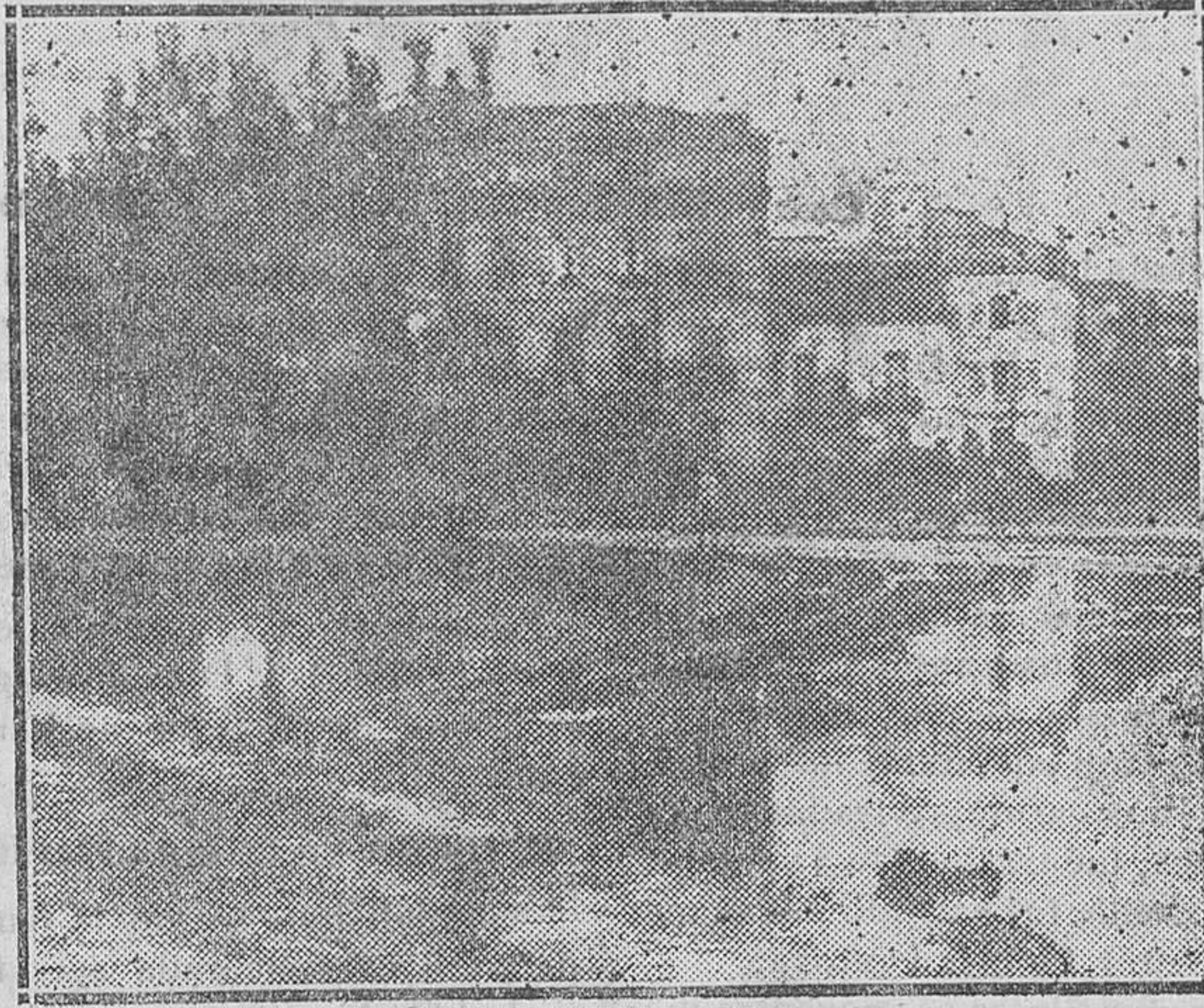
ZARAGOZA - Terrible tormenta que ha producido extensas inundaciones, como puede verse por esta fotografía, en la plaza de Aragón, convertida en una laguna