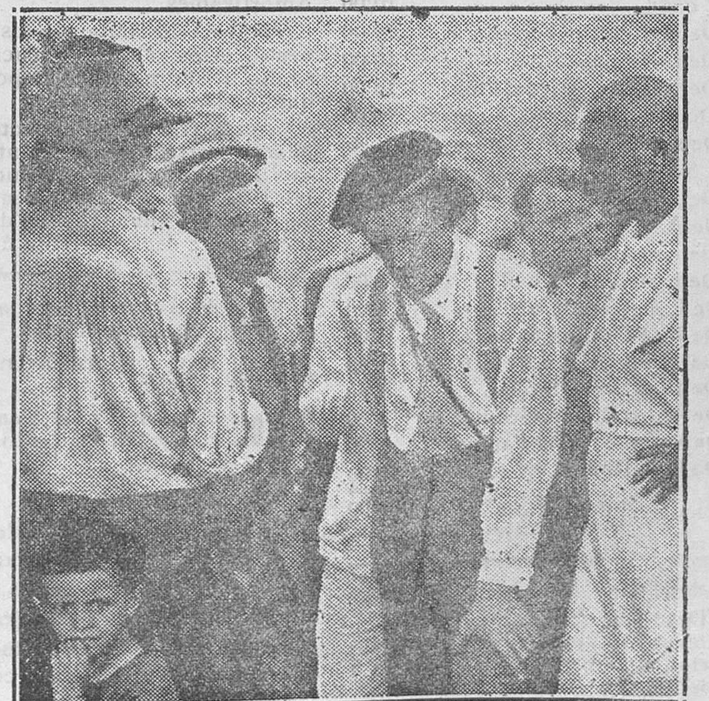
ZURICH.-Momento emocionante del descenso del estratosfera del profesor Piccart, en que después de reposar unos minutos en el suelo se incorpora en la forma trabajosa que puede verse