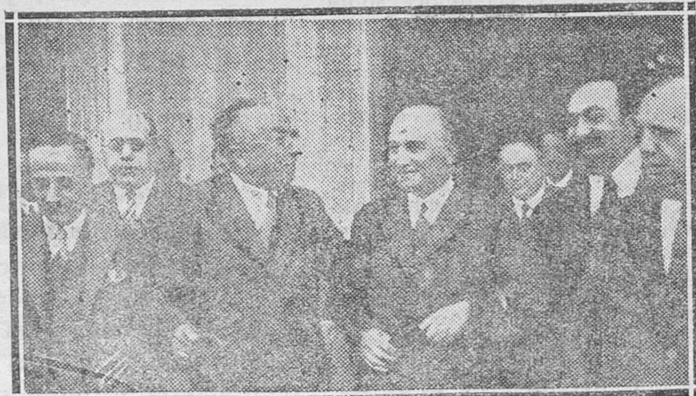
MADRID.—Llegada del Presidente de la República de regreso de su viaje a Santander, siendo recibido por el Gobierno y numeroso público