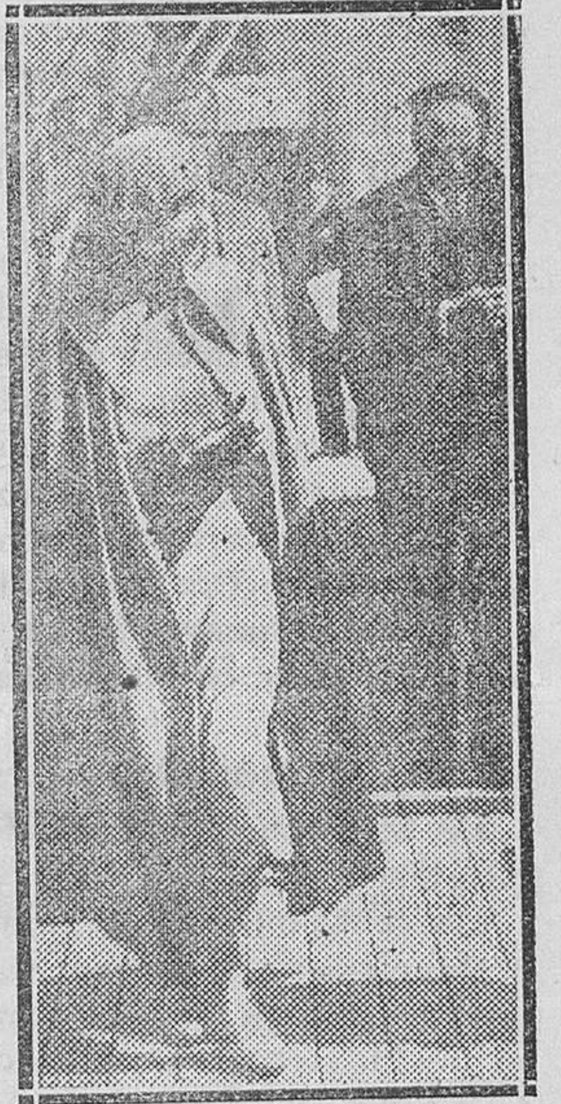
La célebre e insigne actriz cinematográfica Greta Garbo, a su llegada a Suecia