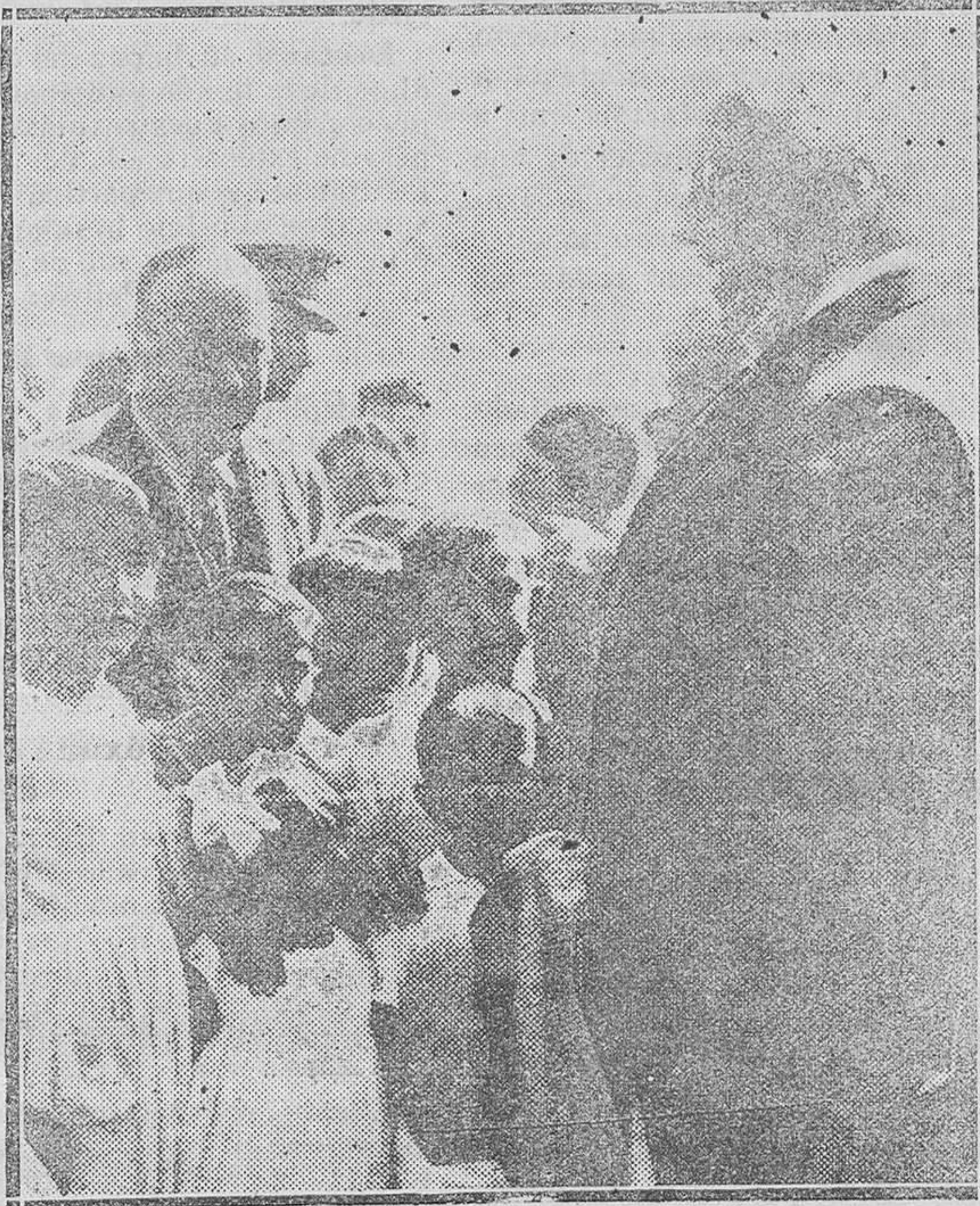
SANTANDER.—El Presidente de la República es invitado por los niños de las colonias escolares madrileñas, departiendo el Jefe de Estado cariñosamente con los chiquillos