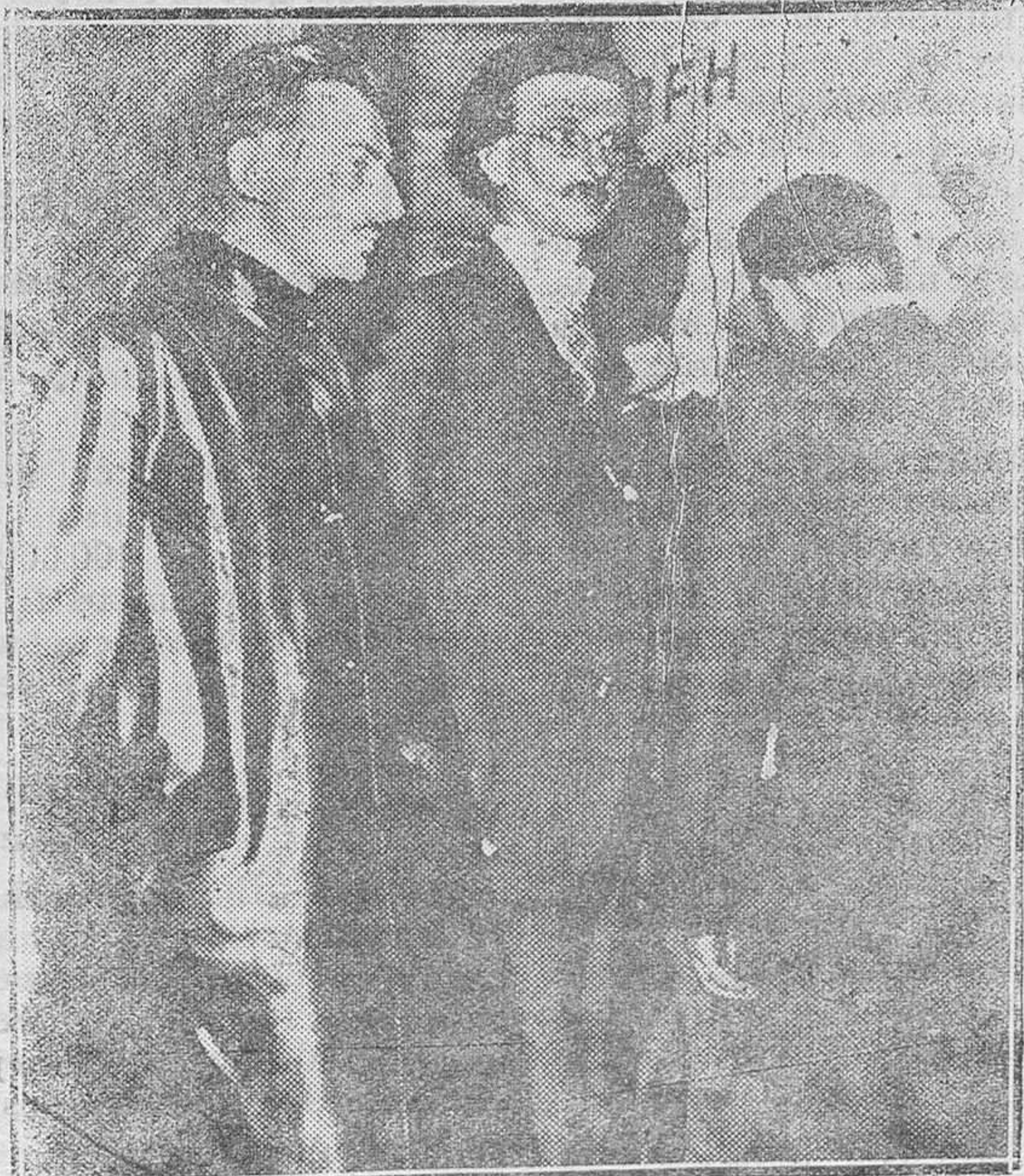
ASCENSIÓN A LA ESTRATOSFERA.—El profesor Picard, con sus compañeros, dando los últimos toques a su aparato, horas antes de su ascensión, que ha tenido el más completo éxito

6. Aun quedando en todo su vigor y firmeza lo declarado en el número precedente, en atención a que, cuando existe causa canónica de separación, los católicos tienen derecho a los efectos civiles de ella dimanantes, seguridad de las personas, debida tutela de los intereses materiales y educación, manutención y bien de la prole, la Iglesia no es contraria a tolerar que los fieles utilicen las leyes civiles para obtener dichos efectos, cuidando, empero, con suma diligencia, que ello no implique en absoluto tibieza en la firme adhesión