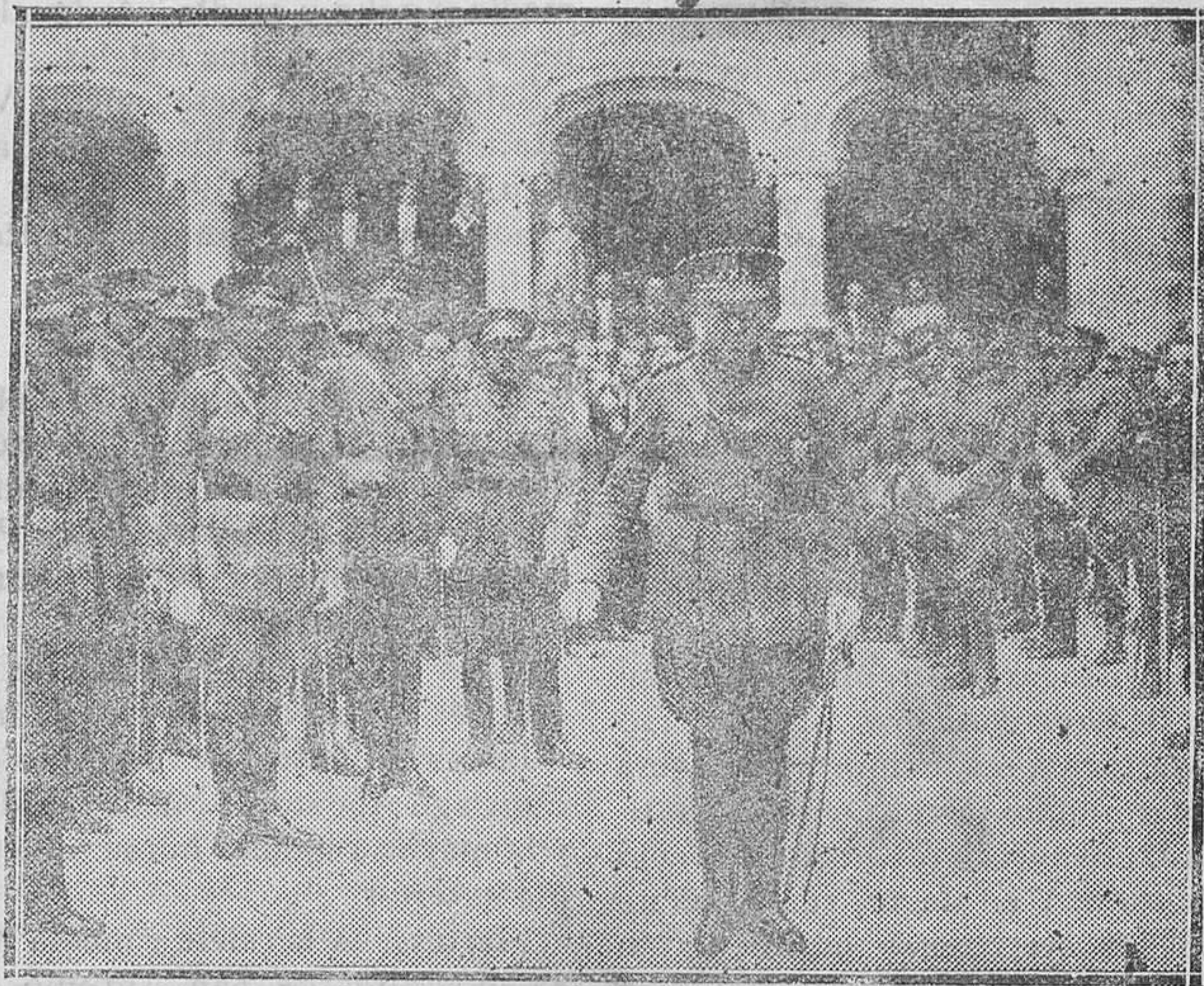
SEGOVIA.— Entrega de sus nombramientos a los nuevos tenientes.— El coronel director de la Academia pronunciando un discurso

Habiendo ocurrido algunos casos de rabia canina en la Península, y al objeto de adoptar las medidas de prevención pertinentes,