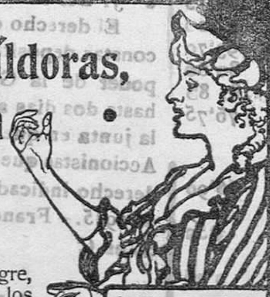
Acorde al grabado a los ojos verá la píldora entrar en la boca.

DE VENTA EN LAS BOTICAS DEL MUNDO ENTERO.