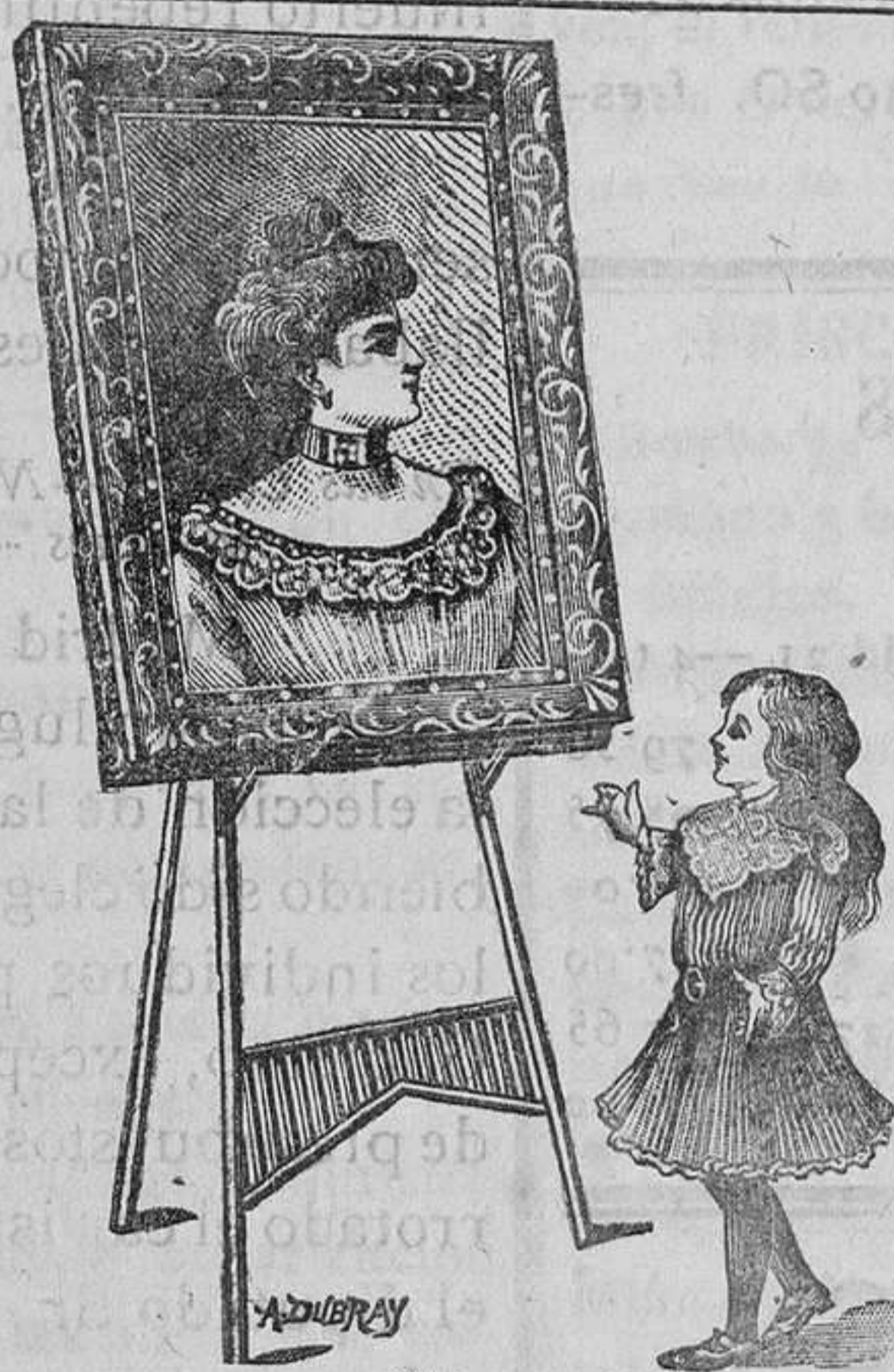
Oh!... es mi mamita!...