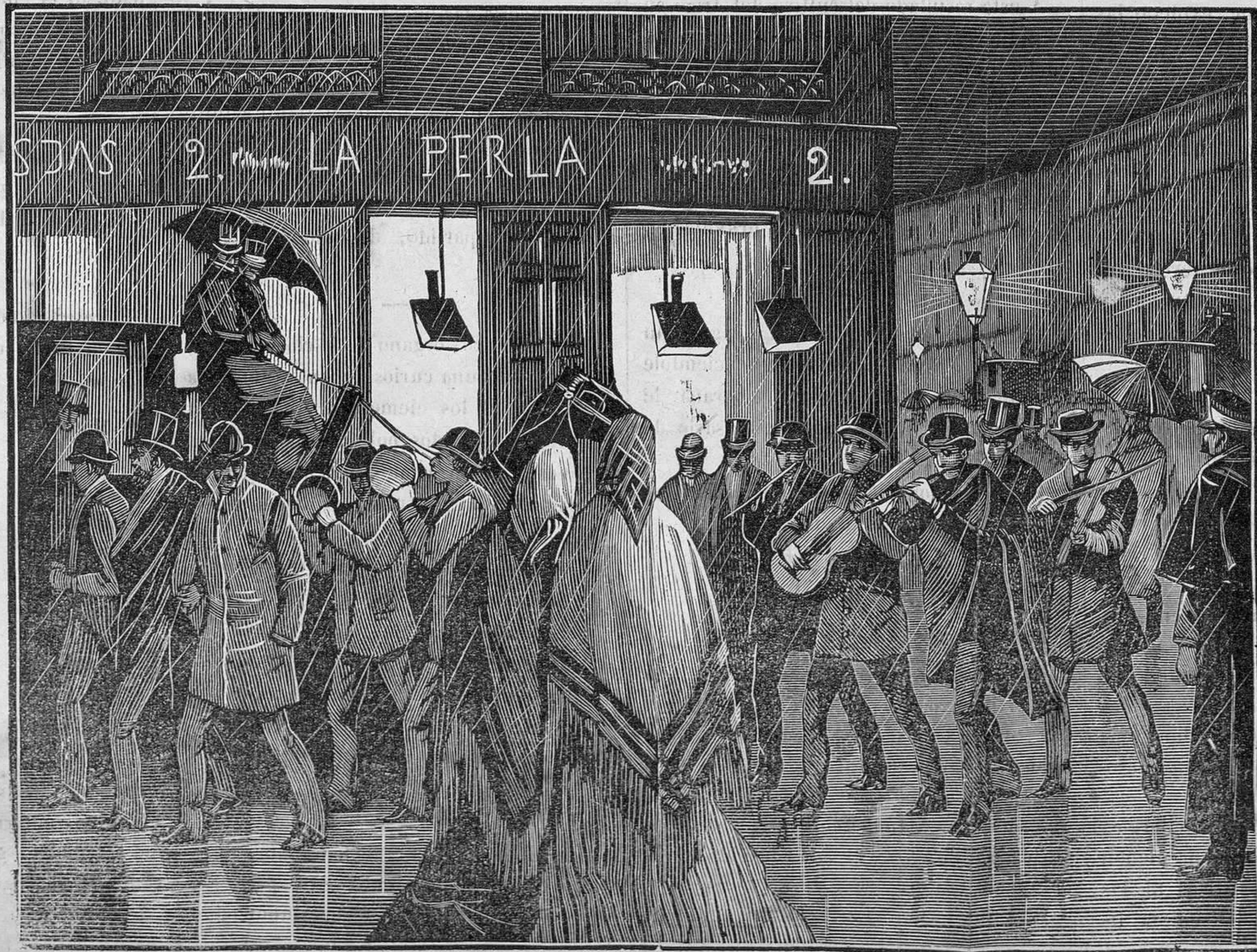
ESCENAS MADRILEÑAS.—ENSAYO DE UNA ESTUDIANTINA.

aprensiones. Todas las bolillas salen del bombo tres veces al mes. Prueba de ello que en todas las extracciones entran de nuevo.