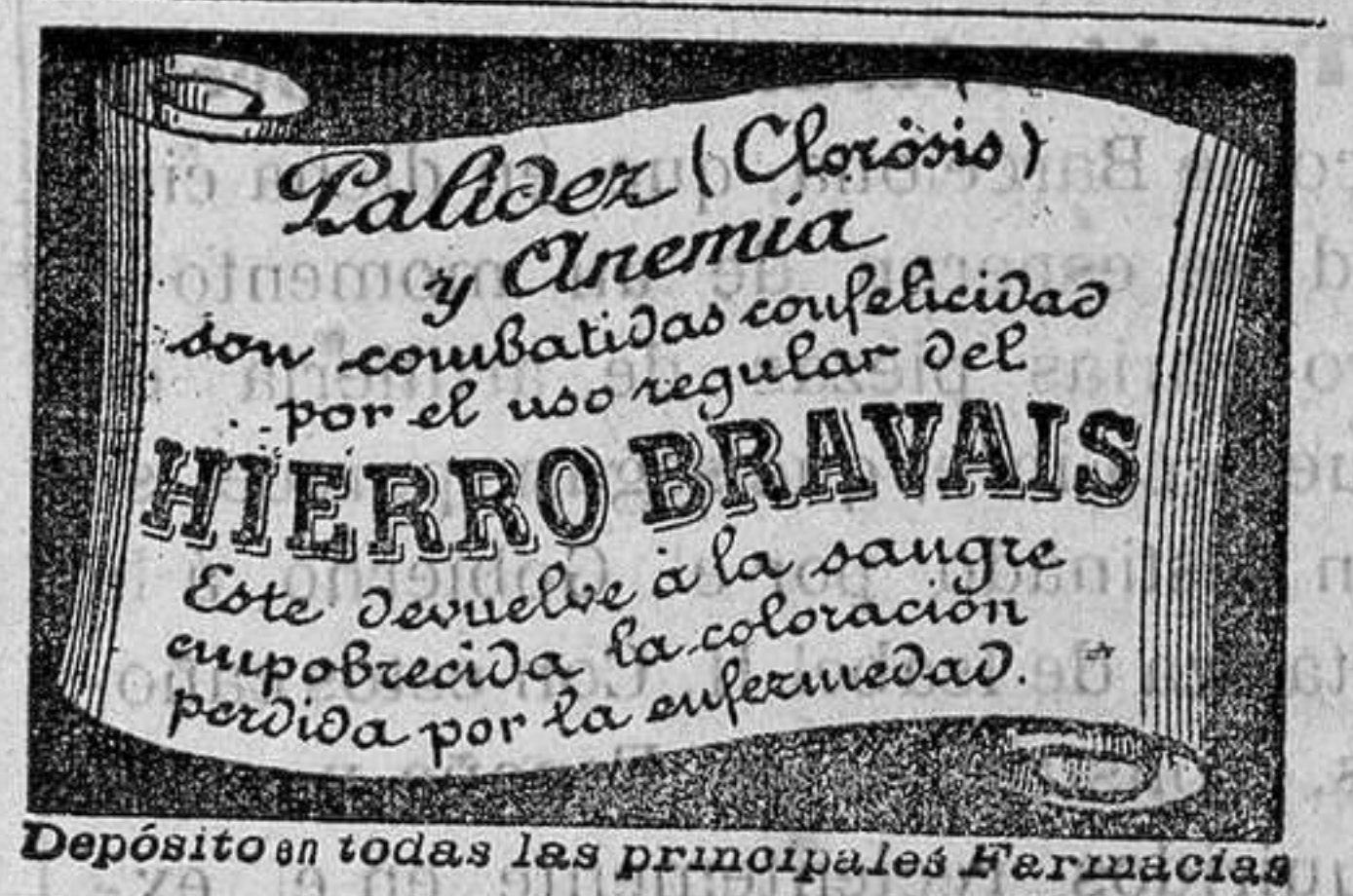
Depósito en todas las principales Farmacias