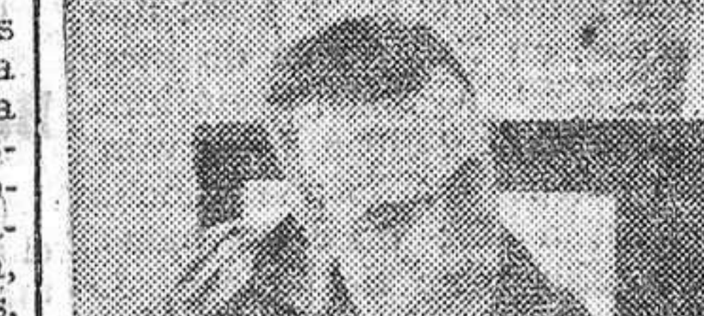
Slayton toca la guitarra.

Cabo Cañaver, 30.—La Administración Nacional de Aeronáutica y del Espacio ha designado al