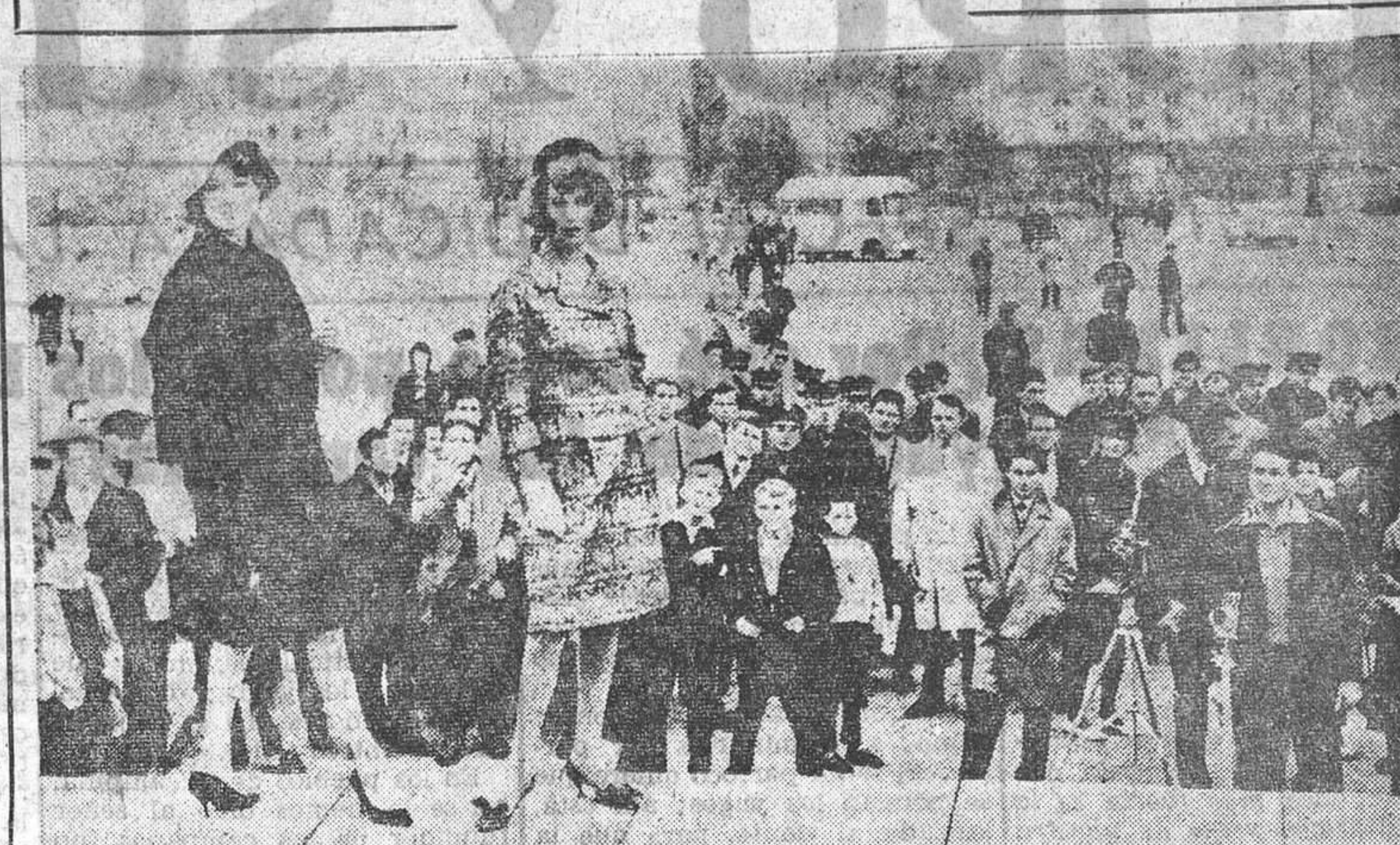
Des modelos italianas desfilando ante una multitud de curiosos. Un desfile pacífico. Los vestidos son de fibra sintética. El desfile es en Varsovia. La foto se tomó mientras se celebraba en la capital polaca una exposición organizada por los grupos industriales italianos Montecatini y Rhadatoce, de productos fabricados en plástico. También ha sido presentada la exposición en Praga y en Budapest y acogida con admiración.