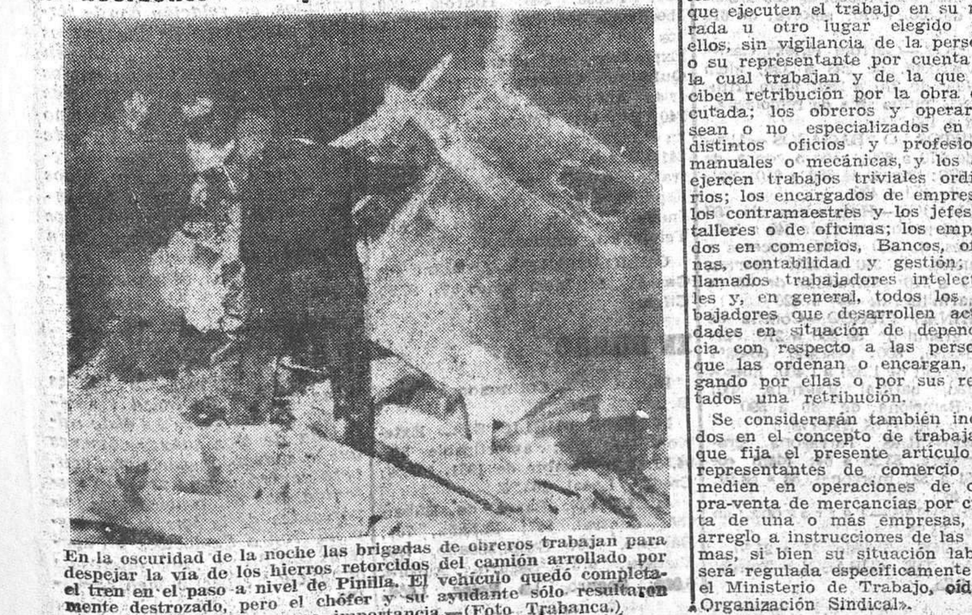
En la oscuridad de la noche las brigadas de obreros trabajan para despejar la vía de los hierros retorcidos del camión arrollado por el tren en el paso a nivel de Pinilla. El vehículo quedó completamente destruido, pero el chófer y su ayudante sólo resultaron con lesiones de escasa importancia.