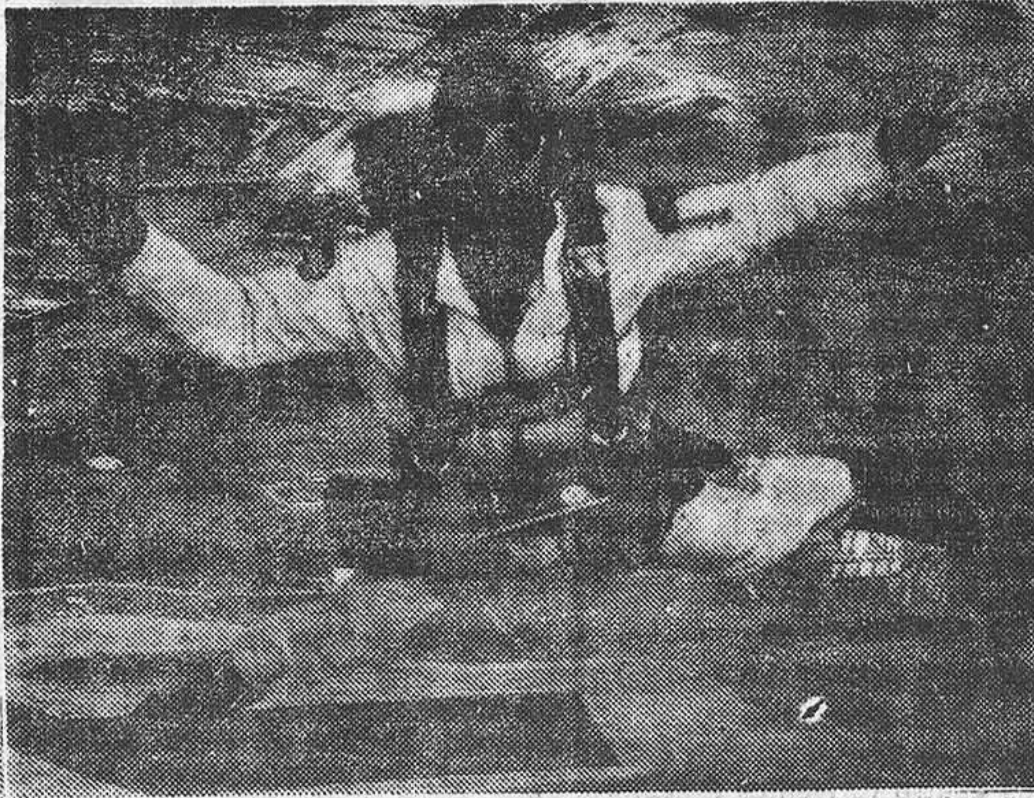
Un espectacular salto de uno de los participantes en el I Campeonato Nacional de Paracaidismo, organizado por el Real Aereo Club de España, celebrado en el aeródromo de Cuatro Vientos. Tomaron parte cincuenta y ocho paracaidistas de Madrid, Sevilla, Alcantarilla y Valencia.

antiguamente existía, a los desplazamientos por el aire. Pero se ha llegado a más. Así vemos estos acontecimientos en que hombres y mujeres practican el deporte aéreo con singular entusiasmo, conscientes de que con ello se entregan a una serena distracción, pero también de que se preparan para el mañana, por