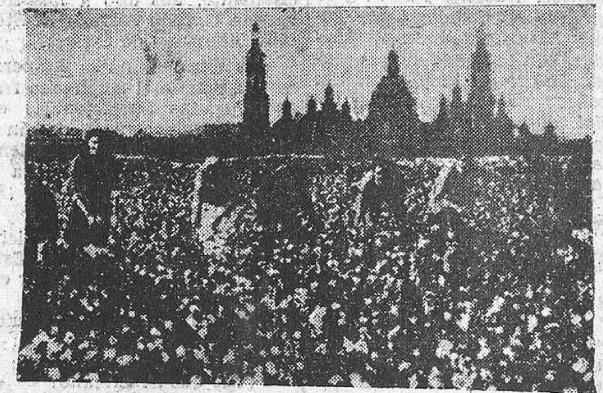
Plantación de algodón. Al fondo, la Basílica del Pilar.

cientos cincuenta mil balas, de las que actualmente se consumen en quinientas cincuenta mil. Importa destacar que, por ahora, los planes de modernización y renovación de la industria textil, en período de replantamiento, no presentan aumento de mayor consumo, lo que, por otra parte, al estar la demanda más bien estacionada, parece lógico pensar que no habrá escaseces de materia prima, lo que nos lleva a la conclusión de que la manufactura no ha de aumentar su precio, por ser la oferta la que manda dentro de este juego, en el que también cuenta