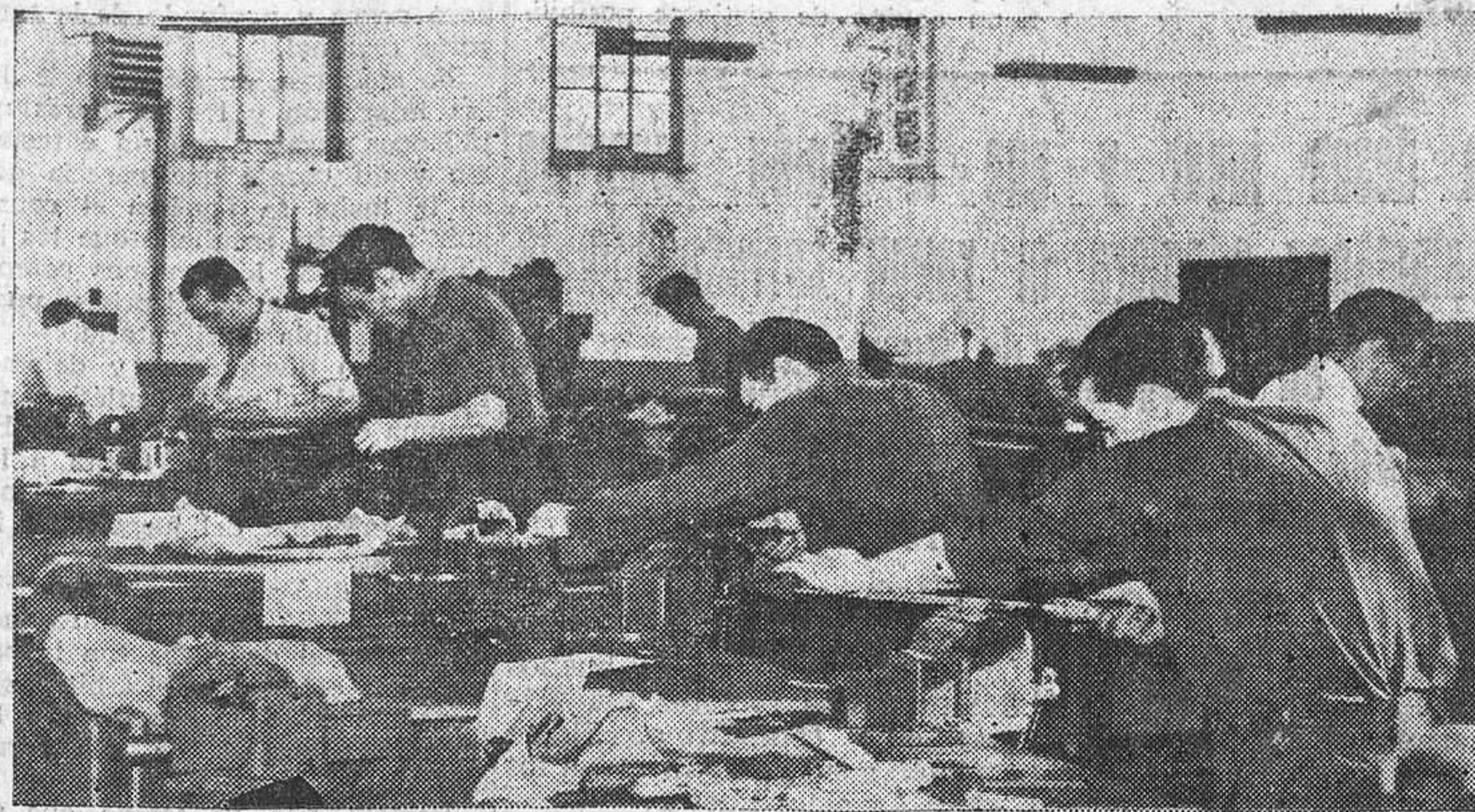
El trabajo precisa de una atención precaver con los medios necesarios los accidentes que pueden surgir.

Durante los días 13 al 18 del presente noviembre, va a celebrarse en Madrid la "Semana de Lucha contra los Accidentes de Trabajo", que en números redondos han llegado a alcanzar en España, durante una anualidad, la impresionante cifra de seiscientos cincuenta mil.