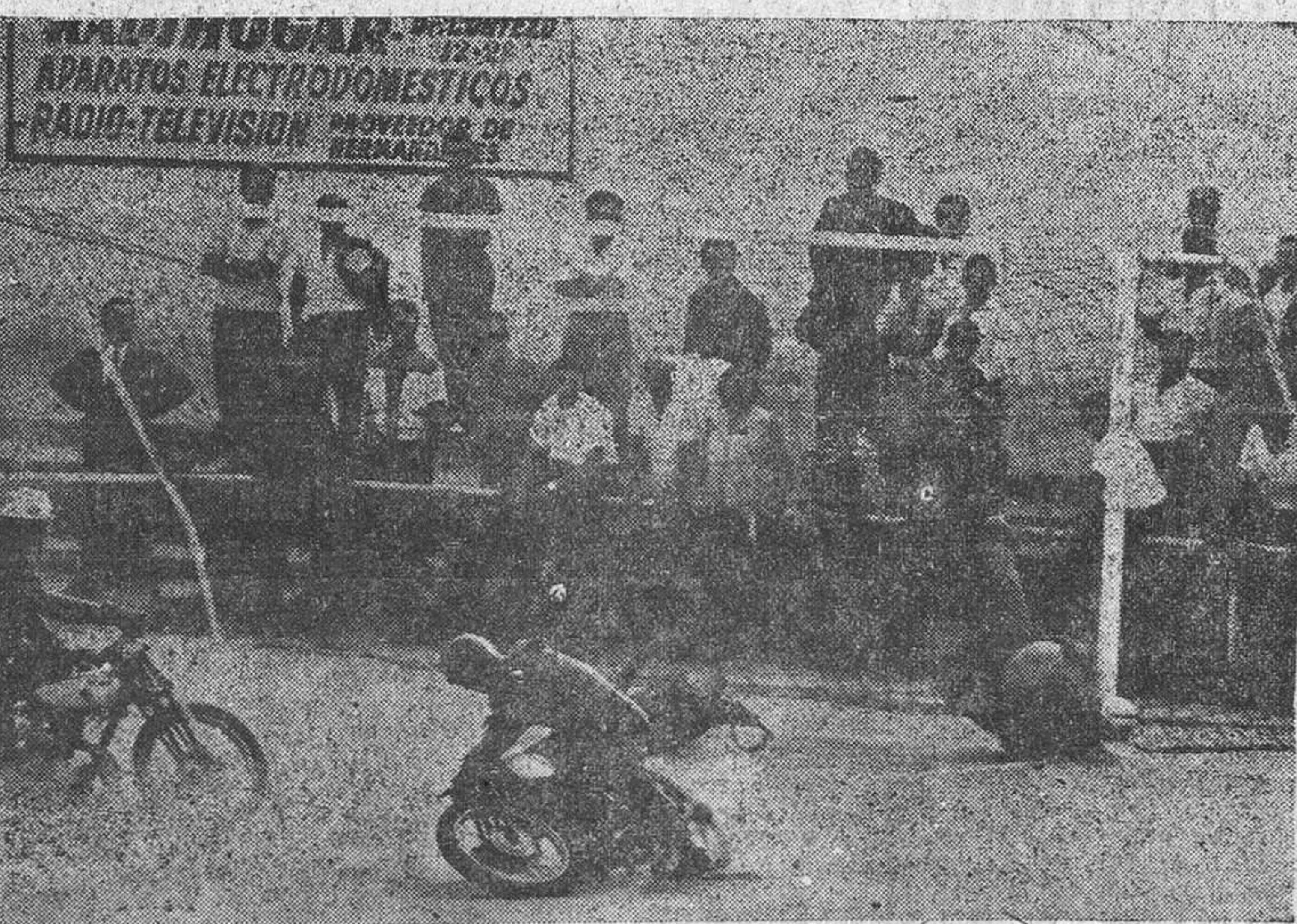
Madrid.—Mitad fútbol, mitad motorismo, los equipos franceses de Villefrance y Cavillonais han dado en Madrid una exhibición interesantísima de moto-ball, en el Estado de San M. quel. Los equipos, de cinco jugadores, con sus máquinas respectivas —tres delanteros, un defensa y un portero— jugaron tres tiempos de veinte minutos con un balón de 40 centímetros de diámetro. He aquí un momento de la exhibición, expectacular e interesante.