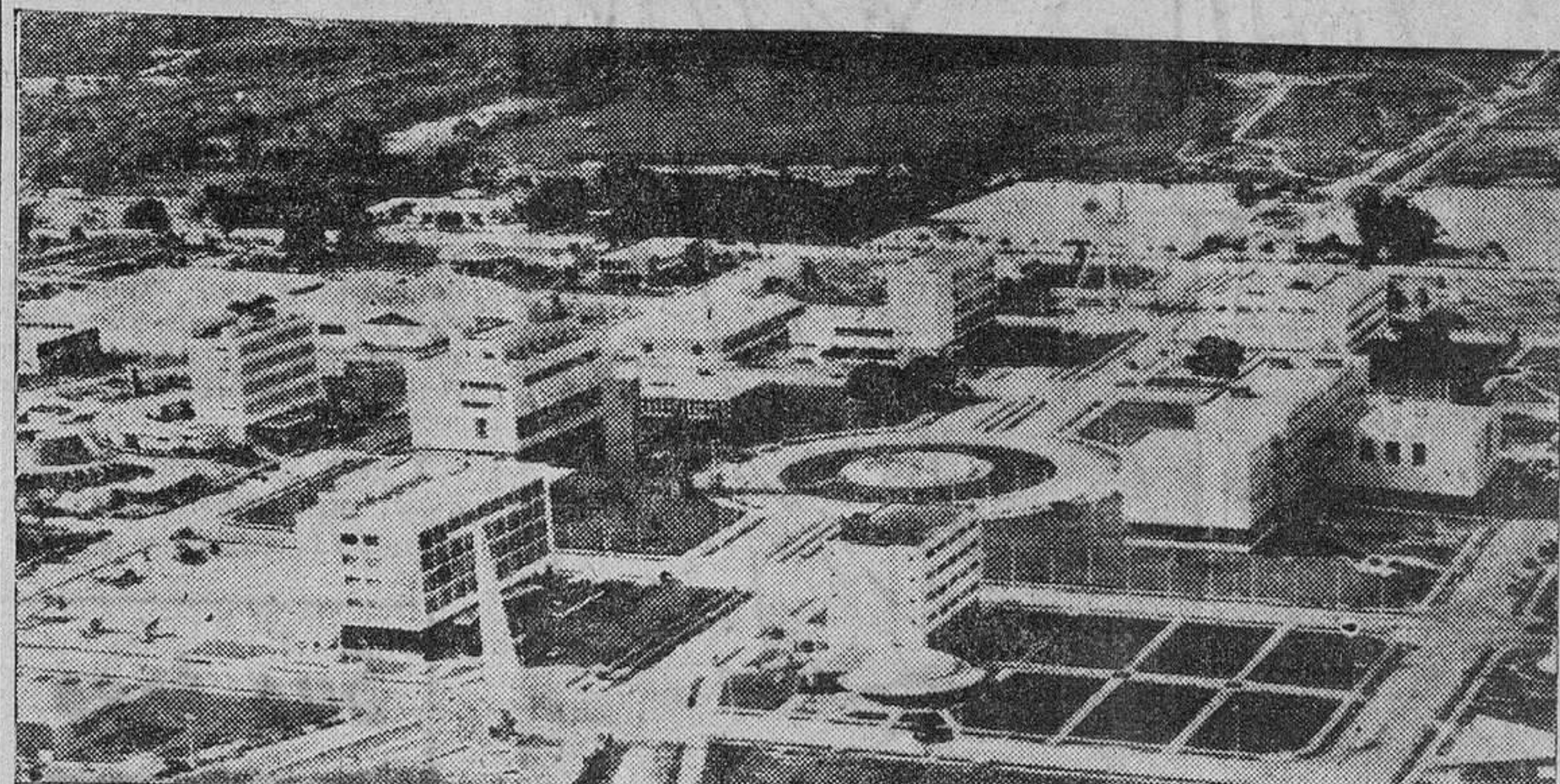
Esta vista tomada desde el Mar Caribe muestra parcialmente la FERIA permanente de la Paz Mundial en Ciudad Trujillo. El fabuloso Hotel El Embajador mira hacia la sede de la FERIA, donde setenta y nueve edificios y pabellones enlucen 125 acres de exhibiciones del progreso de la República Dominicana en los veintiséis años de la Era de Trujillo.

Los graves comentaristas que aluden a los perjuicios que puede producir la entrevista sobre los aliados occidentales, parecen desconocer esta realidad y quieren buscarla en principios absolutos y radicales. Lo cierto es que Kennedy sabe, igual que Krushchev, que la capacidad de acción irreversible depende y descansa en sus dos países. La naturaleza del riesgo contemporáneo es tal que se ven obligados, aunque sea a "contra-corazón", a parla-