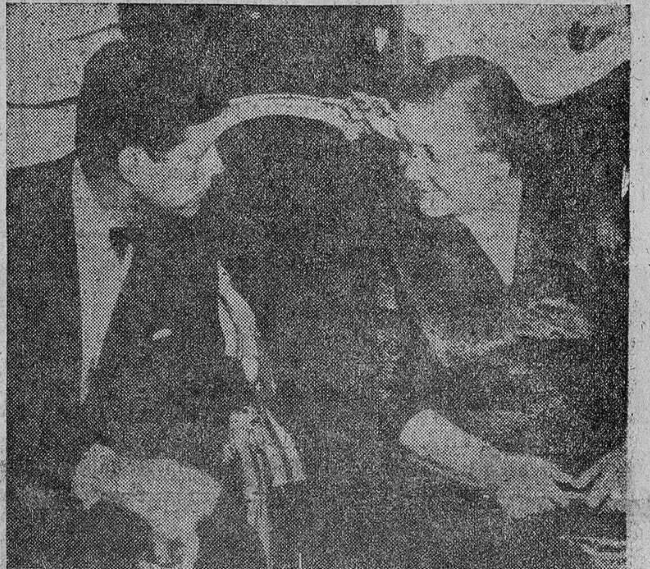
Aspectos familiares de las entrevistas de Viena. Kruschov se siente feliz al lado de Jacqueline Kennedy y el Presidente norteamericano intenta comprender a Nina. Las dos mujeres emplean su simpatía como pretexto a las conversaciones que más tarde los dos estadistas habrían de celebrar.