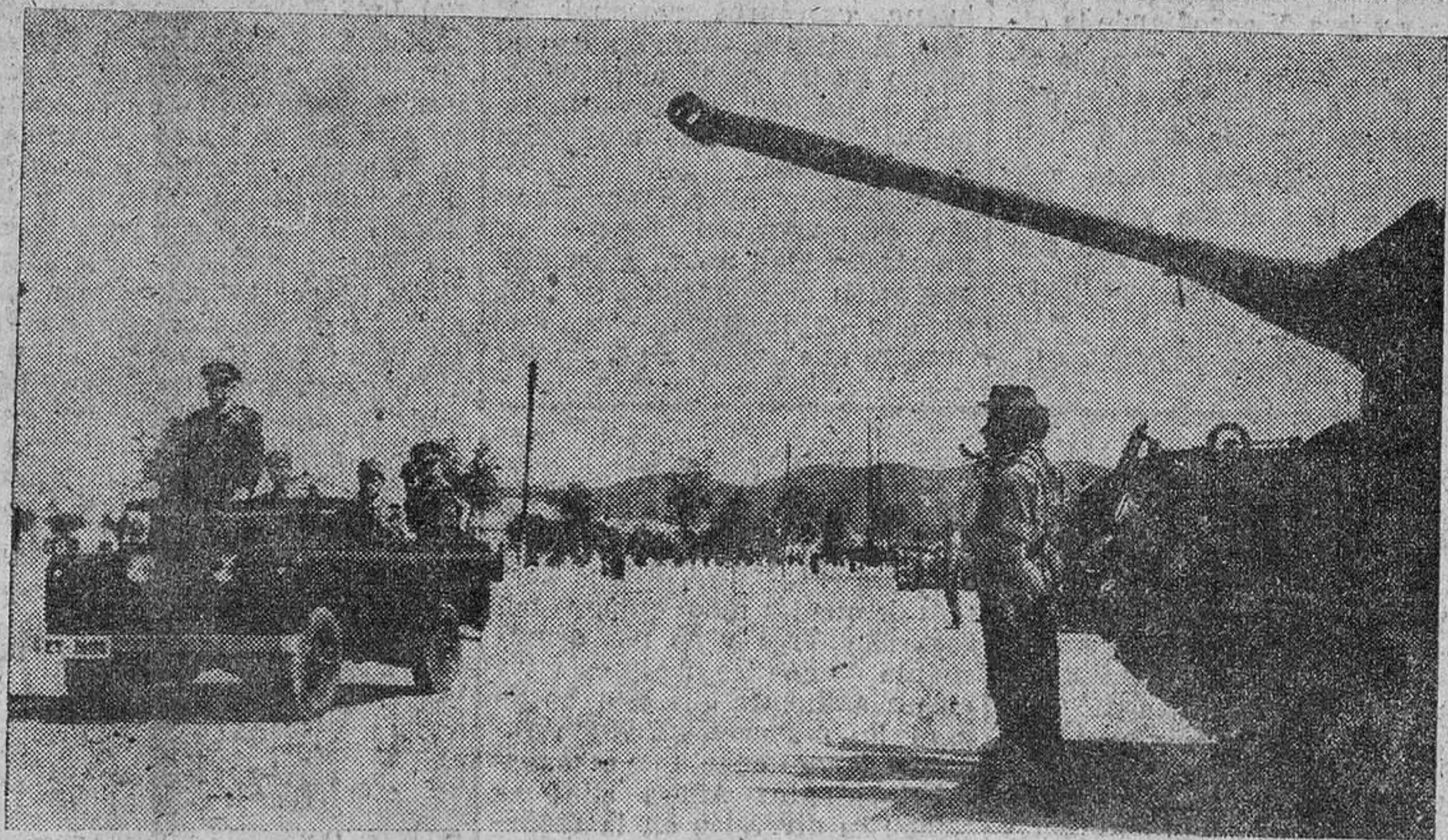
VALENCIA.—El ministro del Ejército, teniente general Berroso, revisando a las fuerzas de la división "Maestrazgo", que al mando del general don Héctor Vázquez participaron en un supuesto militar táctico en las proximidades de Bétera.