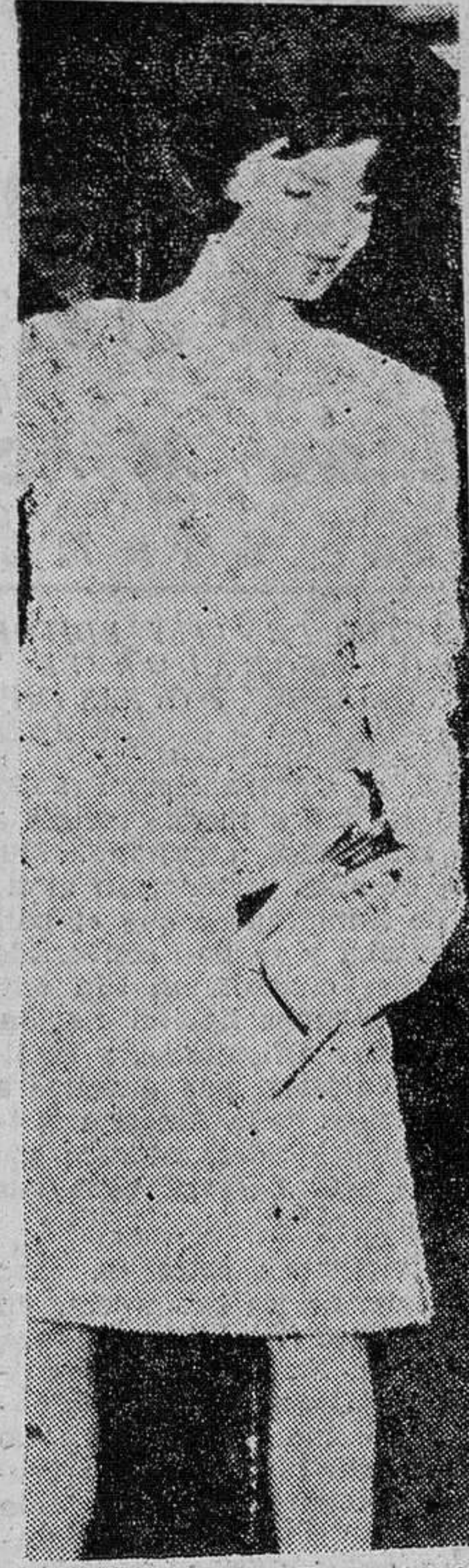
A Jacqueline Kennedy le gusta enseñar las rodillas.

Puede, en resumen, decirse que Jacqueline Kennedy, no obstante pequeños pecadillos de estilo o menudencias de errores, observados a veces, es, indudablemente, una dama de elegancia segura. Se lo debe en mucho a su sastre, Oleg Cassini. Ahora lo confirma en París con motivo de su viaje.