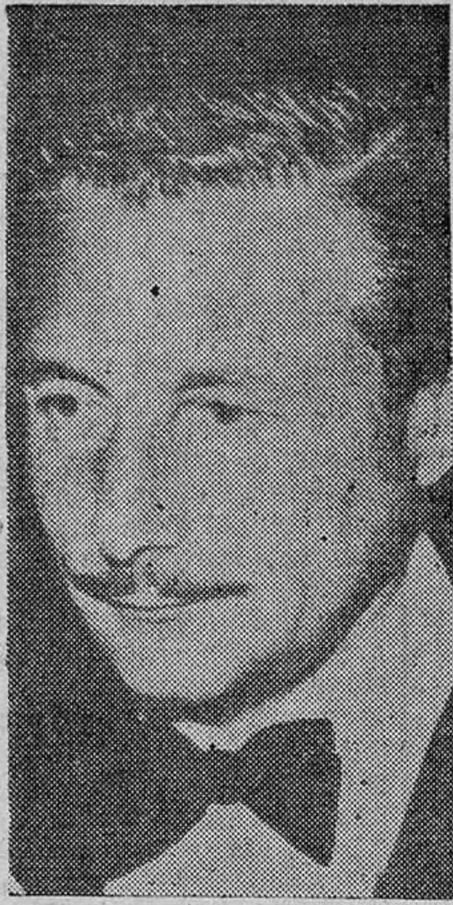
Este es Oleg Cassini, el modista de la señora Kennedy.

nedey para darse cuenta de que todo su ropero es de típica inspiración francesa, incluidos los modelos diseñados para ella por Oleg Cassini, norteamericano, oriundo de Florencia: de espléndida línea todos, sobrios, elogiados desde cualquier concepto, pero demasiado parisinos.