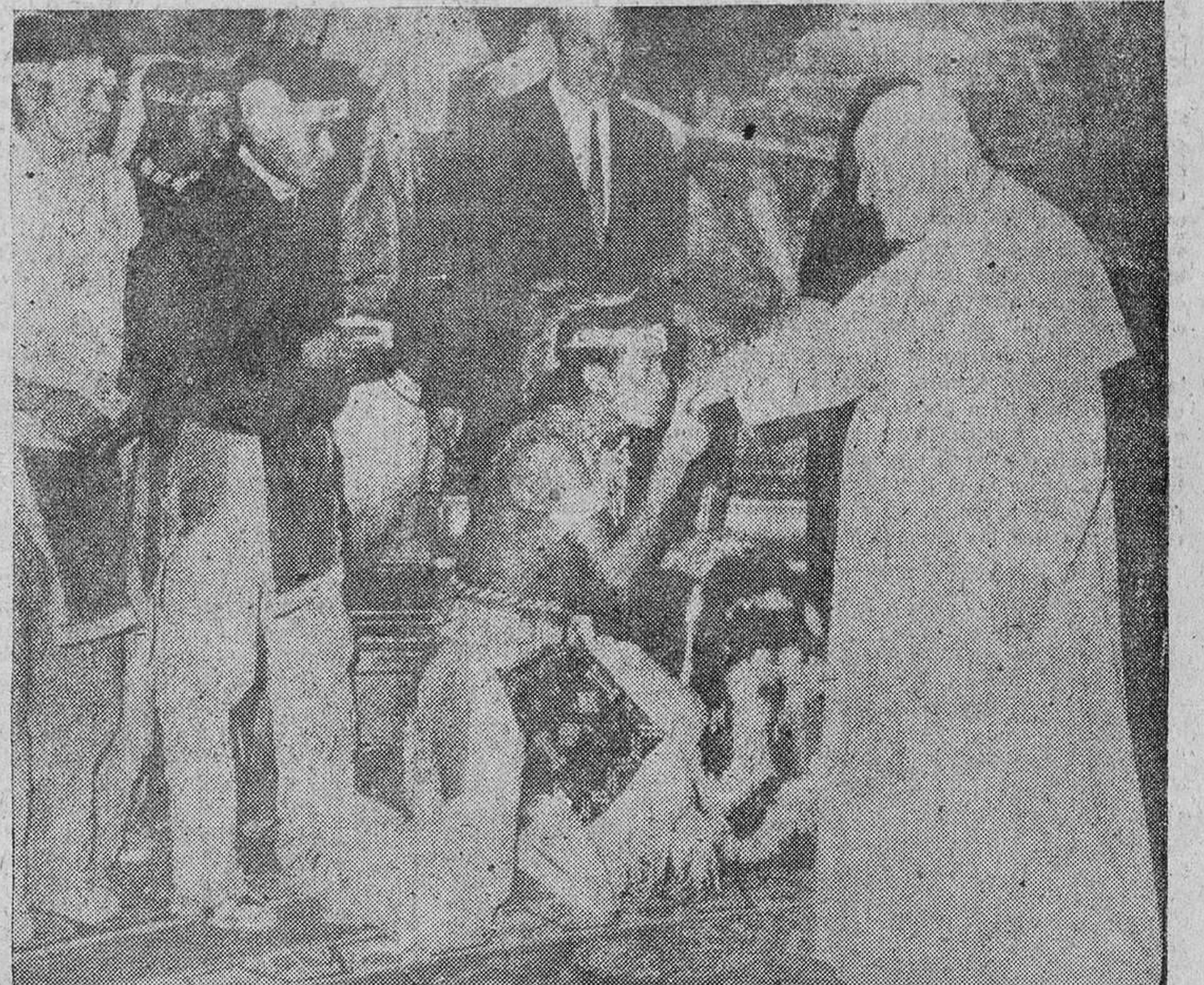
Durante la audiencia concedida por S. S. Juan XXIII a los indios navajos, el fotógrafo "sorprendió" a uno de ellos besando el anillo pontifical.