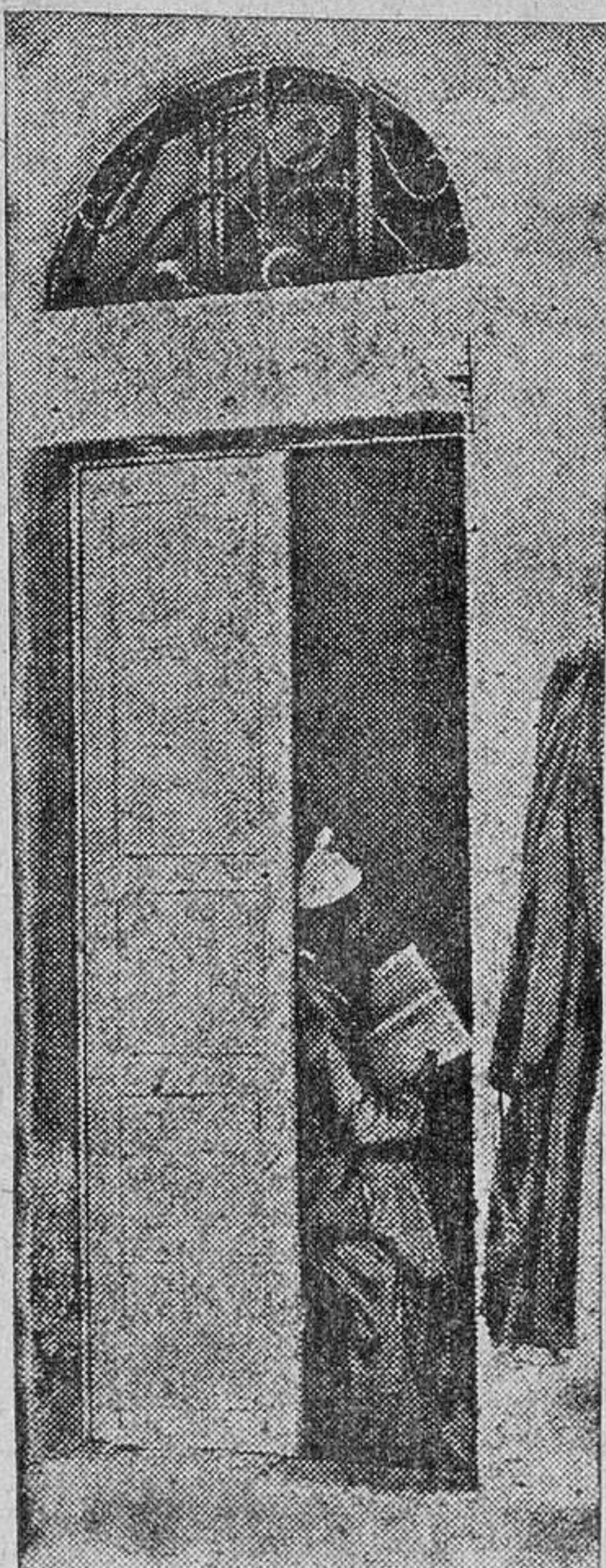
La estampa de un viejo rabino.

Al hacer estos cálculos, las autoridades israelíes han tenido en cuenta que la población del país