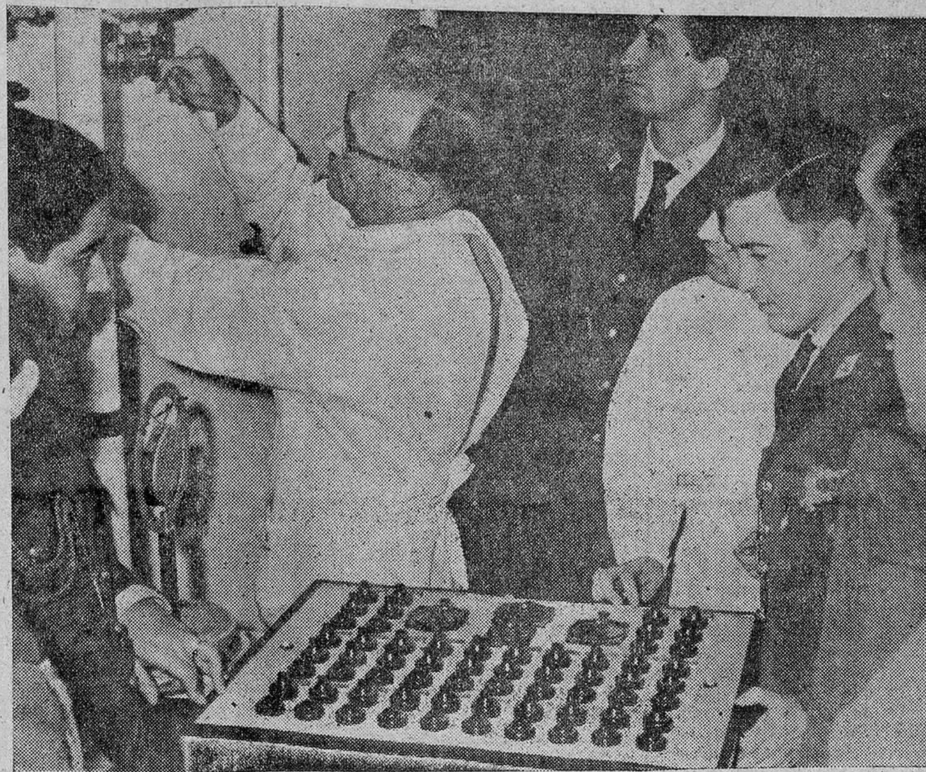
Los doctores controlan desde el exterior de la cámara los fenómenos físicos que se operan en el alumno.

—Los ingenieros crean el vehículo y nosotros cuidamos del ración, del mono o del hombre. La misión específica del CIMA, aparte de la investigación