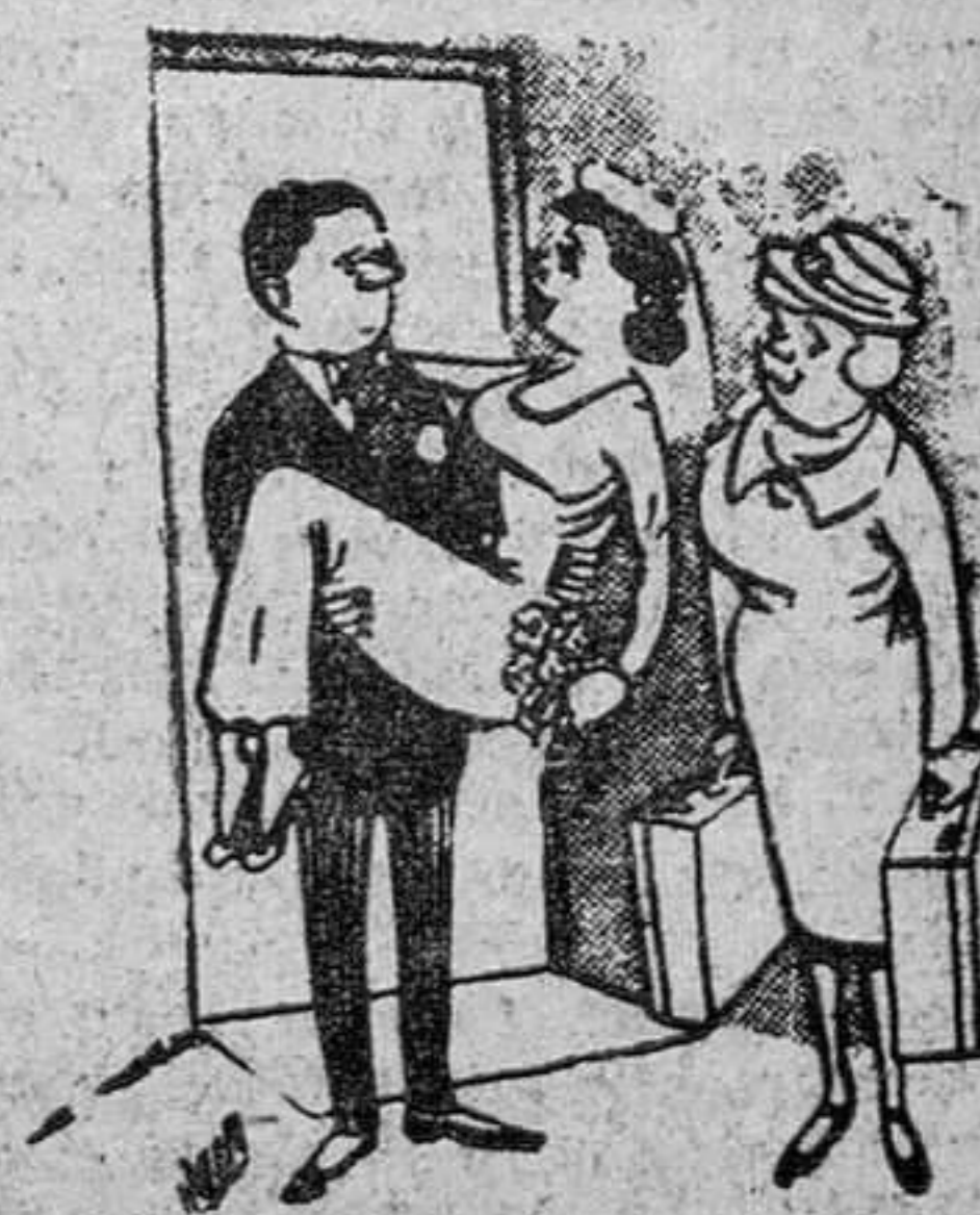
—No te asustes, querido Mamá se ha ofrecido para estar con nosotros para cuidar del niño que tenemos.