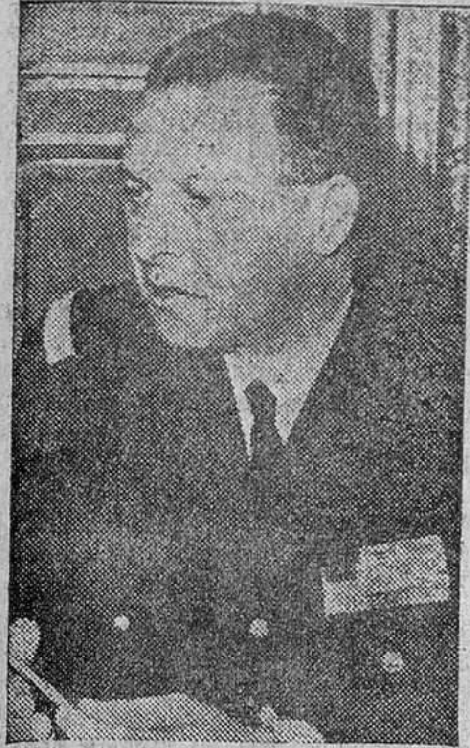
EL GENERAL CHALLE

El Ejército ocupa la totalidad de Argelia occidental, desde el Mediterráneo al Sahara