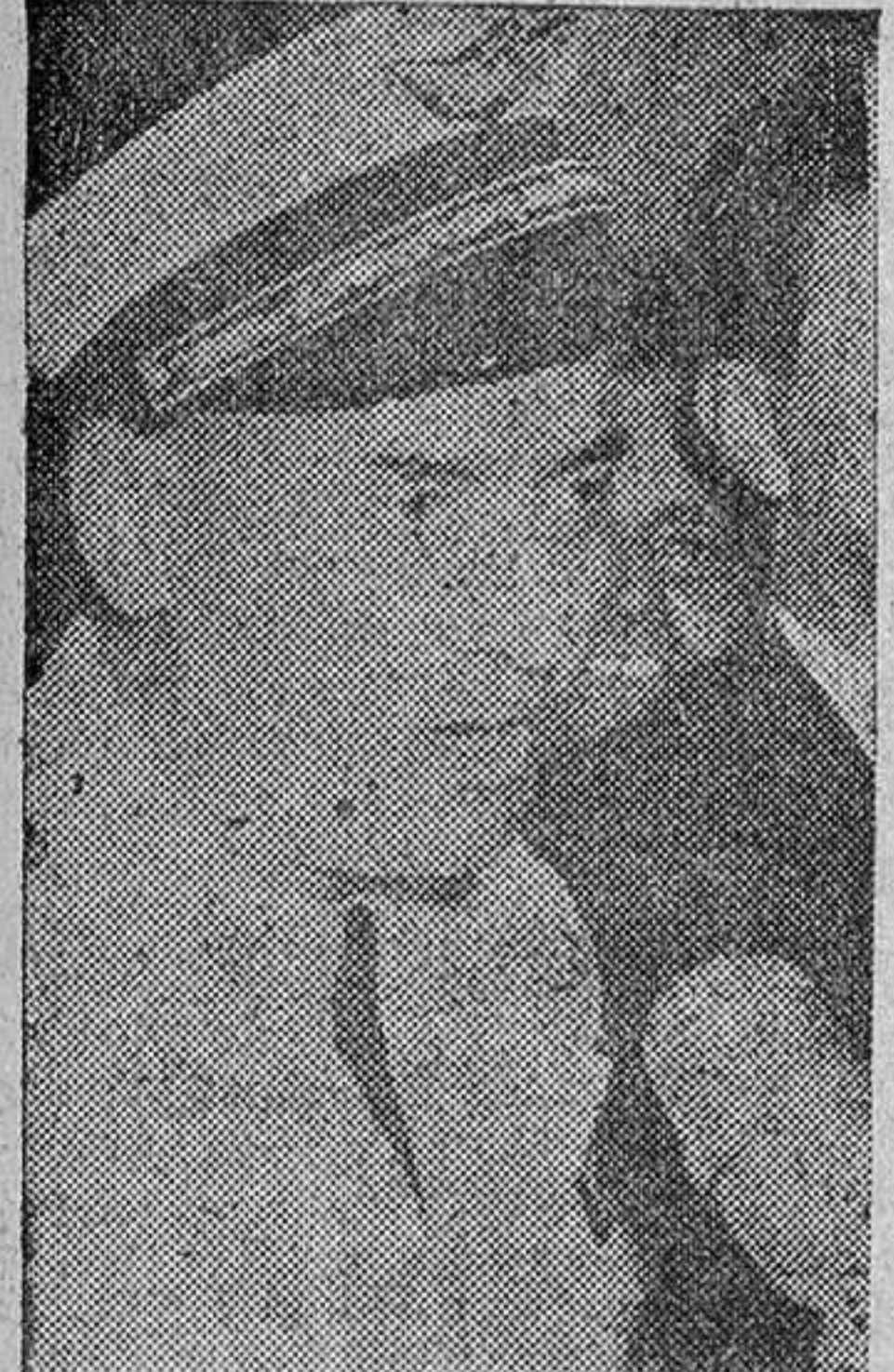
EL GENERAL JOUHAUD