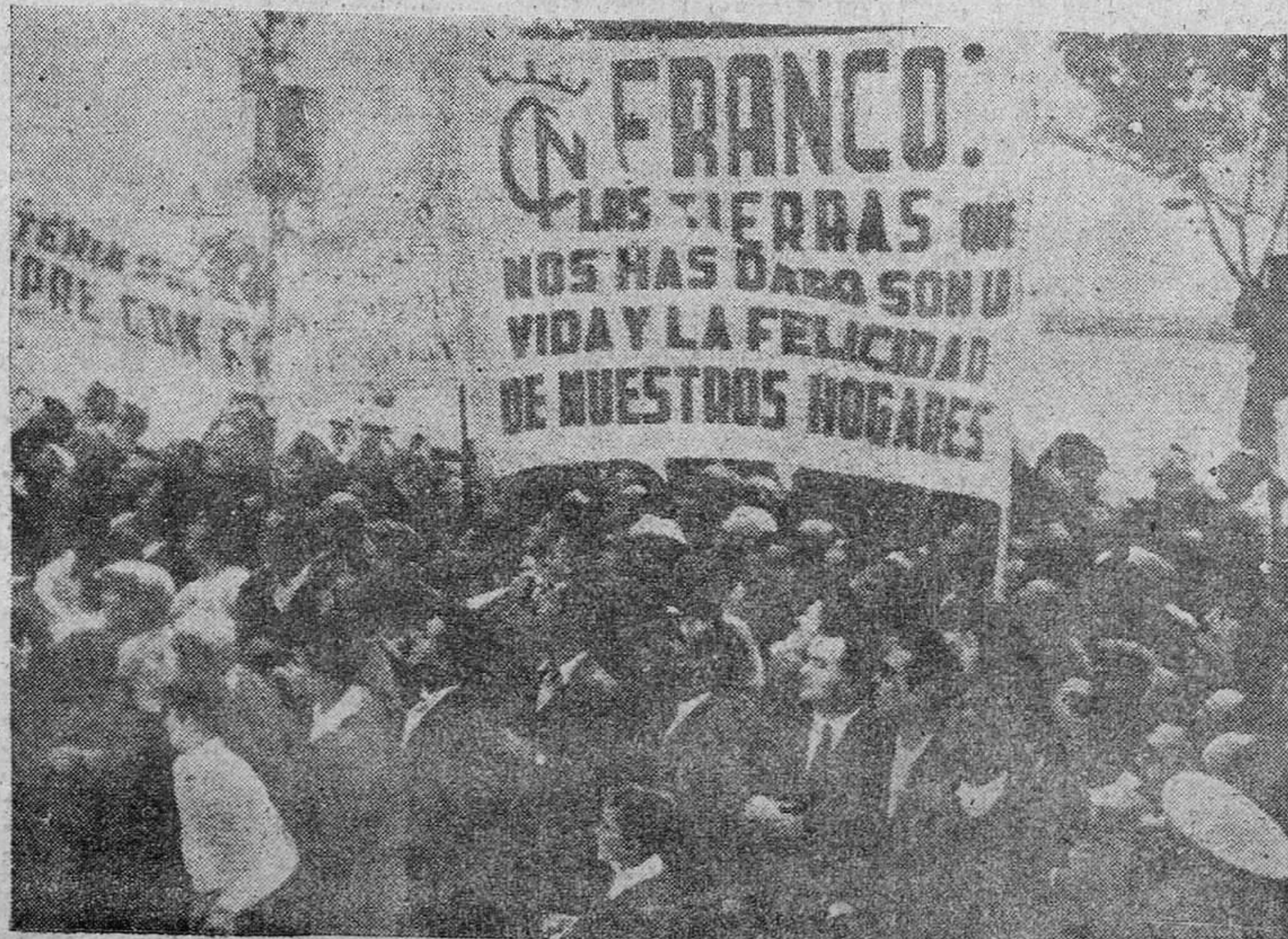
ASI HAN RECIBIDO LOS JAENENSES AL CAUDILLO