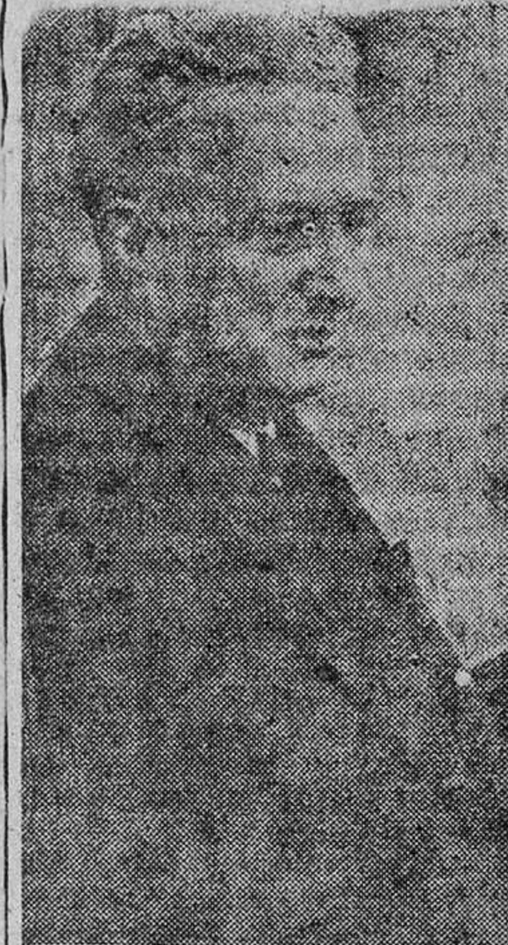
Luis Joxe, ministro francés para Asuntos argelinos.