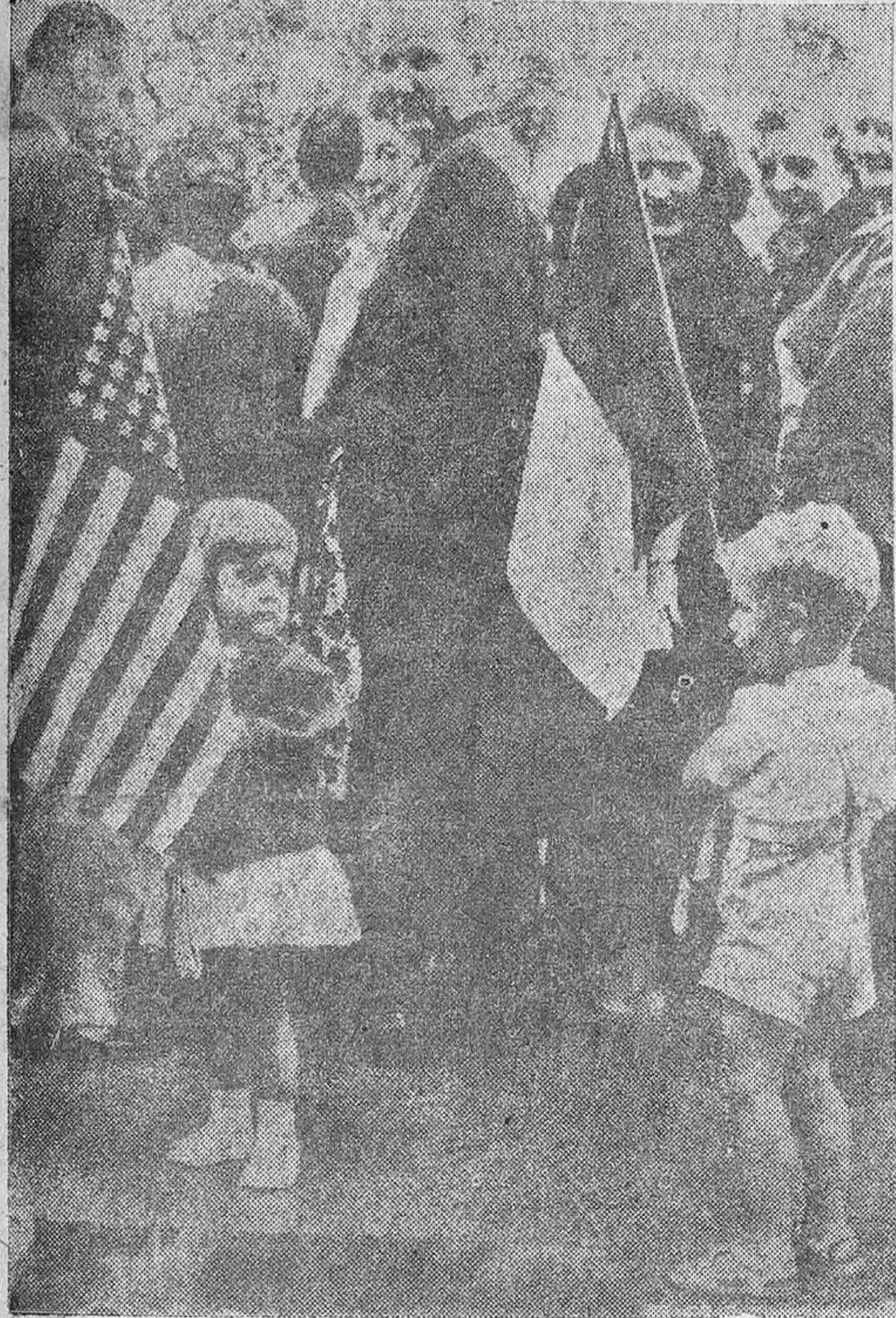
Los niños del mundo que, como todos los hombres libres desean la paz para el mañana, saludan también y aclaman a Ike durante sus viajes.