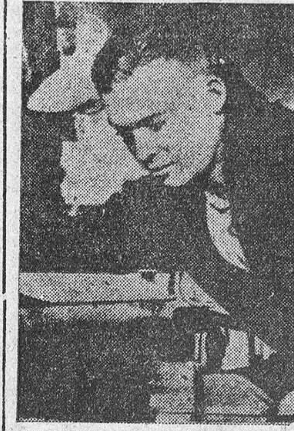
Eisenhower estudiante de la Academia Militar, donde obtuvo el número 64 entre ciento sesenta y cuatro alumnos en West Point.

Muchos de los norteamericanos opinaban que Eisenhower era el hombre indicado para ocupar la Presidencia de los Estados Unidos. En 1952, cuando hubo dejado en