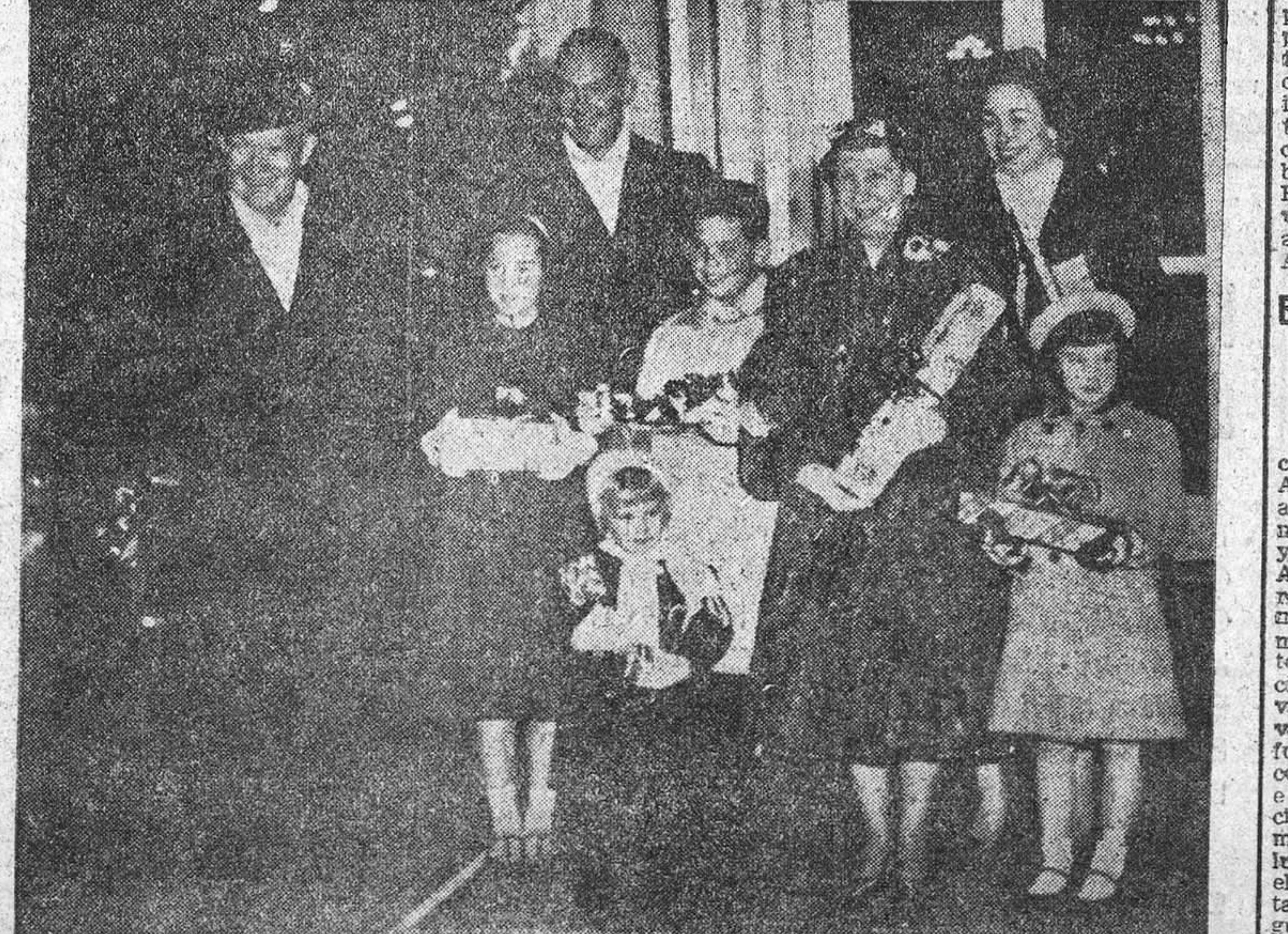
Eisenhower con su familia. Al fondo, su hijo y esposa, que le acompañan en su viaje.

Las fuerzas inglesas combatían con los alemanes en el norte de África. Las aliadas necesitaban aquel territorio para utilizarlo como base de operaciones del proyectado ataque a Europa. En El Alamein, los ingleses se mantuvieron con tenacidad en sus posiciones y consiguieron repeler las acometidas alemanas. Simultáneamente, Eisenhower, con ochocientos cincuenta barcos y doscientos noventa mil soldados, ordenó la invasión de la costa africana. Las fuerzas terrestres, navales y aéreas combinadas de los Estados Unidos e Inglaterra, con la ayuda de Francia, constituirían un formidable elemento de combate. Después de una lucha encarnizada de seis meses, el enemigo sufrió aplastante derrota en Túnez y en Bizerta. La siguiente etapa en las operaciones militares sería la invasión de la is-