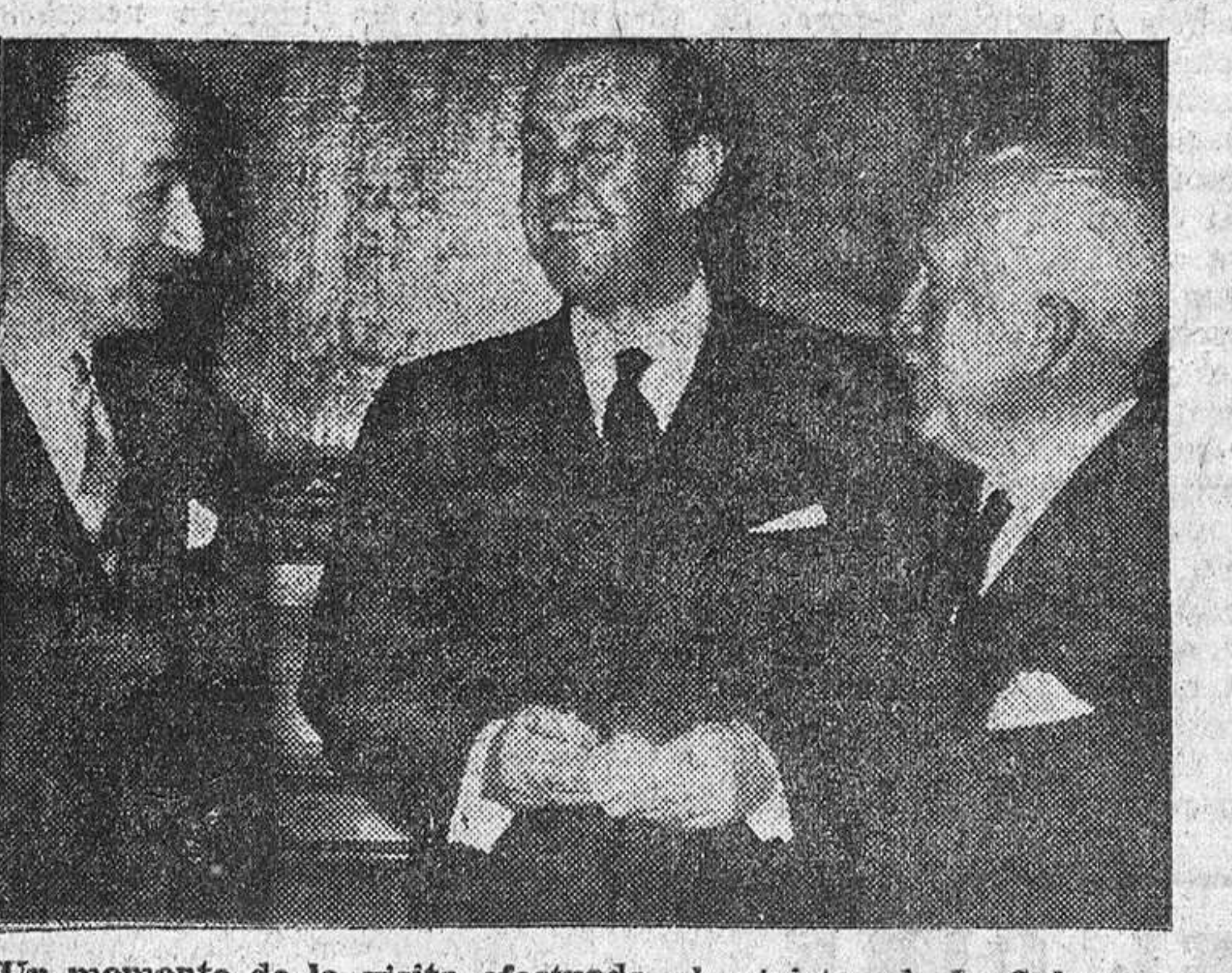
Un momento de la visita efectuada al ministro de la Gobernación, general Alonso Vega, por el doctor R. Vitolo, ministro argentino del Interior, acompañado del embajador de los países, señor D'Andrea, a la izquierda.