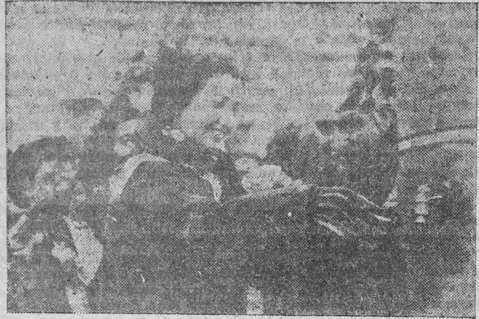
La esposa del señor Gobernador Civil, inaugurando una de las fuentes del abastecimiento de agua en Vezdemarbán.

El pasado miércoles, Vezdemarbán vivió una trascendental jornada al ser inaugurado su abastecimiento de agua por el Gobernador Civil y Jefe Provincial del Movimiento, en sus ya casi ochodécas visitas por los pueblos y tierras zamoranas. Peregrinar constante un hombre entregado por entero a los más altos ideales del bien común y resurgir de una provincia que estamos viendo transformada