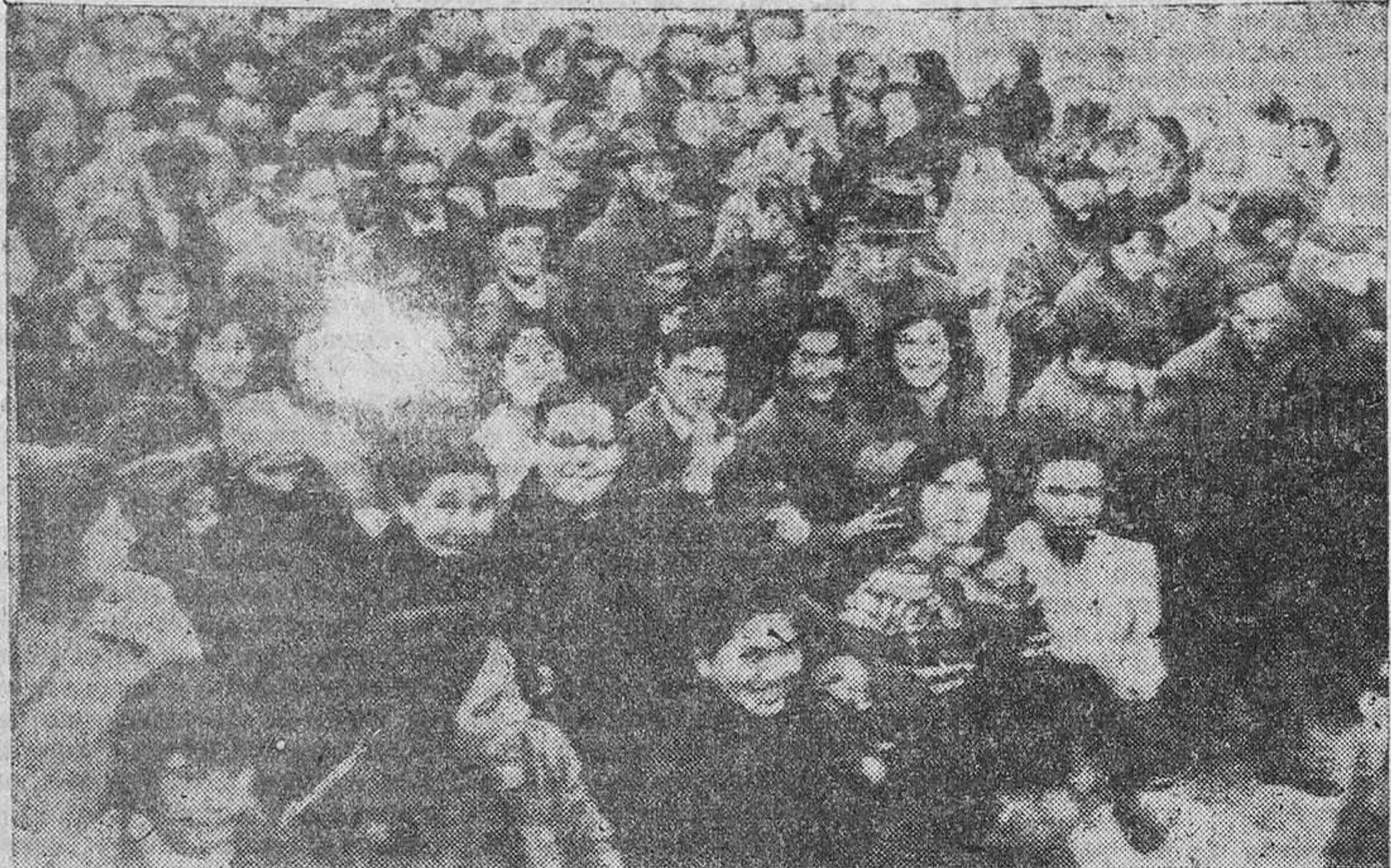
El Jefe Provincial del Movimiento es recibido con entusiasmo por el vecindario.

El Jefe Provincial fué objeto de un cálido recibimiento