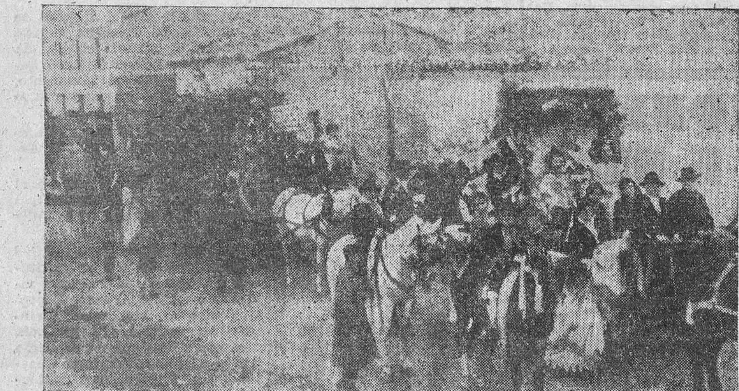
DESFILE DE CARROZAS.