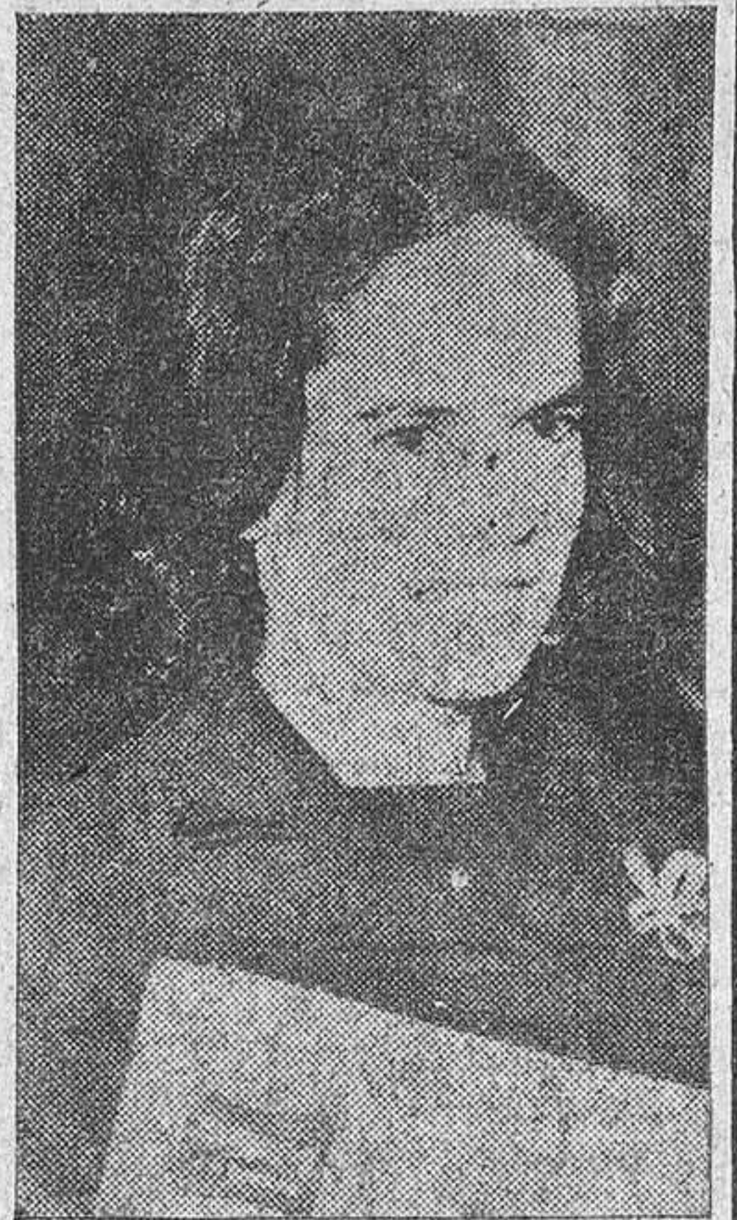
Oona O'Neill, la esposa de Charles Chaplin, que fué la causante de que Gloria Vanderbilt se casara con Leopoldo Stokowski.

derbilt, la mujer que ha luchado toda su vida por conseguir un hogar tranquilo, en el que poder dedicarse por entero al cuidado de sus hijos, expresaba hace poco la