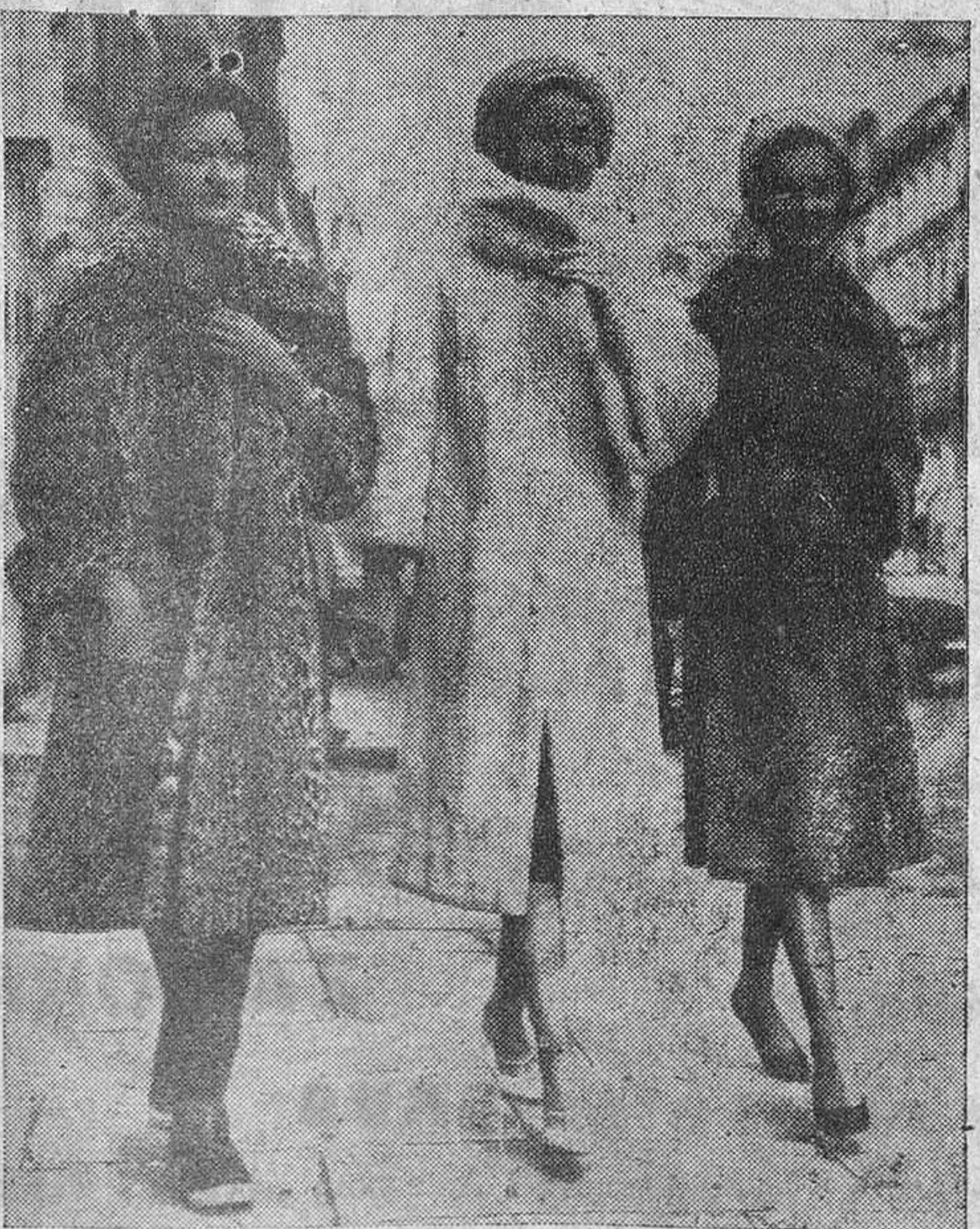
Estos tres modelos han sido presentados en la Exposición de Otoño-Invierno de París. De izquierda a derecha, «Orly», abrigo en aceto; «Florales», de castor blanco; y «Cometa», de astralán gris natural.