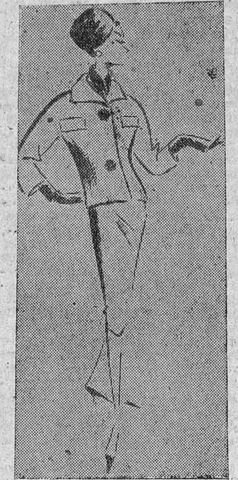
Sastre de tarde en lana gris-negro, original de Asunción Bastida.

Conjuntos de mañana en cuadros marrón y blanco. Procedo de la popular casa de modas de Asunción Bastida.