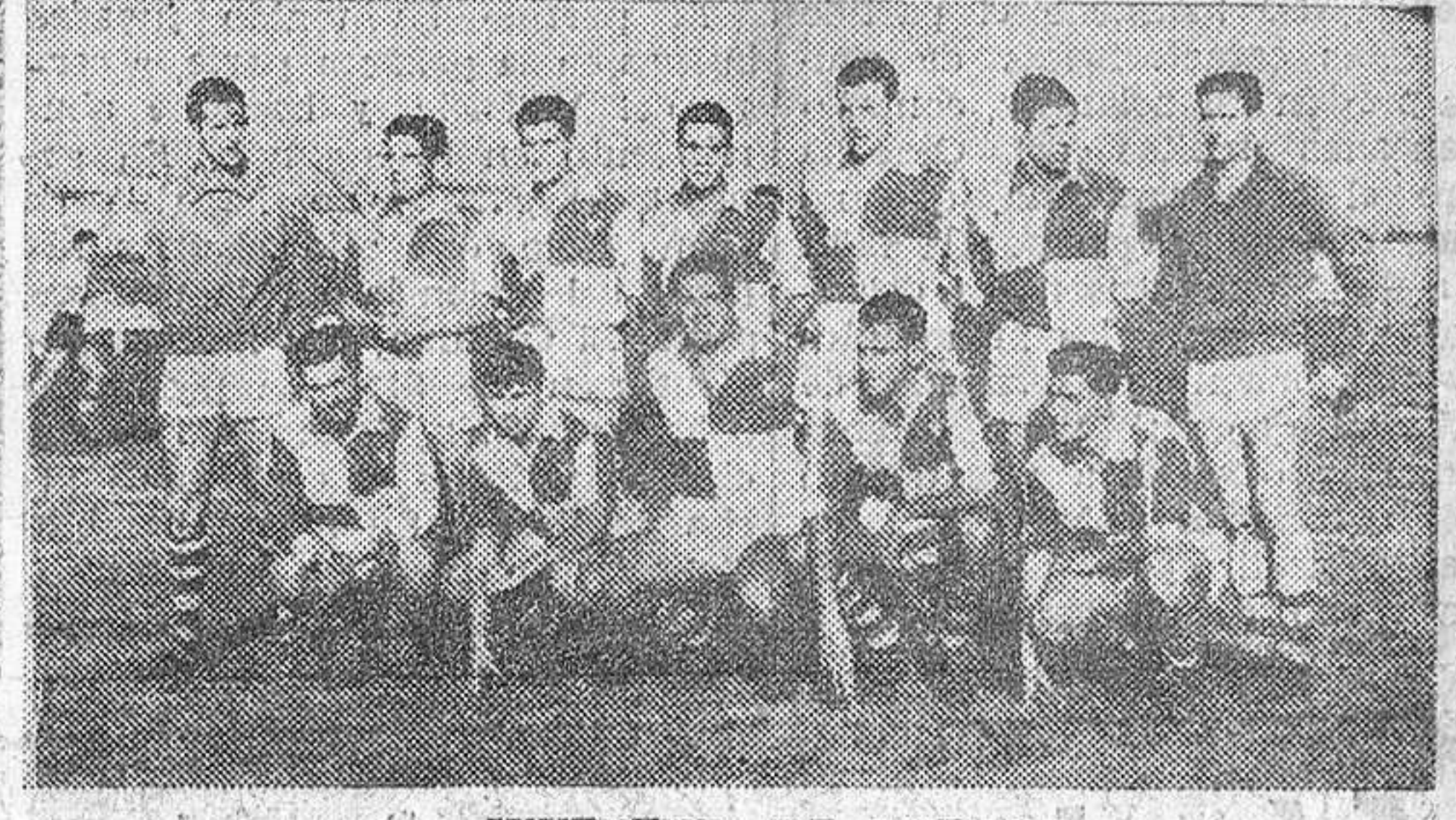
JUVENTUD, DE BURGOS