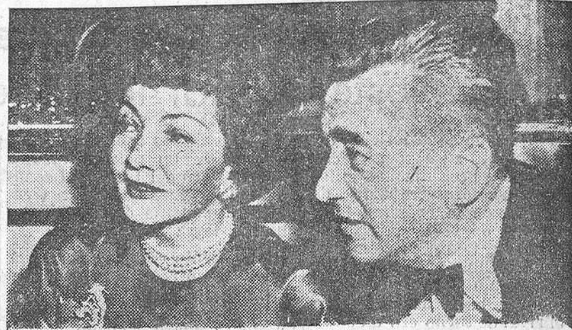
Claudette Colbert con el recientemente fallecido director cinematográfico, Charles Vidor.

Su secreto para conservarse joven es no pensar en sus cincuenta años