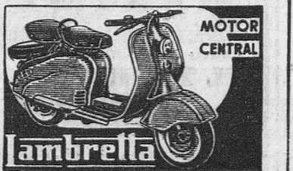
Lambretta MOTOR CENTRAL