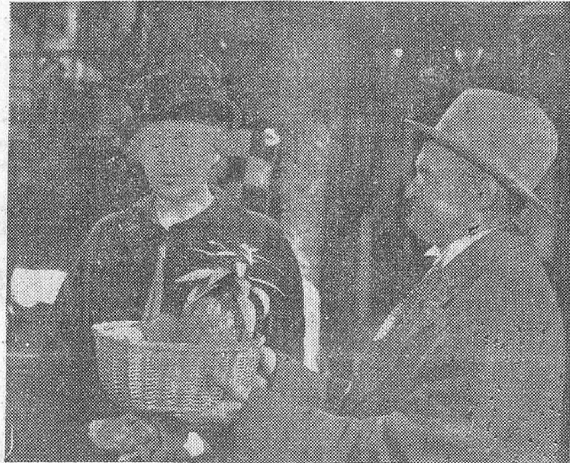
Ethel Barrymore en compañía de Barry Fitzgerald, genial intérprete de «Siguiendo mi camino», en una escena de la película «Sólo el corazón solitario».