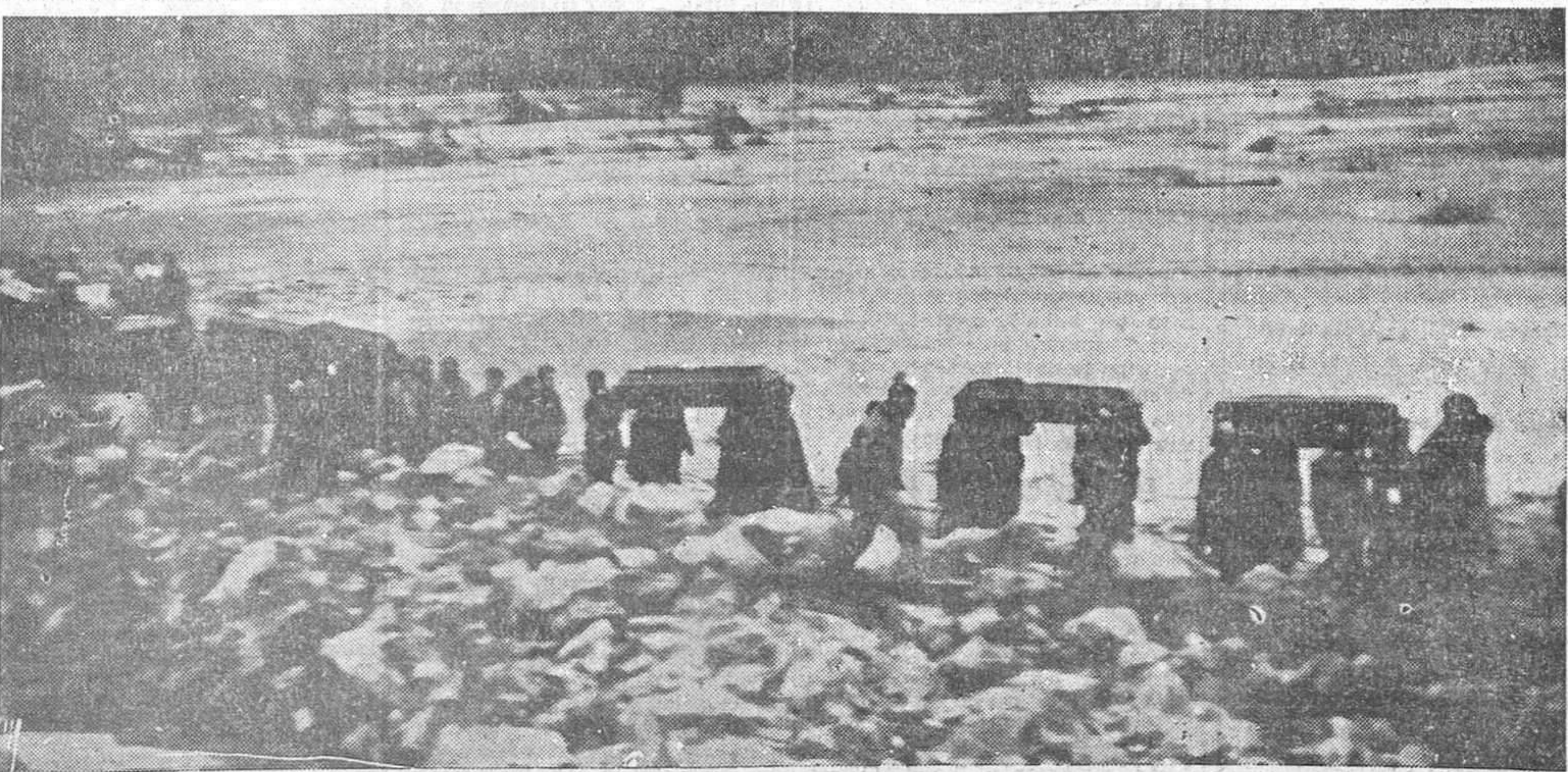
Comovida instantánea del traslado de los restos mortales de las diecisiete víctimas de la catástrofe al Cementerio de Ribadellago. El sepelio, efectuado el sábado por la tarde, fué presidido por el señor Ministro de Obras Públicas.

A su vez, el Jefe del Estado ha contestado al Rey de Marruecos en los siguientes términos: «Le agradezco profundamente a Vuestra Majestad las frases de condolencia que me envía con motivo catástrofe ocurrida en Ribadellago, así como los sentimientos de simpatía que expresa hacia el pueblo español en este doloroso momento.—FRANCISCO FRANCO, Jefe del Estado español.»