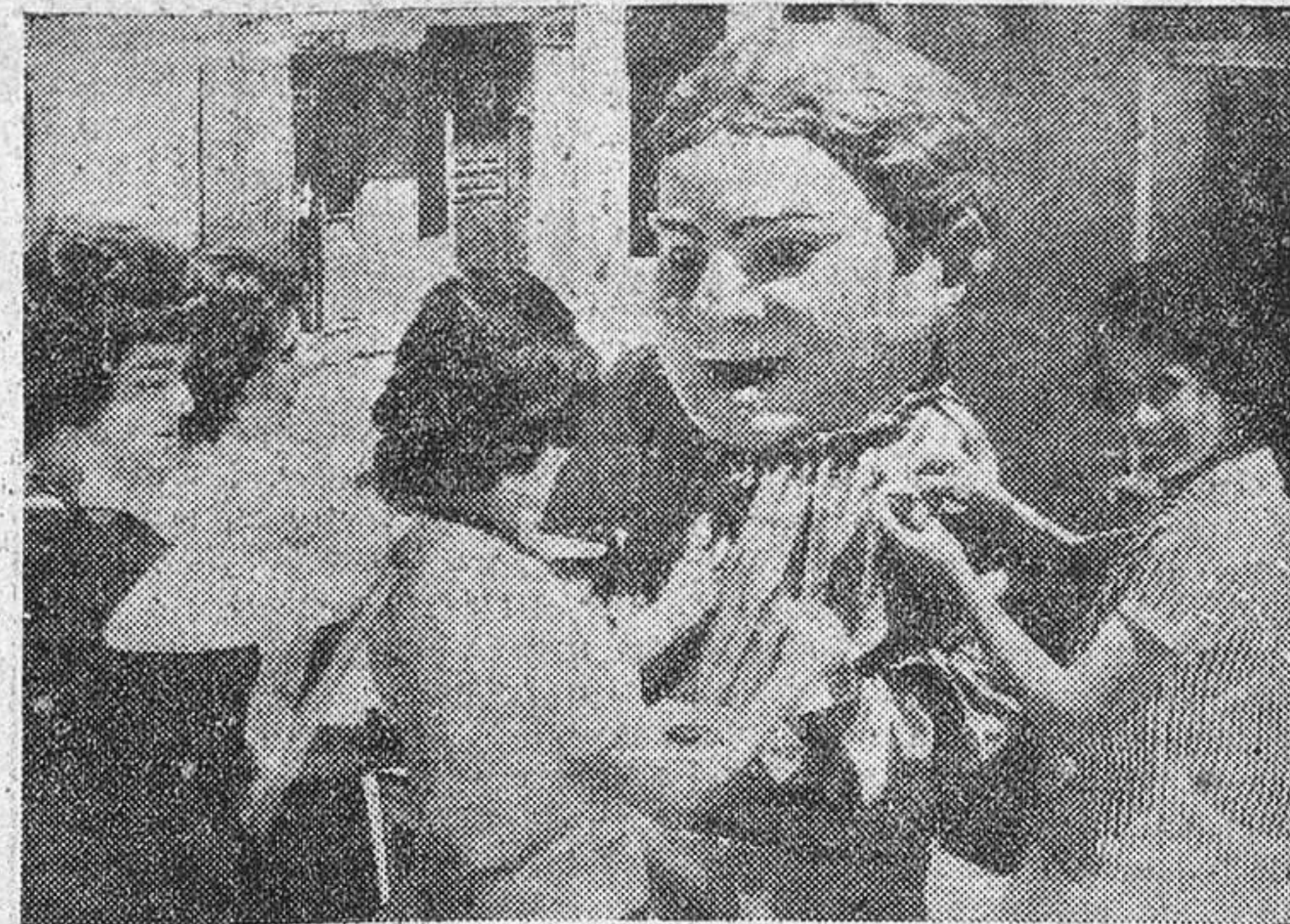
Un grupo de señoritas postulantes clavan banderitas a una gigantilla.

A medida que la mañana avanzaba crecía el ambiente y la animación en las calles. Resultaba una verdadera delicia ir por cualquier parte de Zamora. Había en la capital unas quinientas de estas bellas jóvenes, que voluntariamente se habían prestado a postular por las calles y plazas.