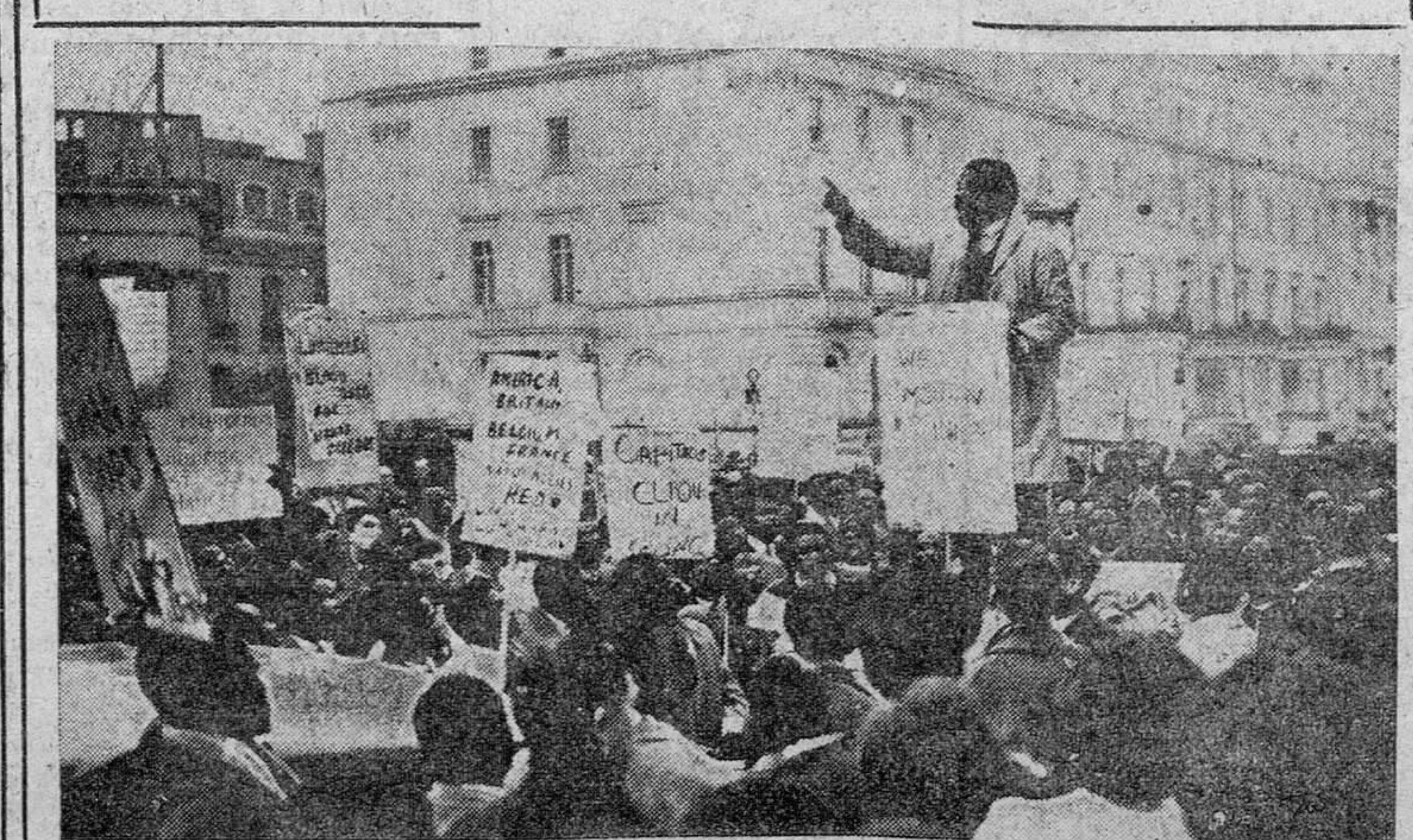
Una muchedumbre compuesta en su mayoría por estudiantes de color, durante una manifestación de protesta contra la muerte de Lumumba.