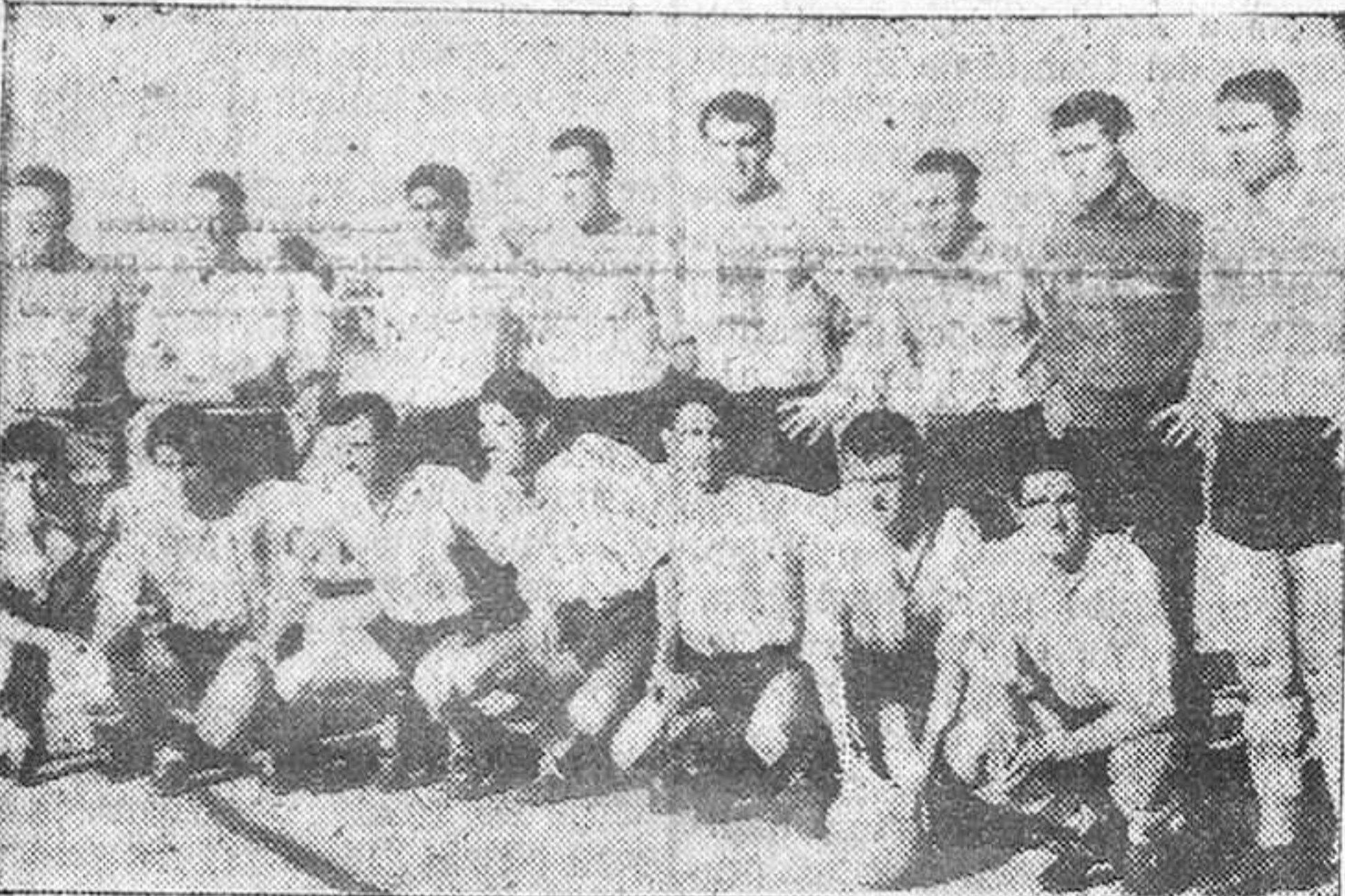
He aquí los quince jugadores rojiblancos, que actuaron el viernes en Braganza.