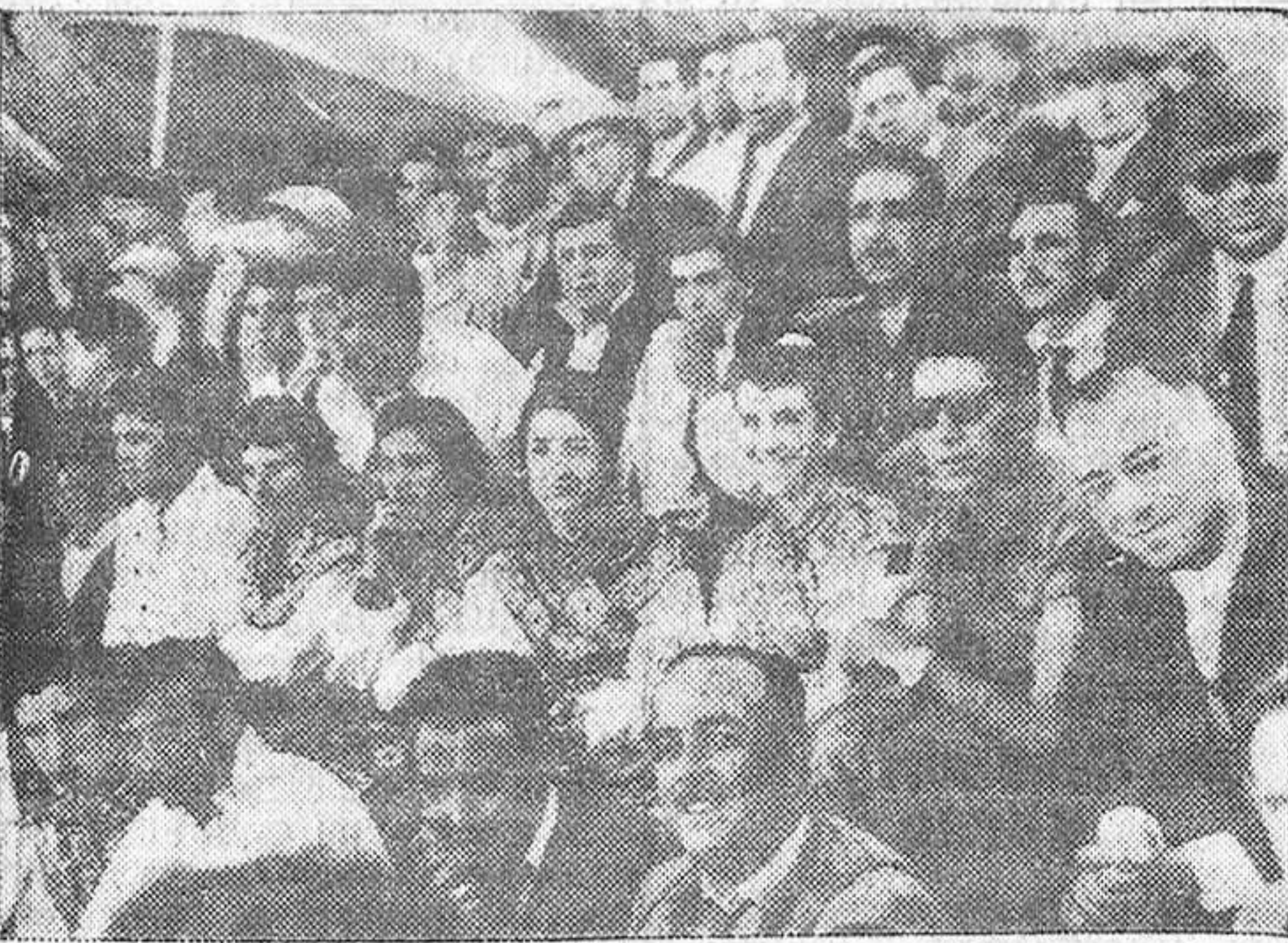
Aficionados zamoranos y las muchachas de los Coros y Danzas de la Sección Femenina de Villalpando, presenciando el partido.

El pasado viernes, el Atlético Zamora se desplazó a Braganza para enfrentarse al titular en un partido amistoso celebrado con motivo de las fiestas patronales de la referida localidad portuguesa, y cuyo encuentro finalizó con el resultado de empate a tres tantos. Para este partido el Sporting de Braganza formó con los notabilísimos refuerzos de seis internacionales. Ello no mermó en muchas posibilidades del equipo zamorano, que realizó un gran encuentro, llegando, incluso, a tener dos goles a cero a su favor, y luego tres a uno. Un fallo por el centro de la zaga y un penalty, hizo que el Braganza empatara la contienda a tres goles. Durante los noventa minutos de juego puede decirse que el dominio y la iniciativa correspondieron al Atlético, realizando, además, grandes jugadas, de manera especial la línea delantera, vistosa y precisa en todo momento, no obstante el «handicap» enorme que representaba para los zamoranos la dureza del terreno y el juego violento de los rivales. Durante el descanso actuaron los Coros y Danzas de la Sección Femenina de Villalpando, que se encontraban en Braganza, cosechando