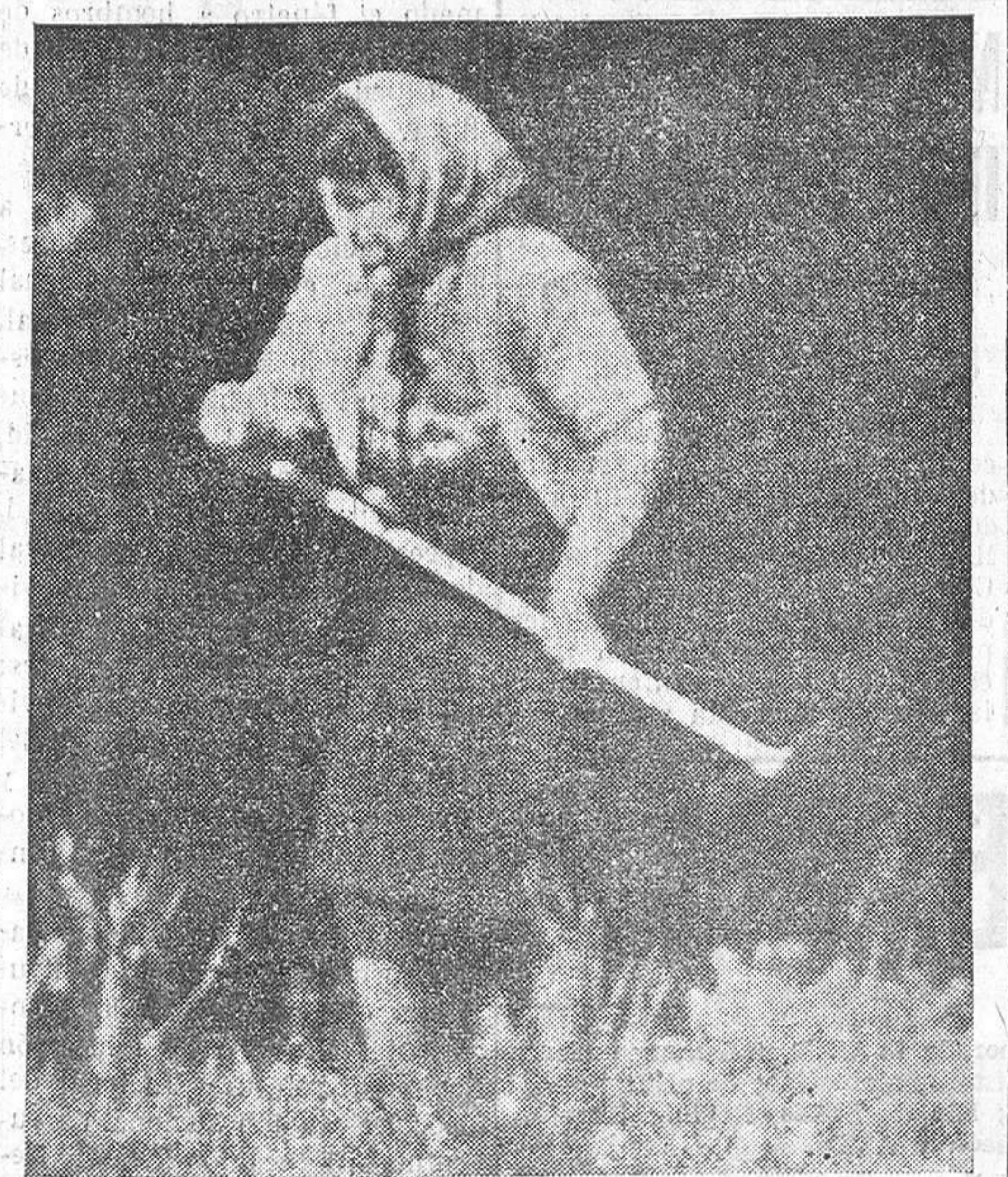
La señora del general De Gaulle es muy amante de la jardinería, y son muchas las horas que dedica a su residencia de Coëmbey-les-Deux-Eglises.

en la sierra resulta tan barato que uno le busca los tres pies al gato de la codicia de la Humanidad.