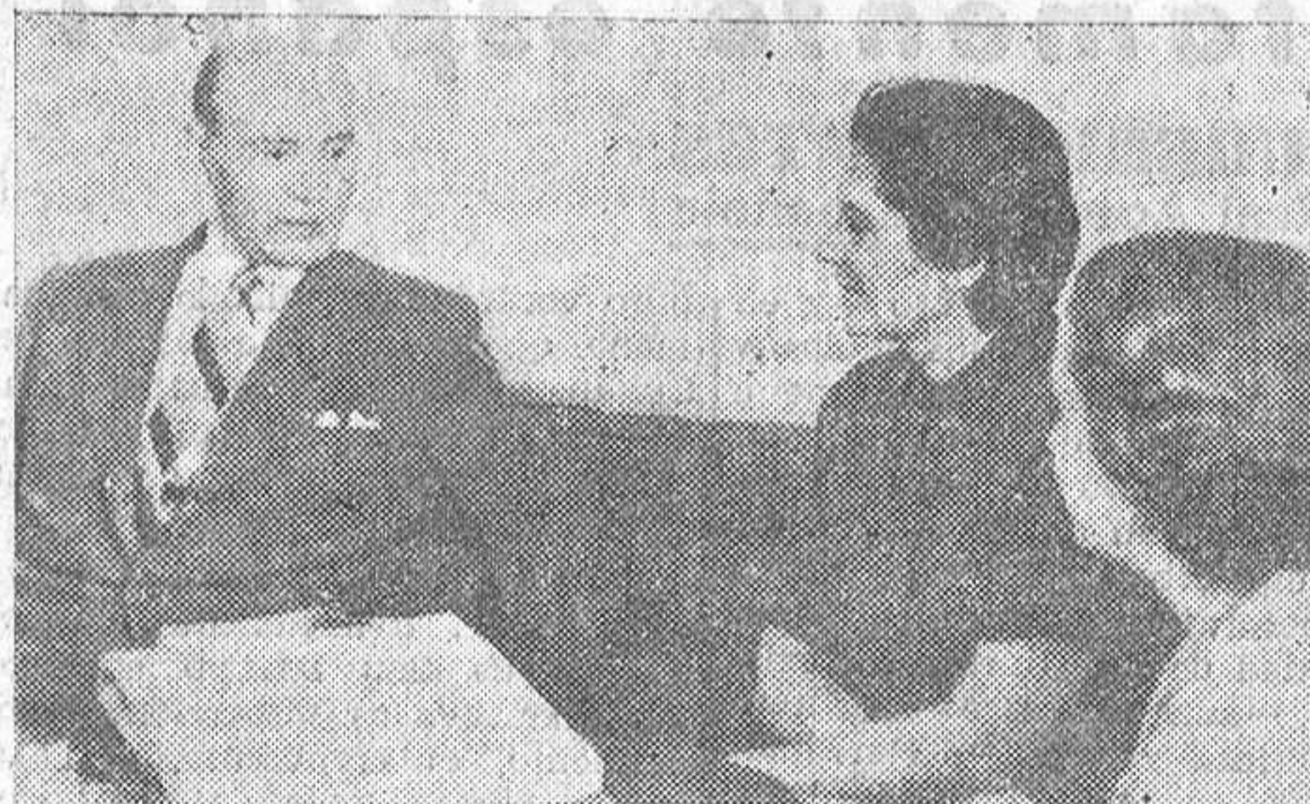
El Jefe Provincial del Movimiento, conversando con la Secretaria Nacional y con la Secretaria Provincial de la Sección Femenina.