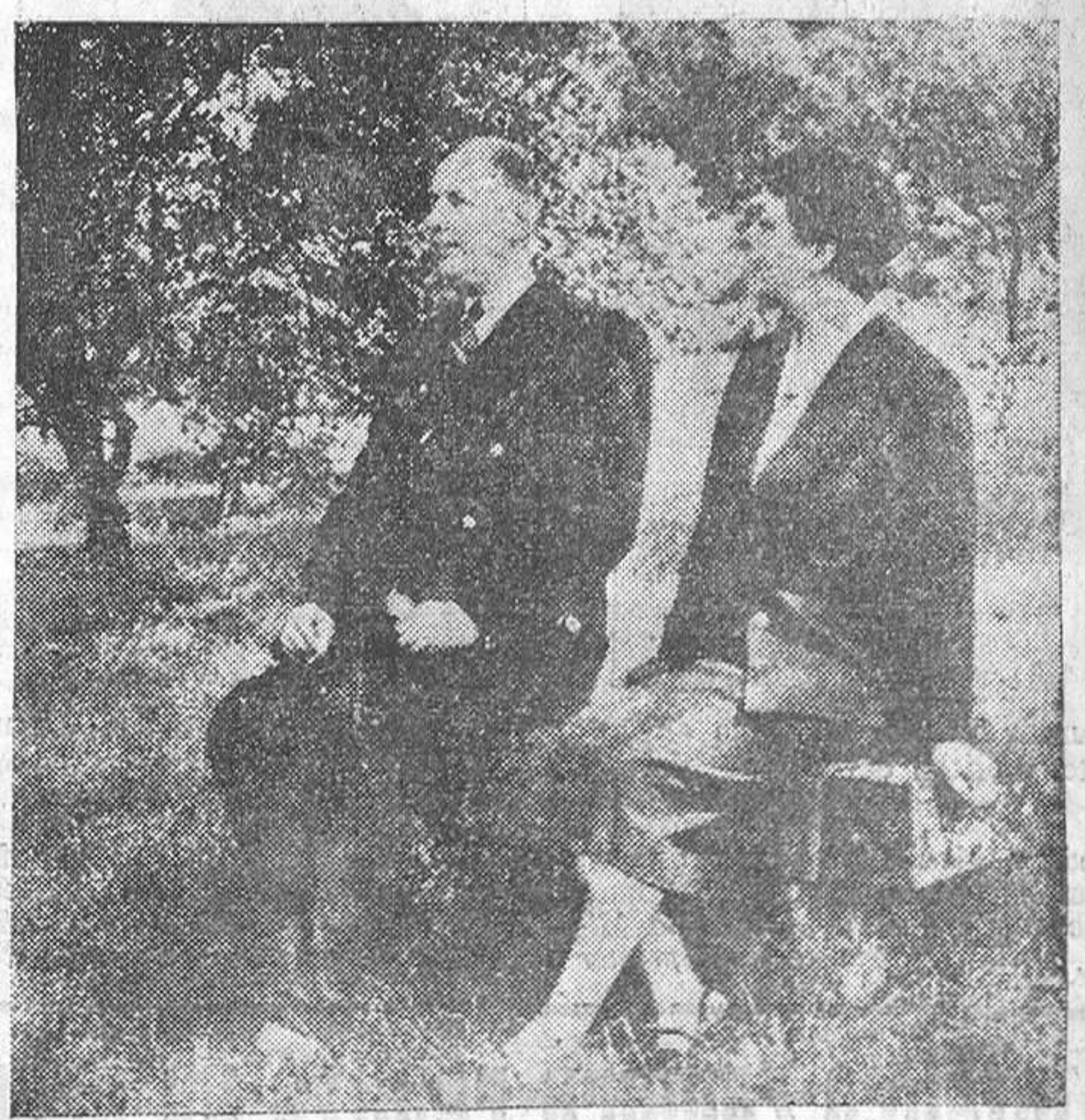
El matrimonio De Gaulle, amante del campo, vivió una solitaria existencia en Coëmbey, hasta que el General fue llamado para ocupar la Presidencia de la República.

El general De Gaulle es muy amante de la jardinería, y son muchas las horas que dedica a su residencia de Coëmbey-les-Deux-Eglises.