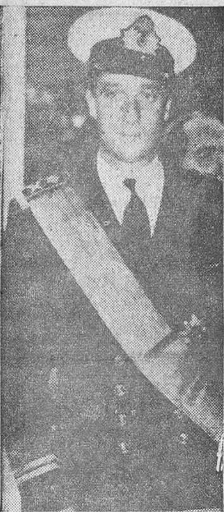
(En tercera página, crónica de nuestro corresponsal)

Importantes declaraciones del Ministro Secretario por la Televisión Española "La igualdad de los hombres ante el salario es una invitación a la vagancia y atenta contra su propia dignidad" "La Organización Sindical es casi toda la sociedad española" "Nuestra incorporación a la O. E. C. E. alegra enormemente a otros países y hemos escuchado de todos ellos instancias muy sinceras para que no demoremos esta incorporación"