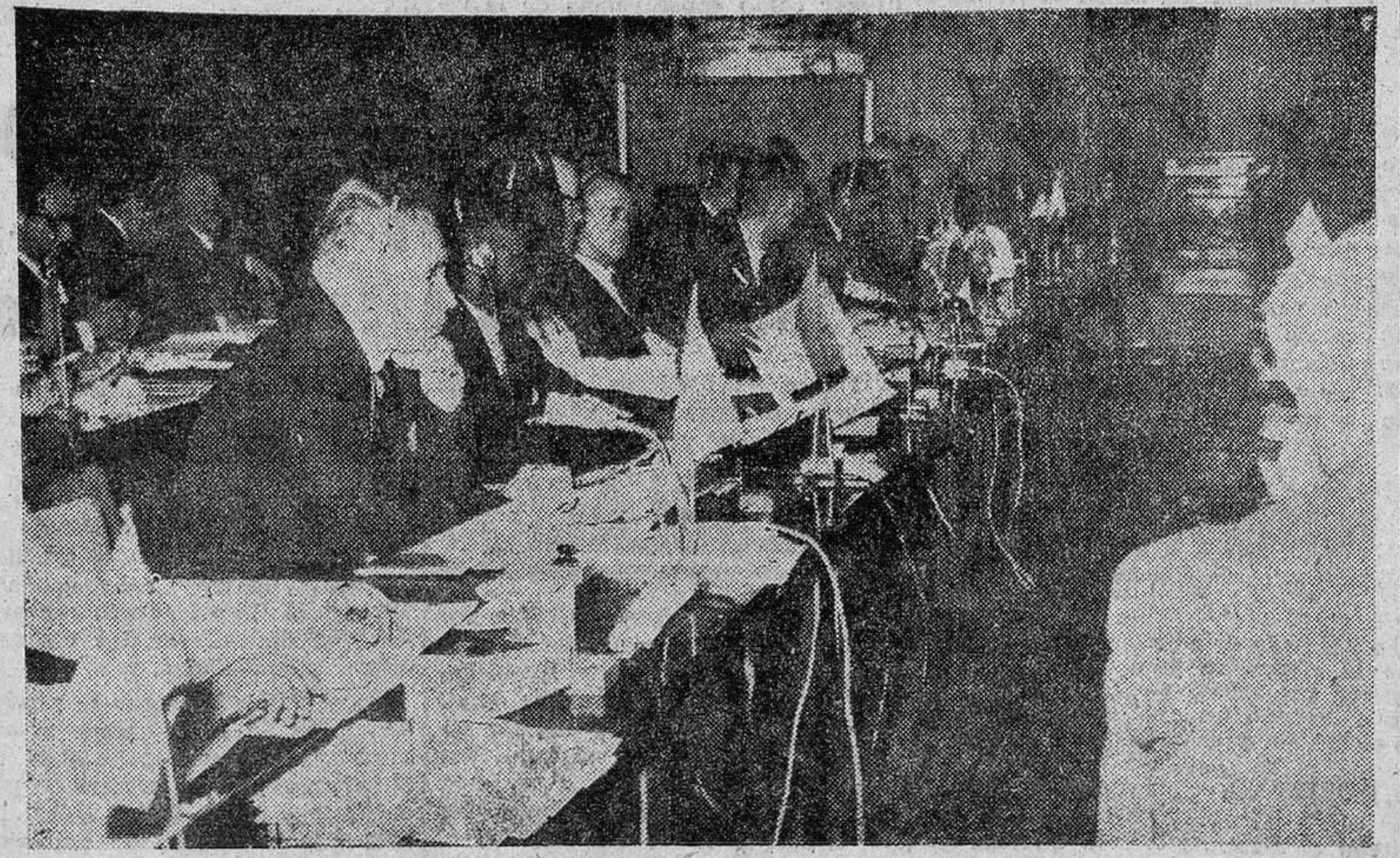
MADRID.—Un aspecto de las reuniones de la XXXI Asamblea General de la INTERPOL que se ha celebrado en el Casón del Buen Retiro, con asistencia de delegados de más de 80 países.