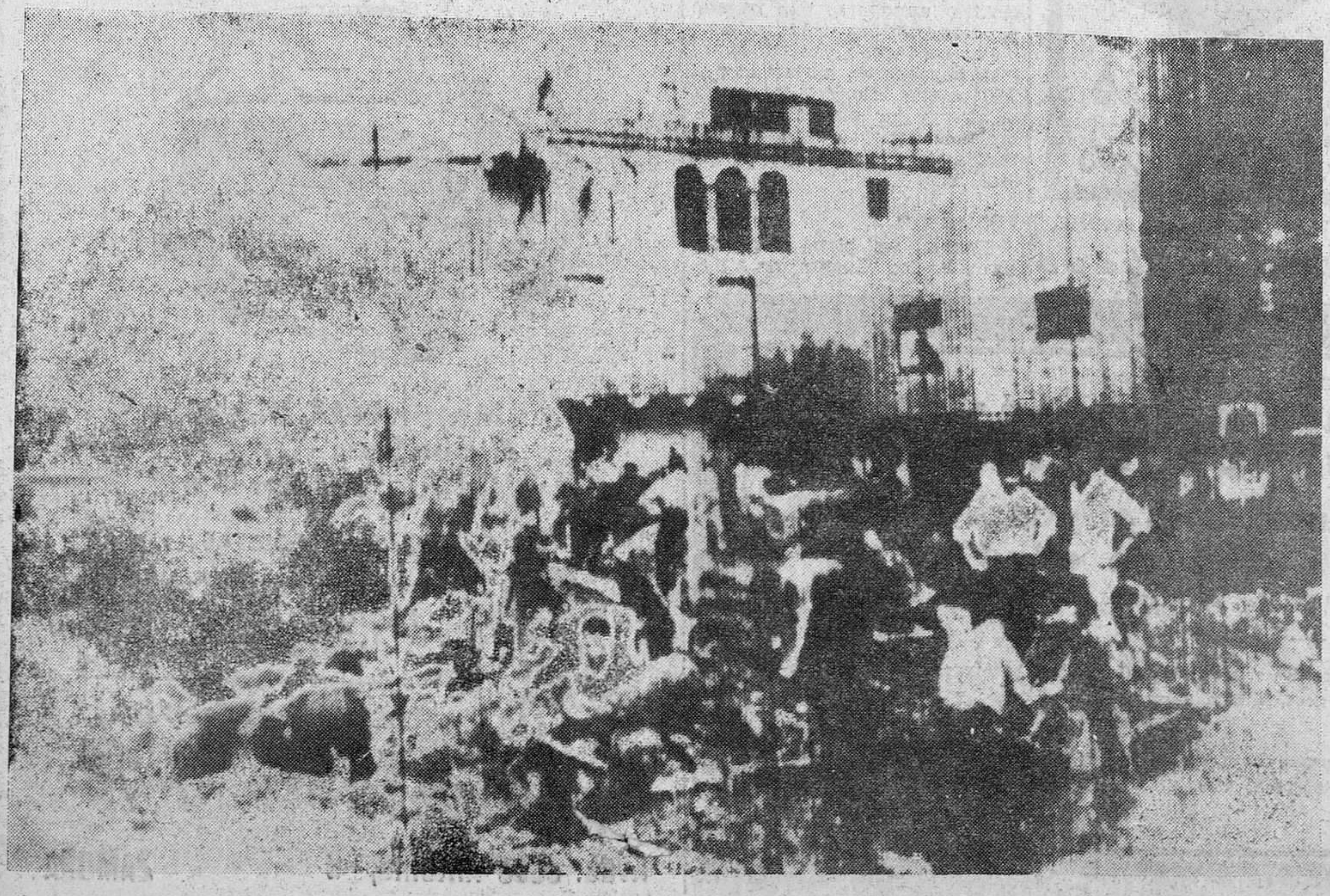
San Adrián de Besós.—Desolador aspecto de los destrozos y ruinas causados por las inundaciones en esta ciudad.

RAPIDA AYUDA Desde primeras horas, las autoridades, tanto