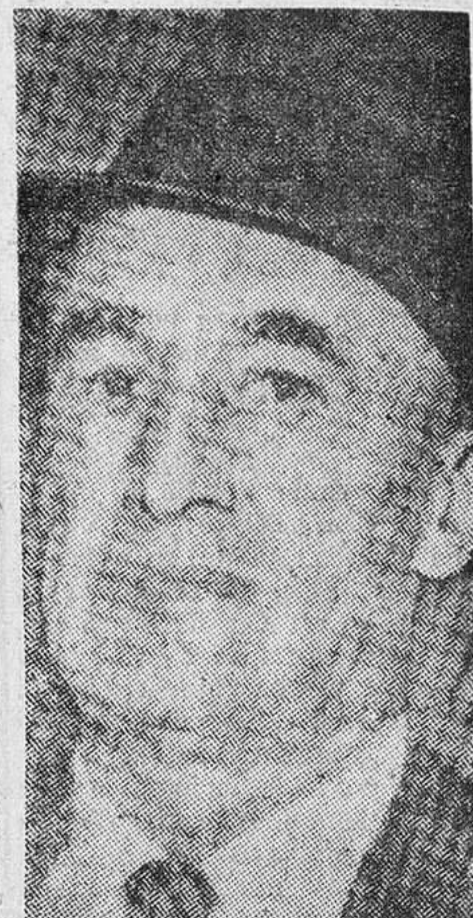
Jack Soblen, espía de nuevo cuño.

¿Es usted un hombre metódico y trabajador? ¿Le molestan las personas extravagantes? ¿Es usted ordenado y conciso?