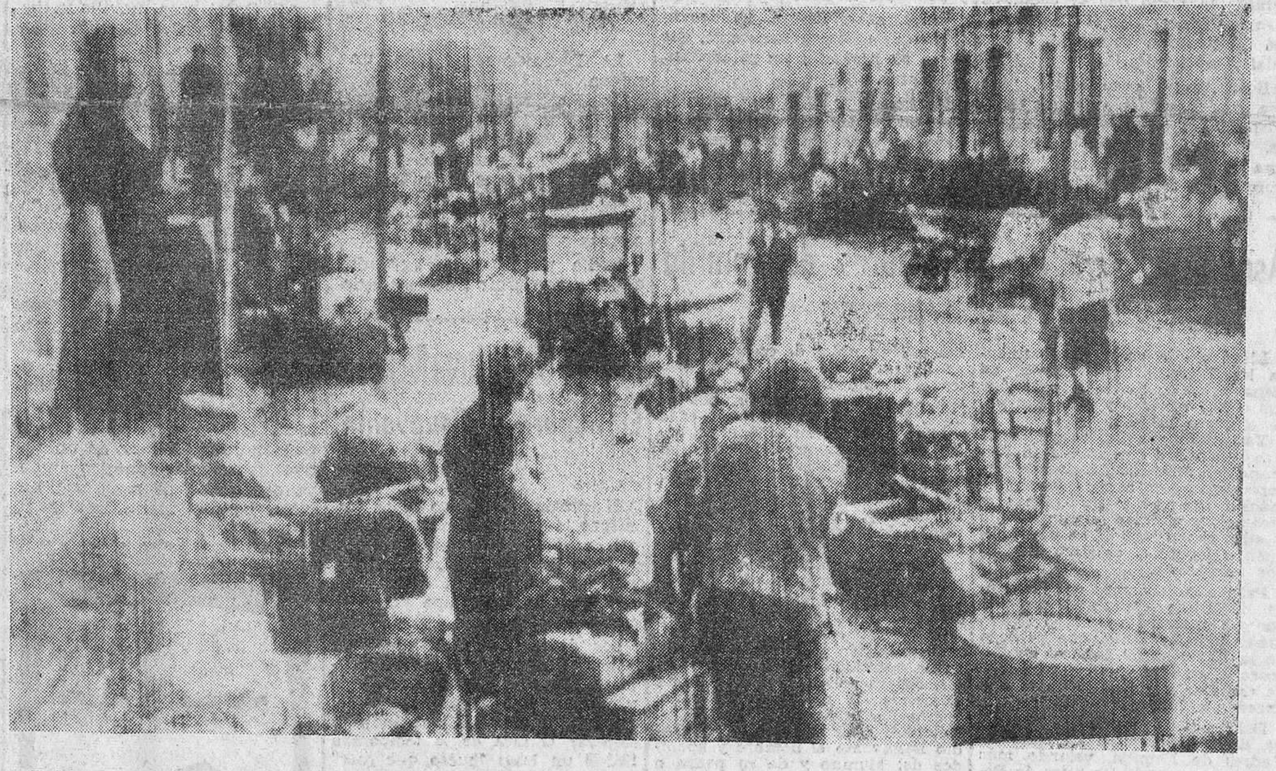
Rubí (Tarrasa).—He aquí una desoladora vista de los efectos causados por las inundaciones en esta localidad cercana a Tarrasa.

Año XXVII - N.º 8.184 - Zamora, jueves 27 Septbr. 1962 - Teléfonos: Dirección: 1576. Admón. 1570 - Precio: 1,50 Pts.