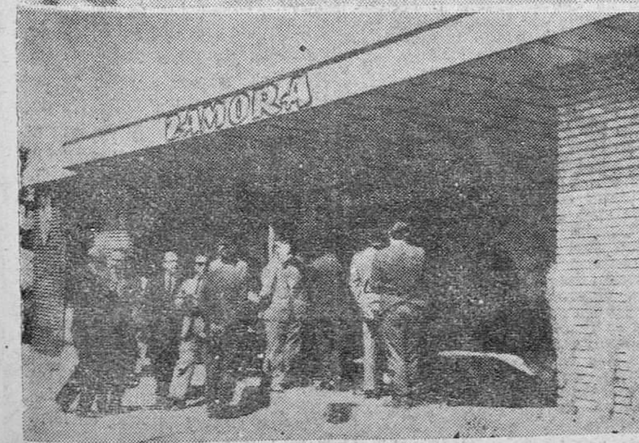
El Pabellón de Zamora en la Feria de Muestras de Salamanca es, sin duda, uno de los más visitados. En su montaje estuvieron especialmente interesadas nuestras primeras autoridades, Gobernador Civil, Presidente de la Diputación, Alcalde, Subjefe Provincial del Movimiento, los cuales aparecen en la primera fotografía con miembros de la Casa de Zamora en Salamanca. La segunda foto corresponde a la visita que el embajador de los Estados Unidos y su esposa efectuaron al pabellón zamorano.