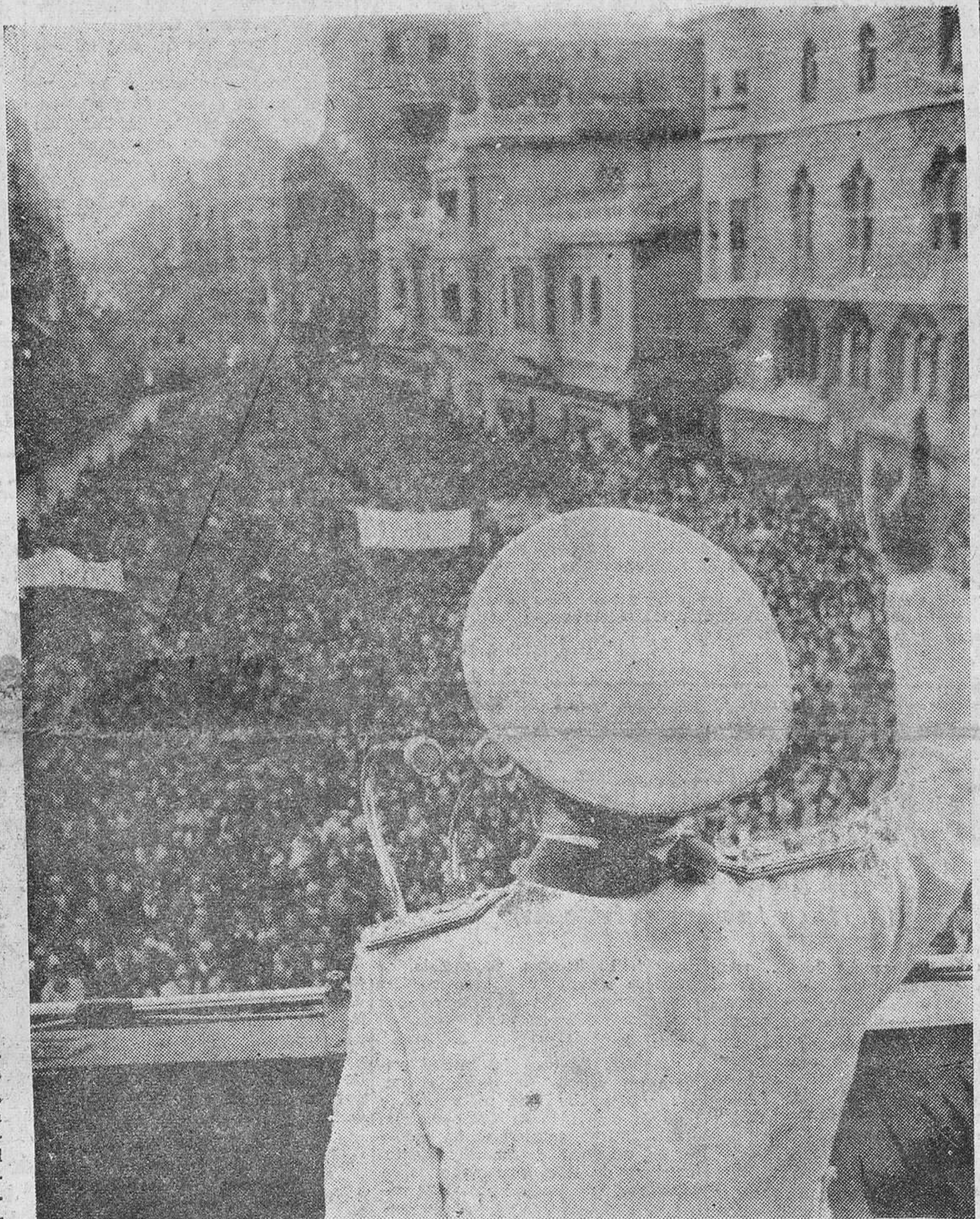
LEÓN.—Después de oír el solemne Te Deum celebrado en la Catedral, el Caudillo se dirigió al Palacio de los Guzmanes, sede de la Diputación, en donde el Alcalde y el Gobernador le impusieron las Medallas de Oro de la Ciudad y la especial de la Provincia. Seguidamente, S. E. salió al balcón para corresponder a los vitores de la ingente multitud estacionada en los alrededores del edificio.