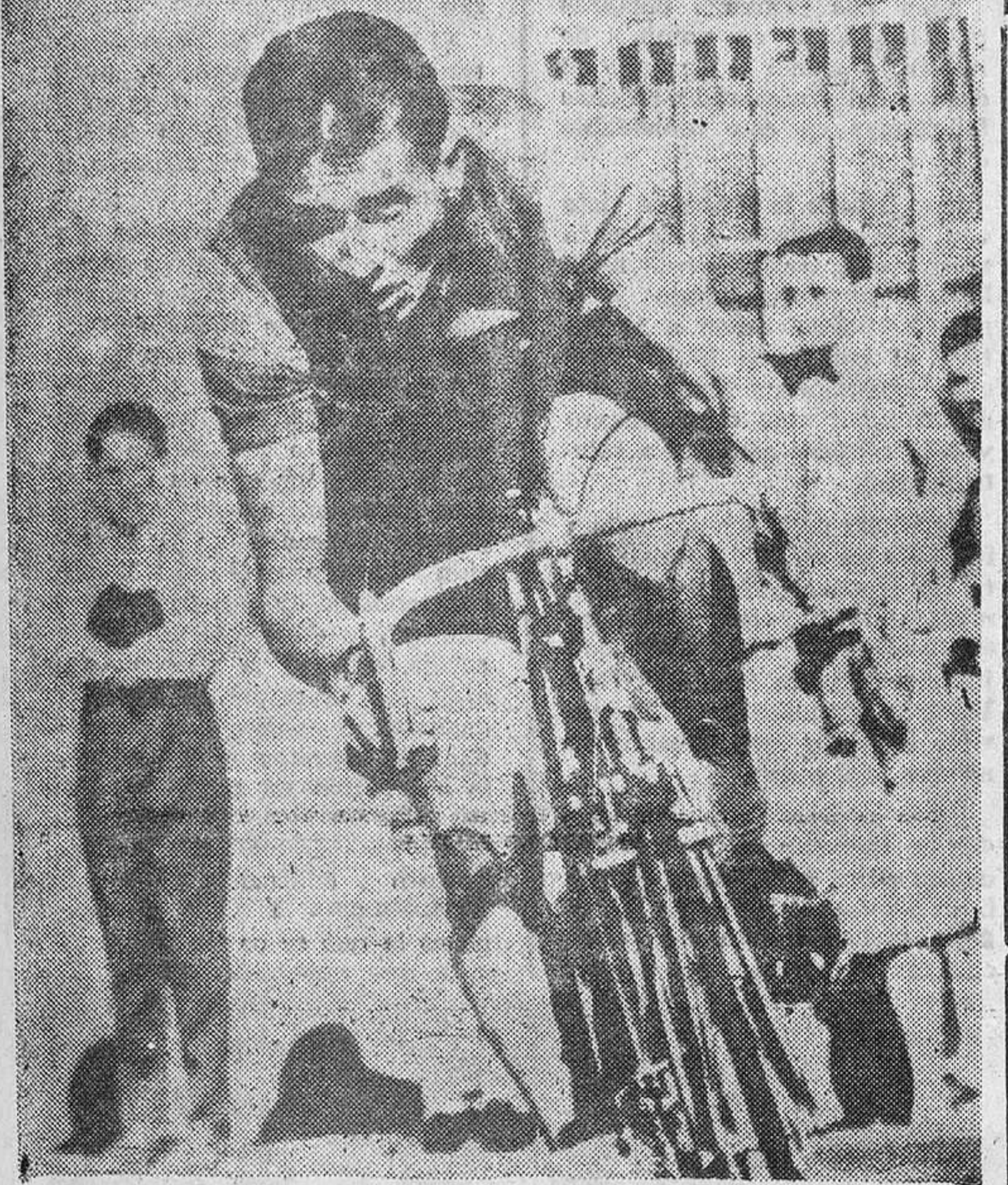
ANQUETIL, EL IDOLO.--El rubio Jacques Anquetil, indiscutible idolo de los aficionados franceses, ha igualado el récord de Bobet y Thyse...

4.--Vyncke (Bélgica) 54-50-37. 5.--Ferretti (Italia) 54-55-29. 6.--Partesotti (Italia) 54-57-05. 7.--Crinion (Inglaterra) 55-00-14. 8.--Hugens (Holanda) 55-01-00. 9.--Nidam (Holanda) 55-01-28. 10.--Vélez (España) 55-02-30. 11.--Hugens (Suiza) 55-03-15. 12.--Momeñe (España) 55-03-36. 13.--Jaisli (Suiza) 55-04-16. 14.--Bracke (Bélgica) 55-04-35. 15.--Knops (Holanda) 55-05-09. 16.--Silva (Portugal) 55-07-24. 17.--Monty (Bélgica) 55-07-46. 18.--Vastiau (Bélgica) 55-10-05. 19.--Poggiali (Italia) 55-10-11. 20.--Carton (Francia) 55-10-31. 21.--García (España) 55-24-30. 22.--Mayoral (España) 55-24-44. 23.--Colmenarelo (Esp.) 56-07-16. 24.--López Cano (Esp.) 56-27-17. 25.--Quesada (España) 56-31-19.