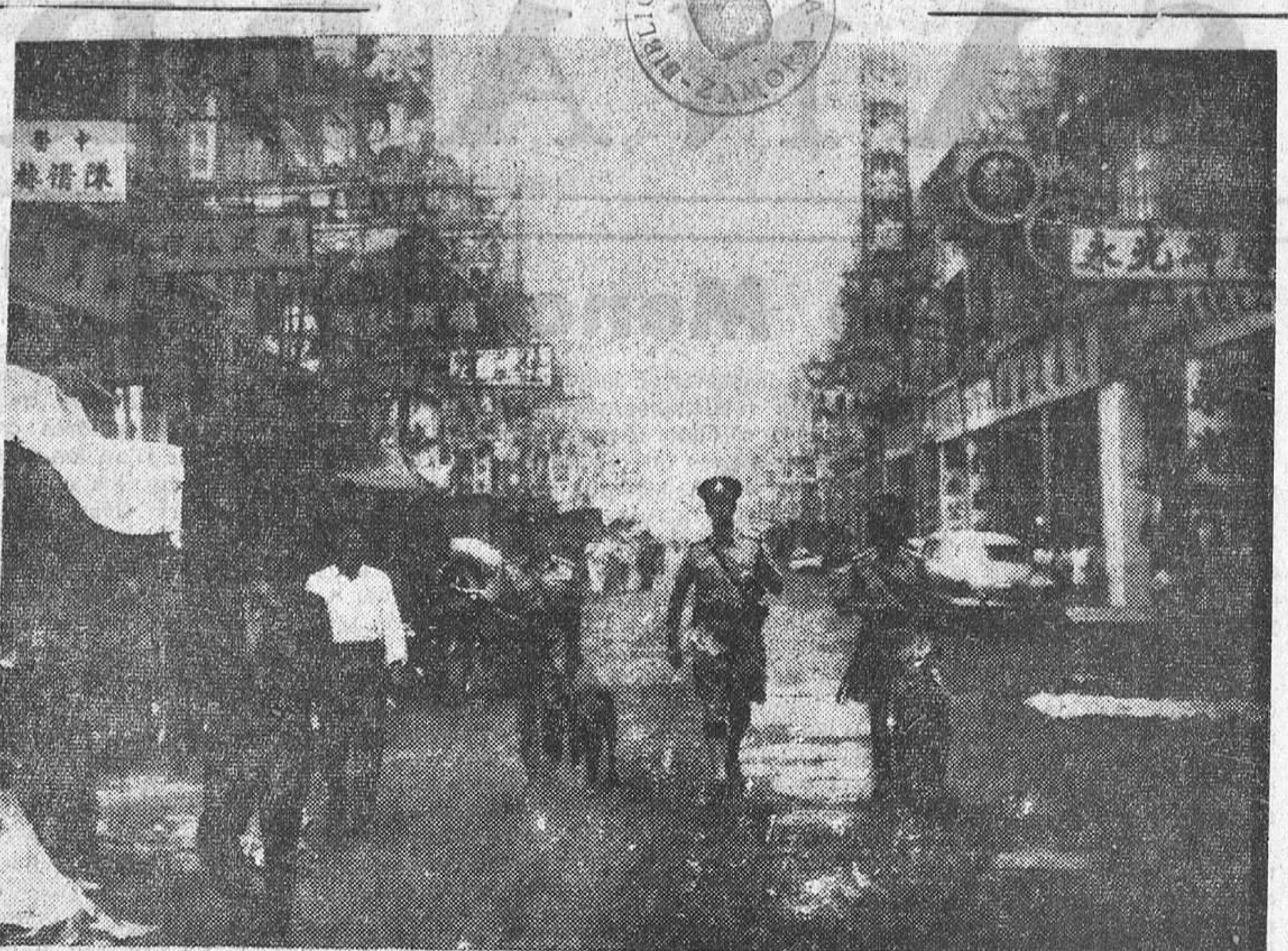
HONG-KONG. — Según un informe del Gobierno de Hong-Kong, publicado en 1959, la ciudad cuenta con más de doscientos mil adictos a los narcóticos (heroína, opio y morfina), y desde el año 1955 al 59 fueron detenidos más de cincuenta mil fumadores de estupefacientes. Pero el contrabando de esta peligrosa materia es cada vez mayor y las autoridades han decidido dar una batalla en toda regla. En la foto vemos una patrulla de Policía, con perros especialmente adiestrados, dirigiéndose a hacer una inspección en la demarcación que les fue asignada.