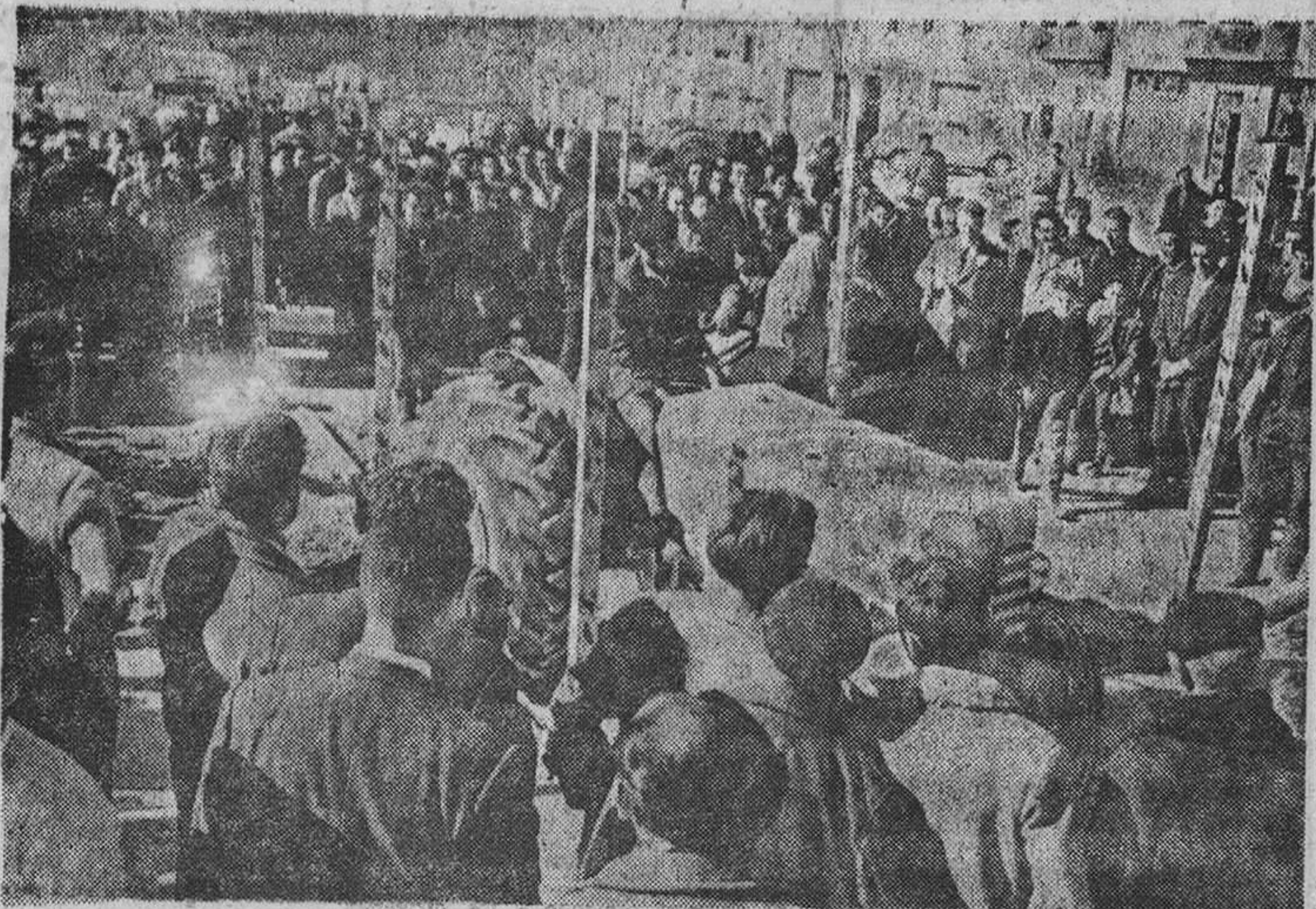
SORTEO DE LOS DIFICILES OBSTACULOS DE QUE CONSTITUYO LA PRUEBA

Que organizó con resonante éxito la prestigiosa firma sevillana SOCIEDAD DE CONSTRUCCIONES AGRICOLAS (S.A.C.A.)