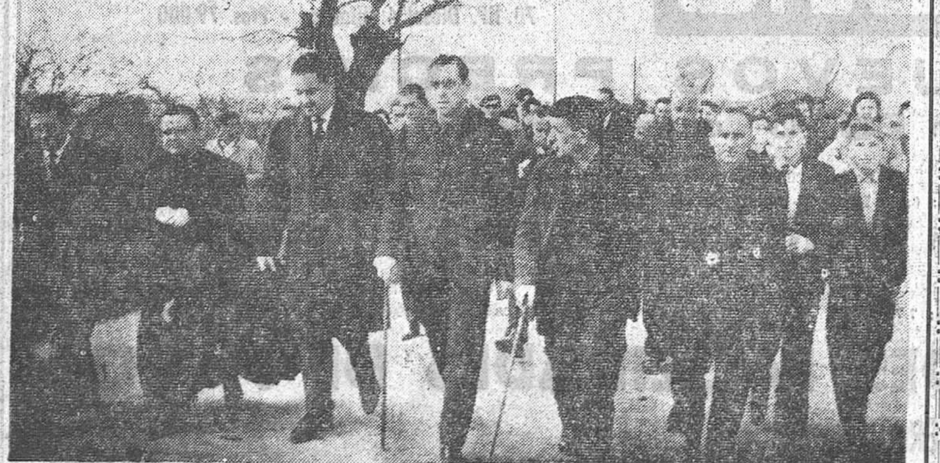
El Jefe Provincial del Movimiento, con las autoridades locales y el vecindario, se dirige hacia el centro telefónico de Fresno.