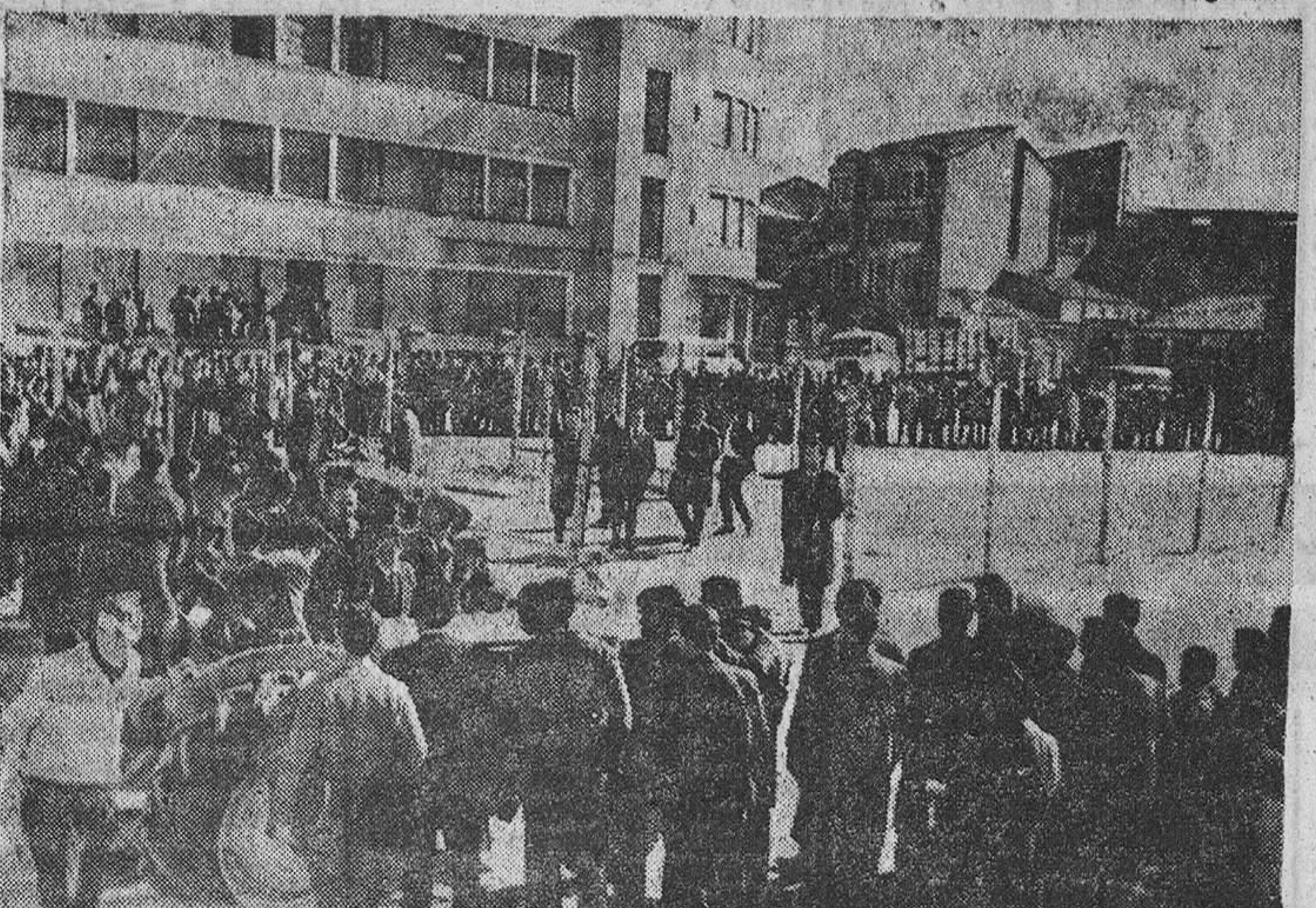
La multitud, numerosísima, se dio cita en la mañana del domingo en la explanada de la Plaza de Toros para presenciar este interesante concurso.

Además, la Sociedad Anónima de Construcciones Agrícolas, de Sevilla (S. A. C. A.), para beneficiar todavía más al usuario, ha puesto a disposición de los mismos un