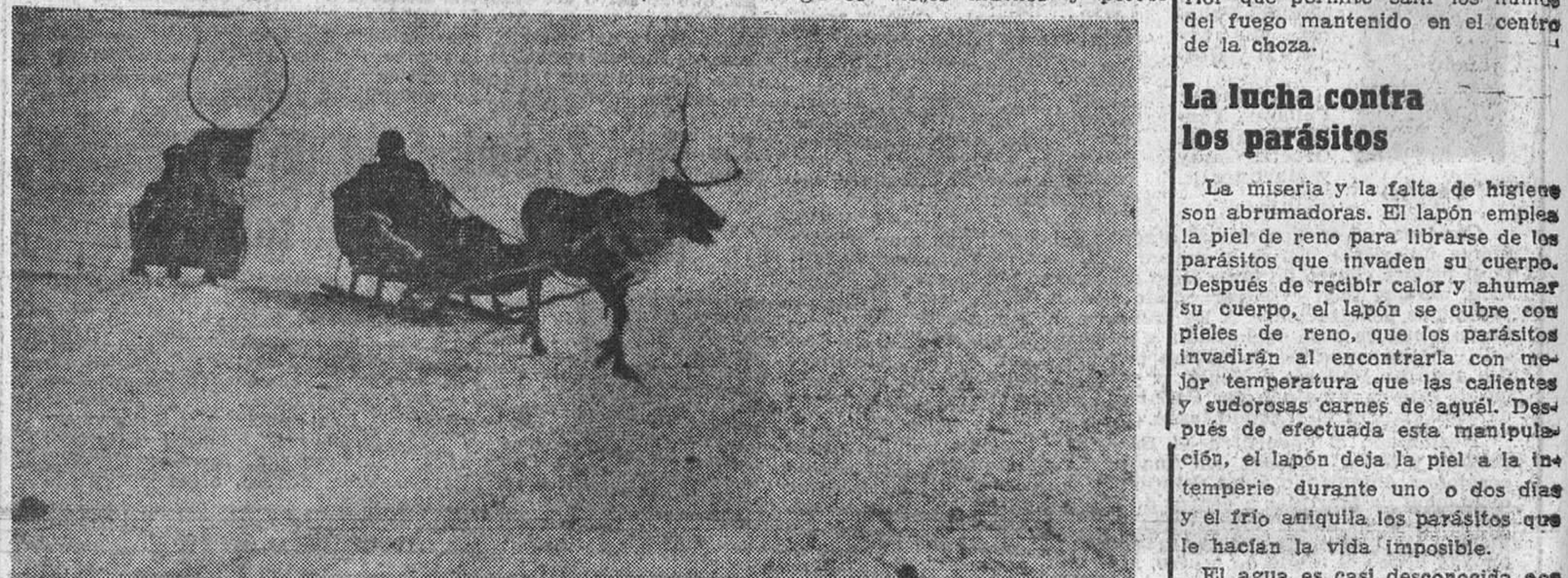
EL REKI.—El trineo unipersonal, arrastrado por un poderoso reno macho, es el único medio de comunicación utilizable en las desiertas estepas heladas del largo invierno ártico.