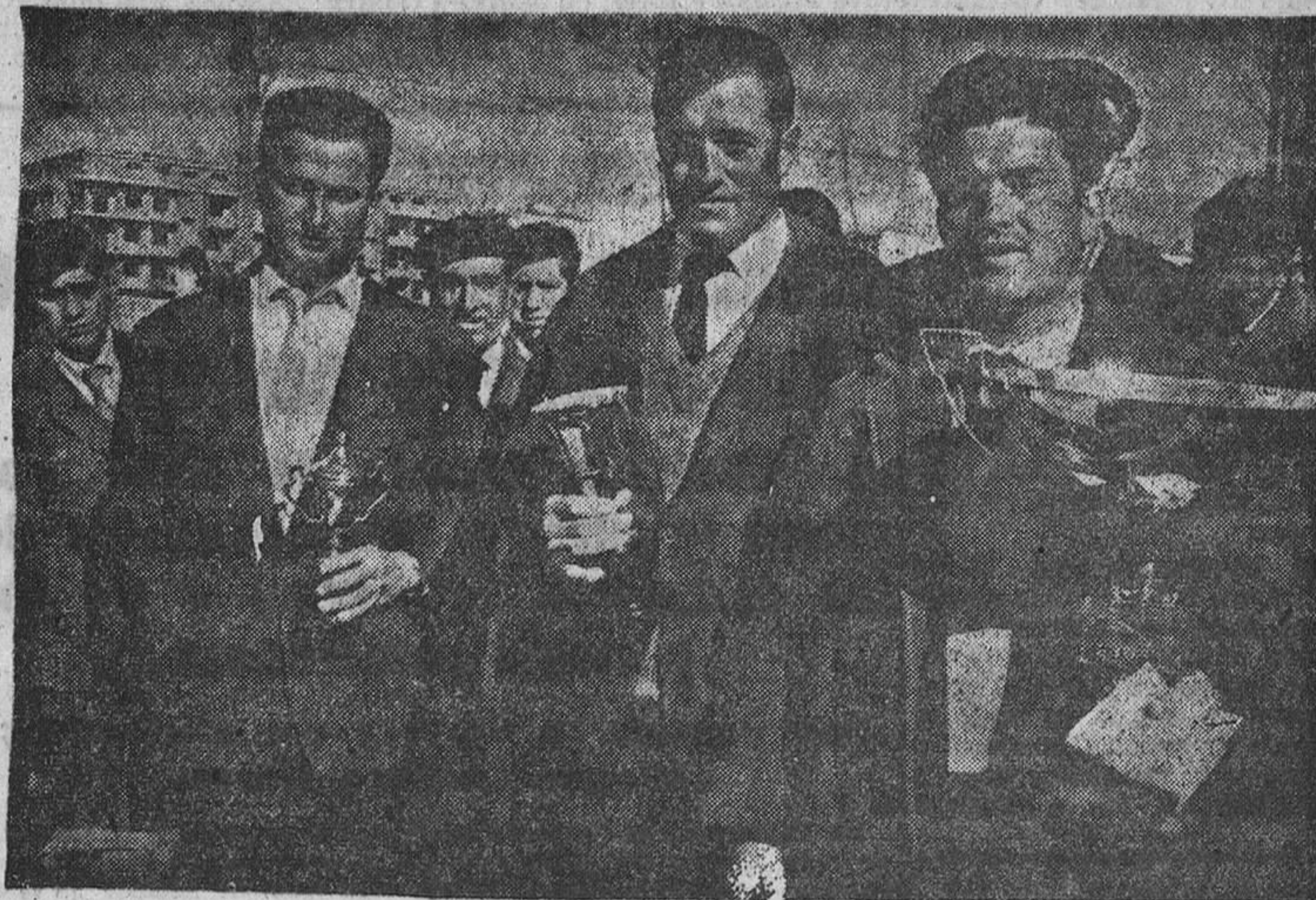
Los triunfadores de la prueba, ostentando orgullosos los trofeos y premios donados por S.A.C.A.

condiciones del vehículo que montaban. El numerosísimo público que acudió al Concurso se entusiasmó, con razón, porque hay que decir