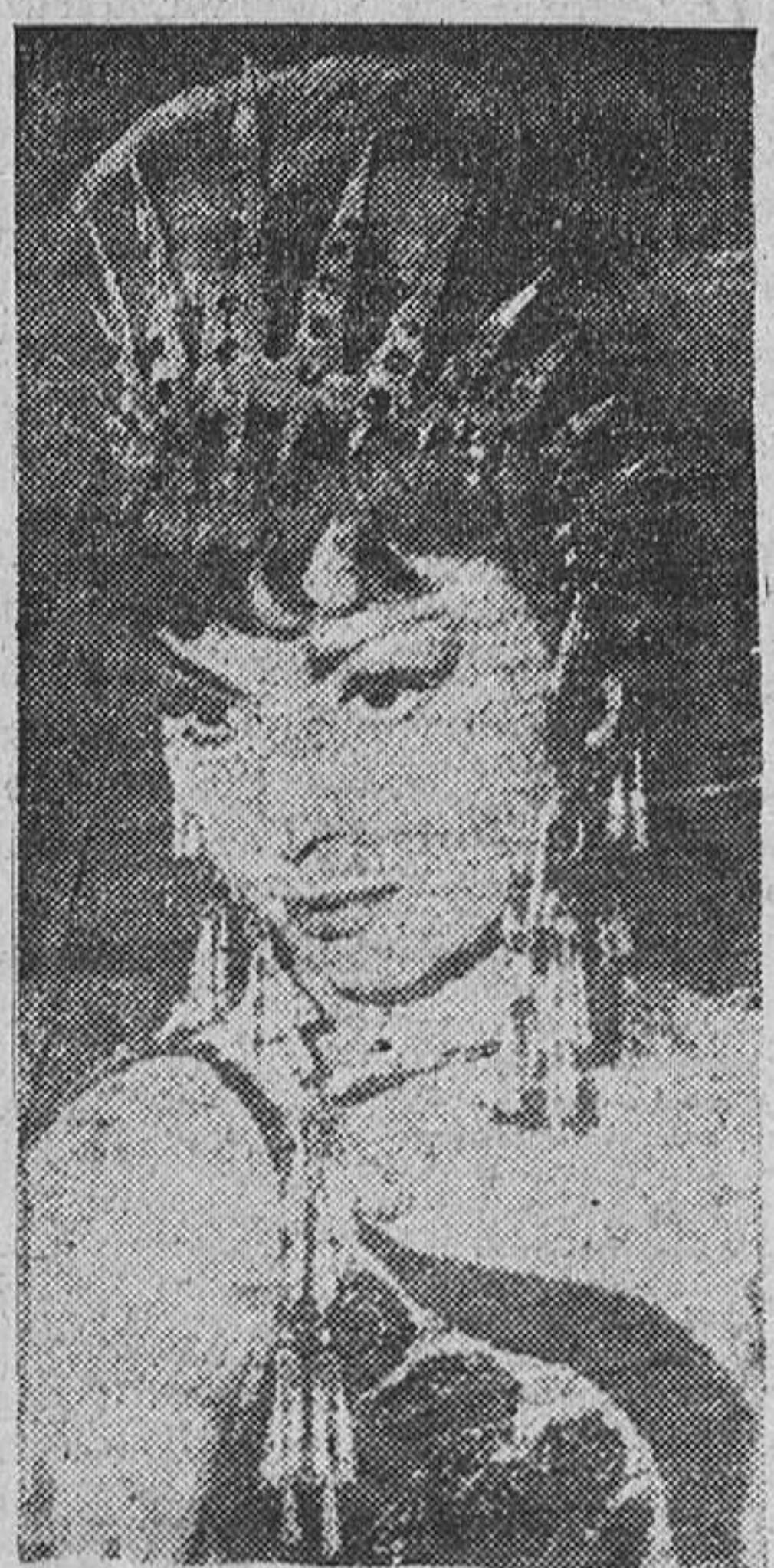
HAYA HARAREET, «Antinea»