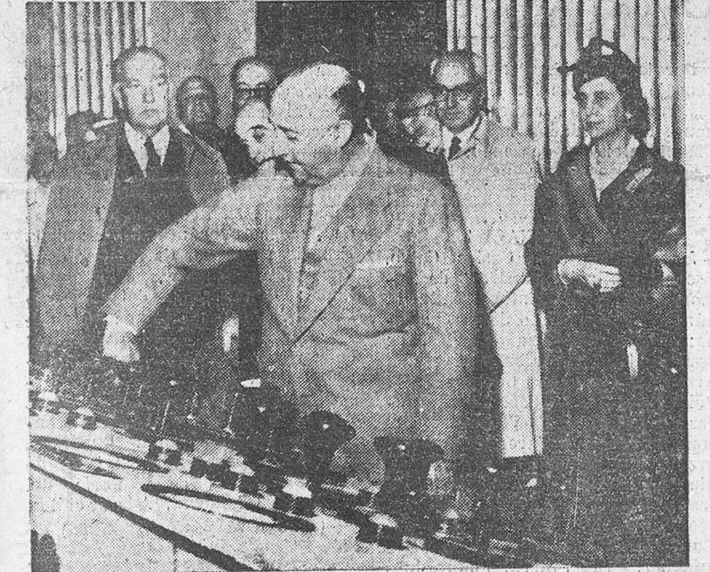
Su Excelencia el Jefe del Estado en el momento de poner en marcha el cuarto grupo de dicha central hidroeléctrica de San Esteban del Sil con motivo de su inauguración.

En el incomparable marco de las orillas del Lago de Sanabria, en ese privilegiado rincón en que el Creador parece que se detuvo a embellecer su obra, Franco permaneció breves momentos. Le vimos rodeado de altas jerarquías nacionales y de las autoridades provinciales y le observamos tan jovial, tan afortunadamente en integridad física, que agradeceremos que la Providencia nos lo conserve en plenitud de actividad. Allí, en aquel bellísimo paraje, enmarcado por altas montañas que se miran en las aguas del lago, Franco coronaba un viaje de tres días de