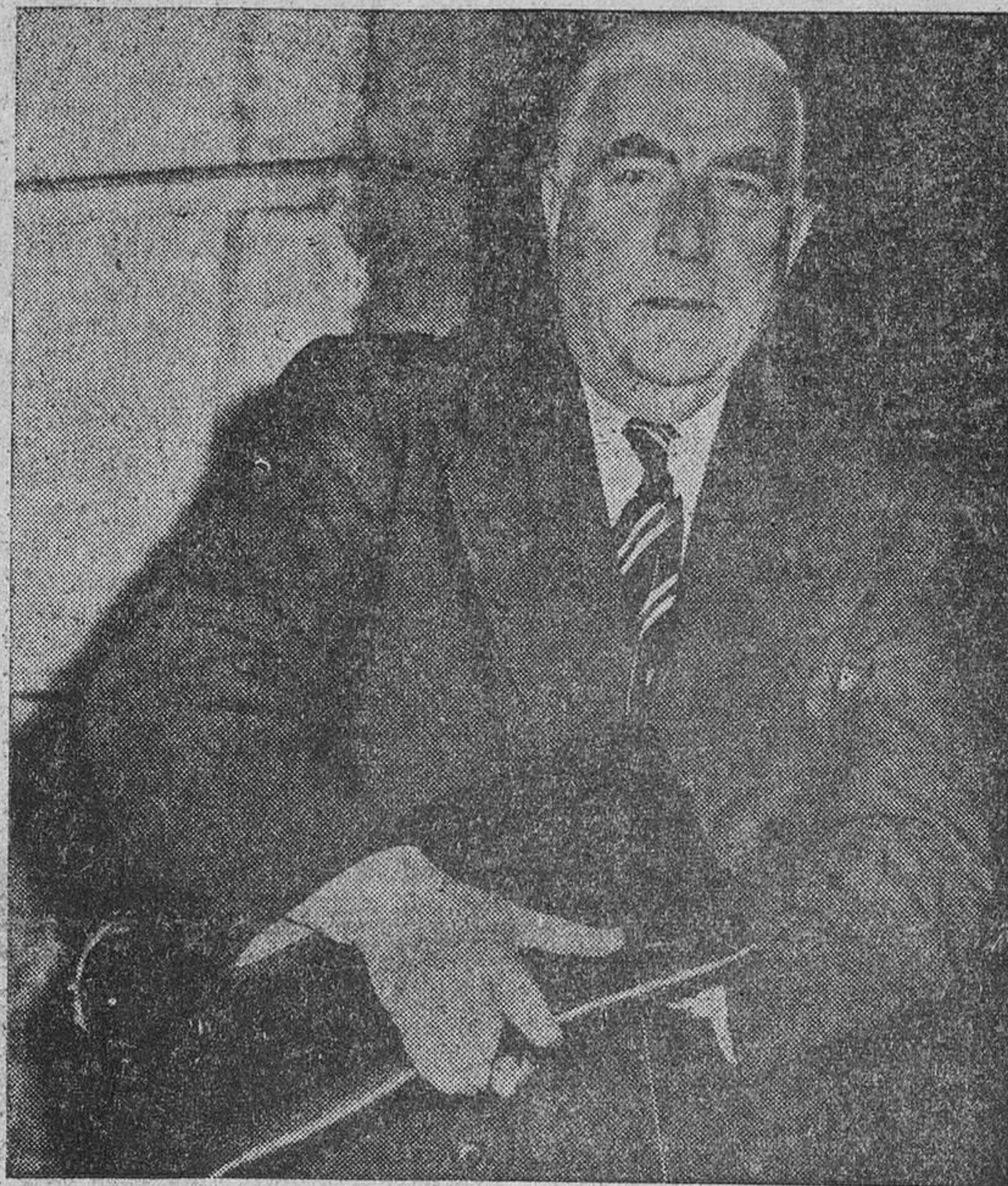
Mister menzies, con la famosa cartera del Plan Dulles, presentado ayer a Nasser.