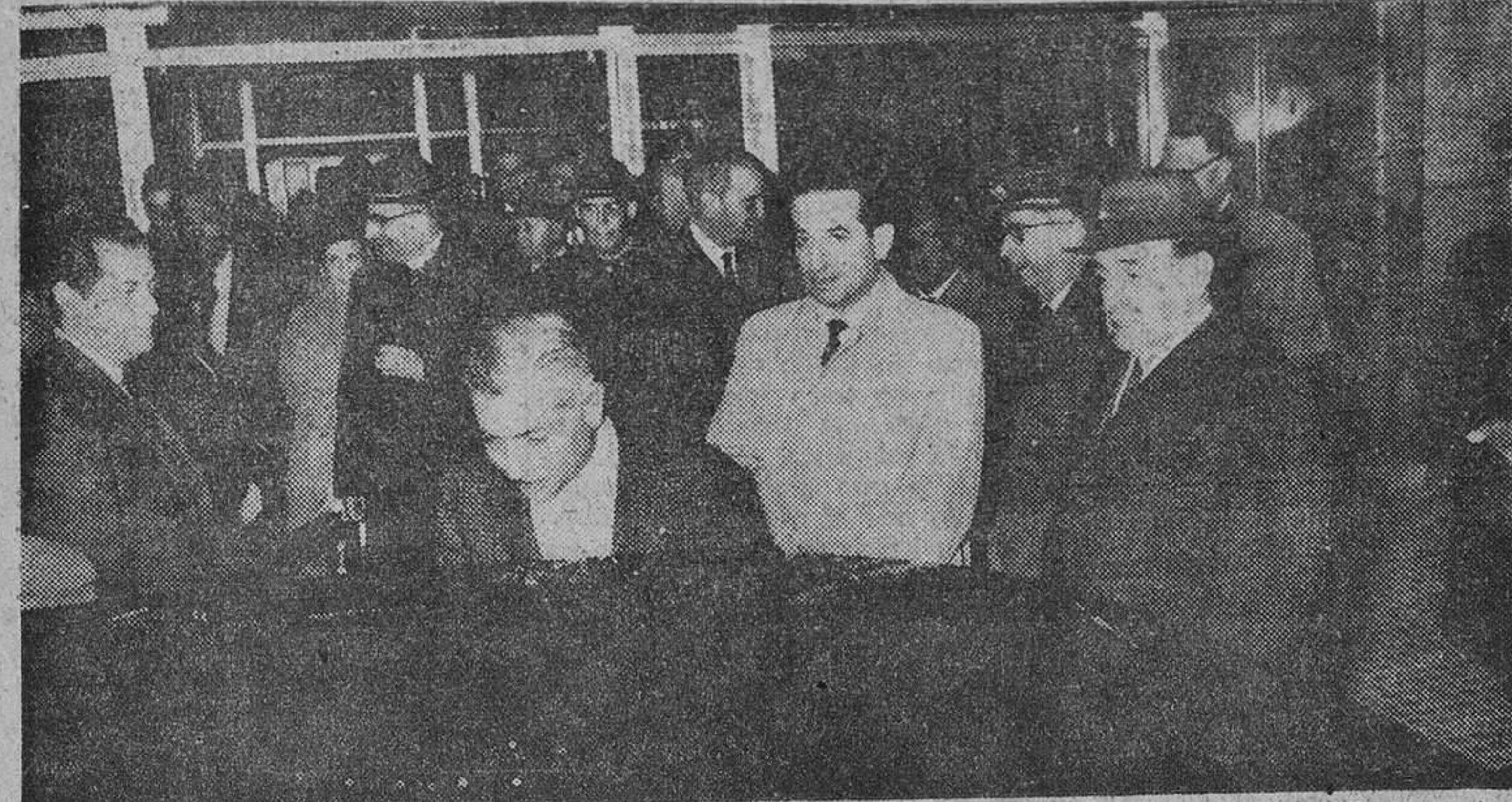
Las personalidades peruanas, acompañadas del capitán general Muñoz Grandes, abandonan el aeropuerto.

Le acompaña, en el vuelo inaugural de «Iberia», el Cardenal Primado. En Barajas les dió la bienvenida el capitán general Muñoz Grandes