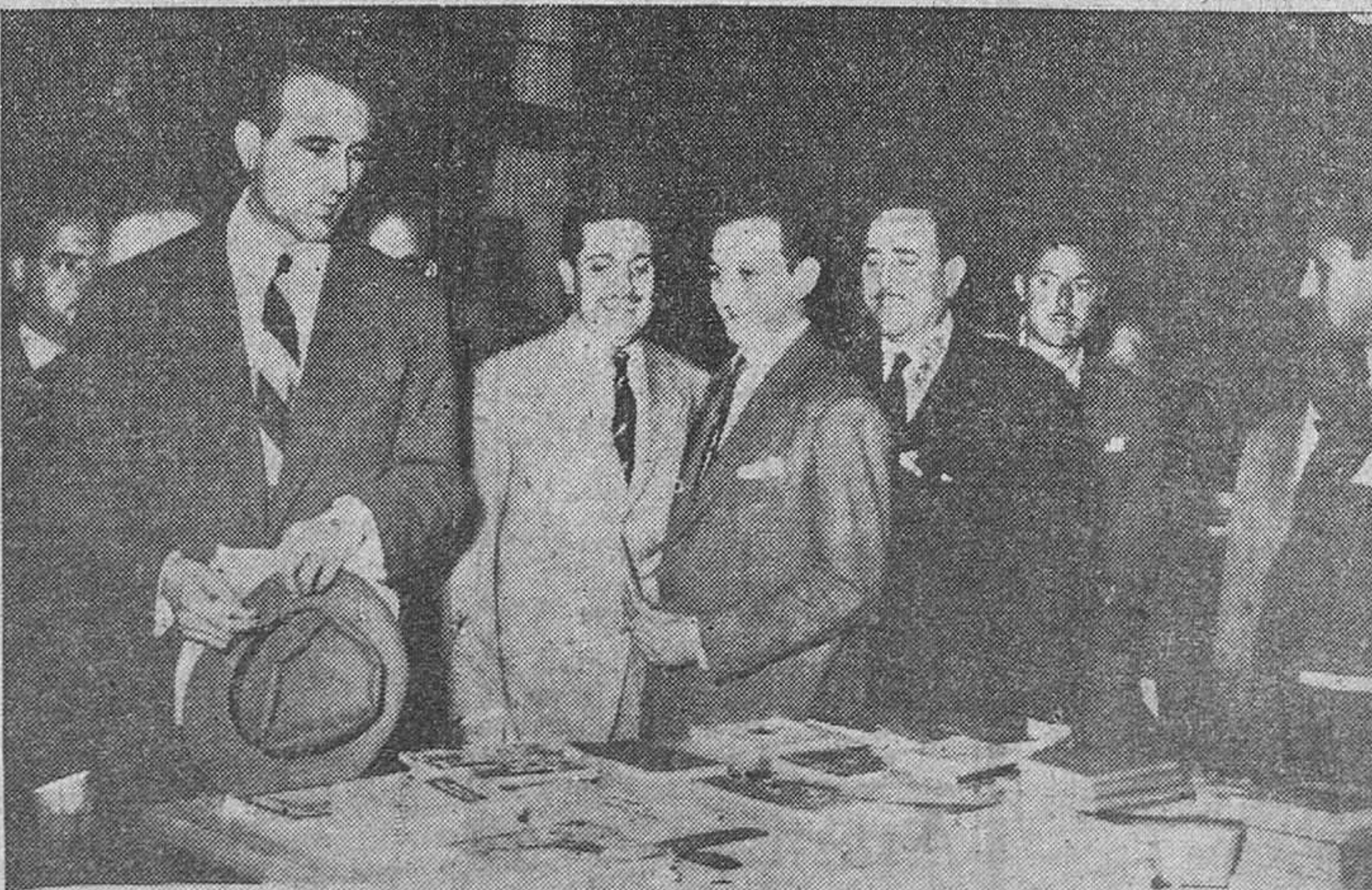
MADRID.—El ministro de Educación Nacional con el director general de Archivos y Bibliotecas y otras personalidades del Ministerio inaugura la Exposición del Libro de Texto, que se celebra en la Biblioteca Nacional.