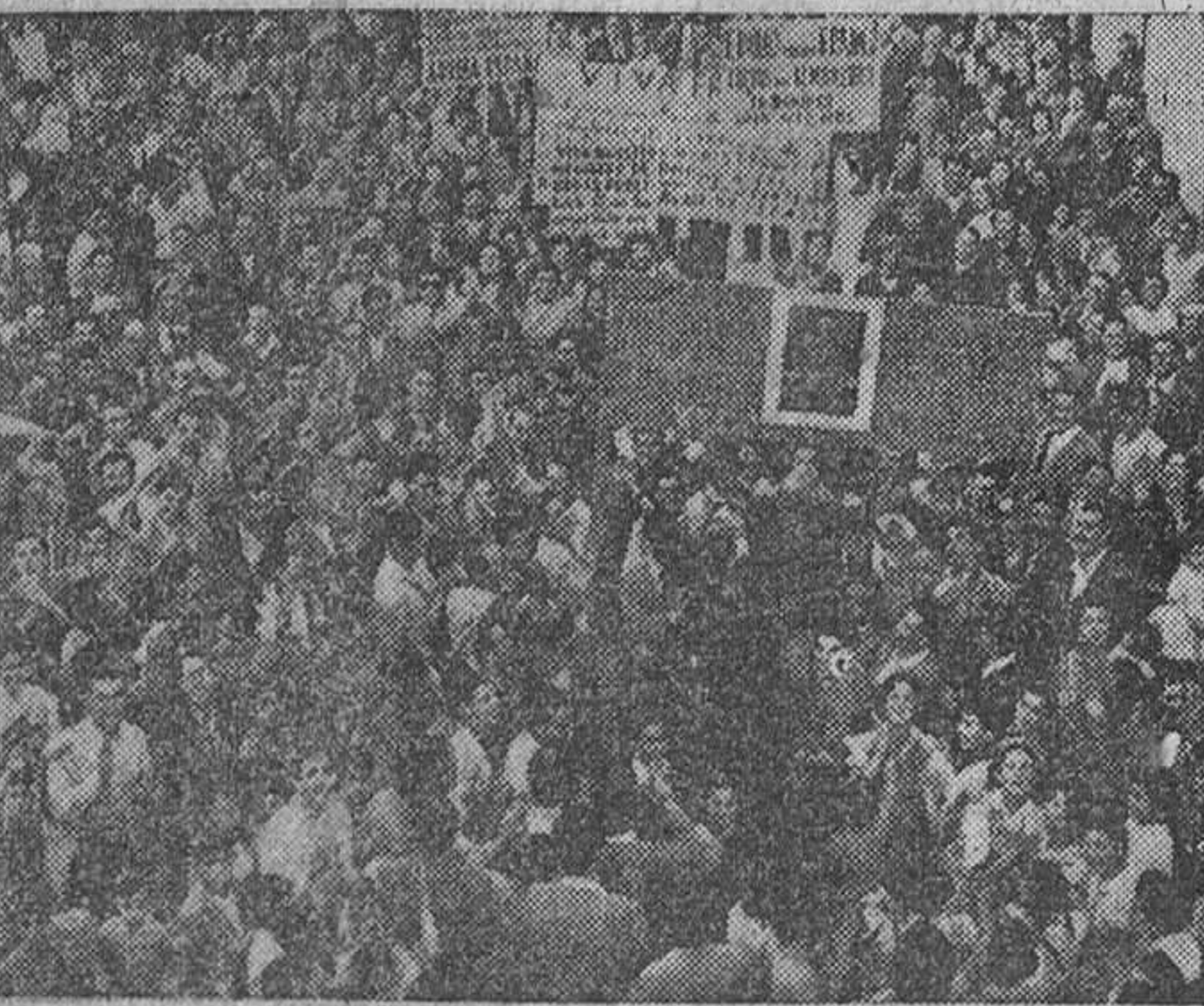
ALMERIA.—Al conocerse la noticia de la aprobación del anteproyecto del pantano del río Almanzora, en los pueblos de la comarca se produjeron entusiastas y júbilos manifestaciones de agradecimiento al Gobierno del Caudillo. La fotografía capta un momento de la impresionante manifestación, habida en Cuevas de Almanzora. El pantano, que embalsará 150 millones de metros cúbicos, regará más de diez mil hectáreas de los términos municipales de Cuevas, Vera, Antas, Pulpi, Turre y Mojácar. Importará quinientos millones de pesetas.