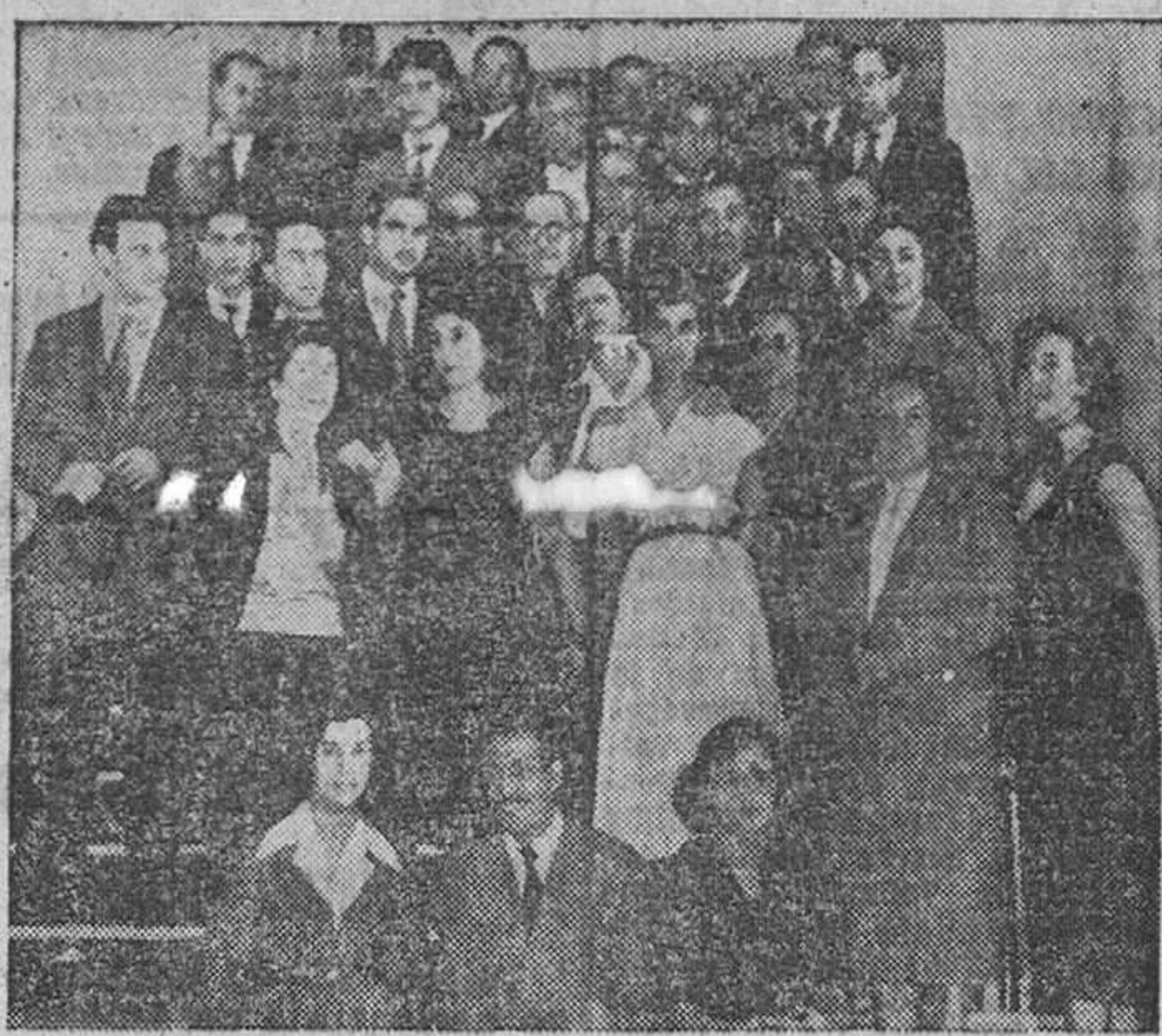
El personal de Obras Públicas celebró ayer con gran brillantez la festividad de su excelso Patrono, Santo Domingo de la Calzada. A las diez y media de la mañana tuvo lugar una misa en la iglesia parroquial de Santa María de la Horta y más tarde los funcionarios e invitados se reunieron con sus jefes en los locales de la Jefatura, donde fueron obsequiados con un vino español.