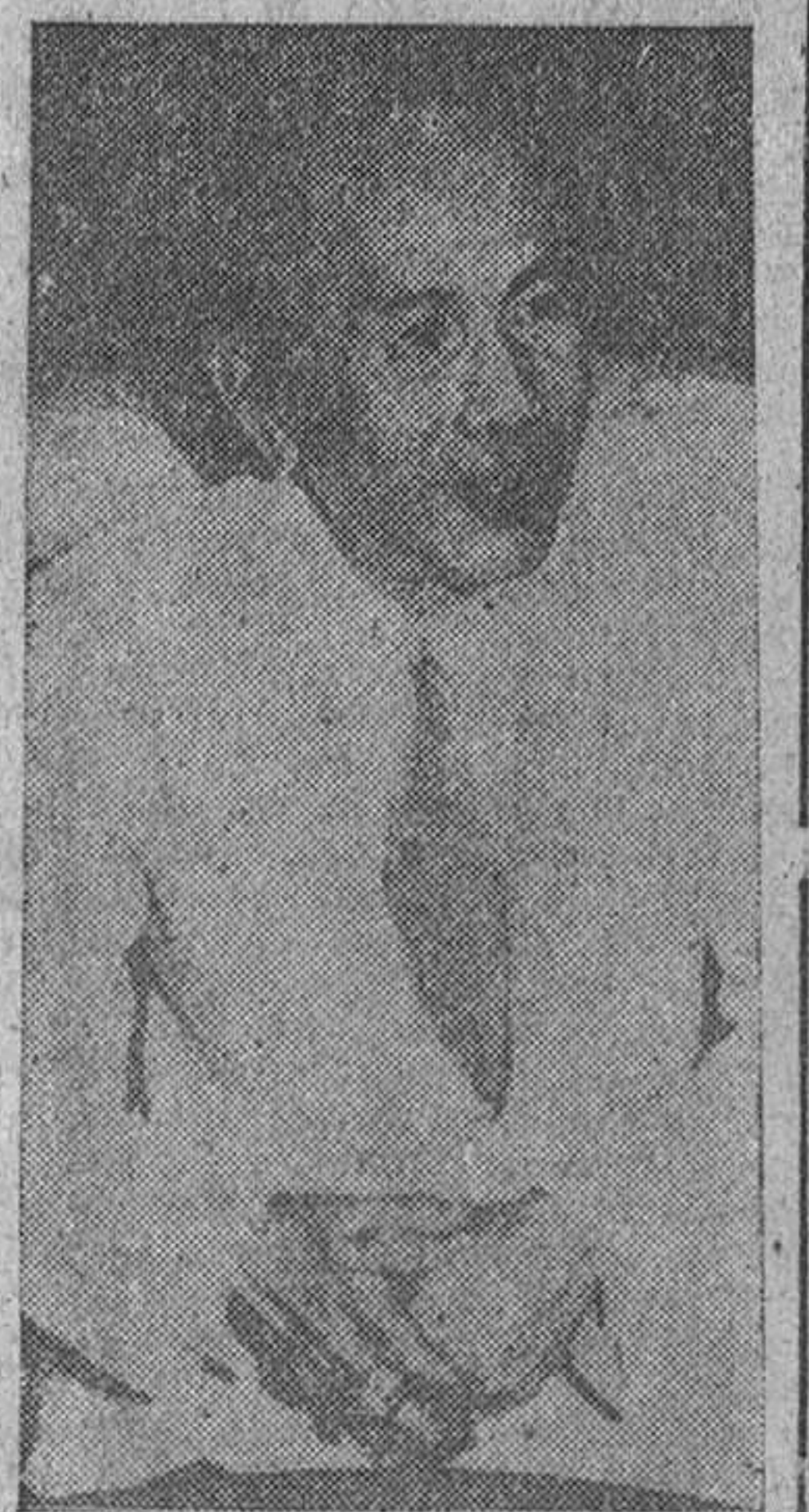
El primer ministro de Tailandia

El domingo, día 15, a las once de la mañana, llegará a Madrid el presidente del Consejo de Ministros de Tailandia, mariscal P. Pibulsonggram.