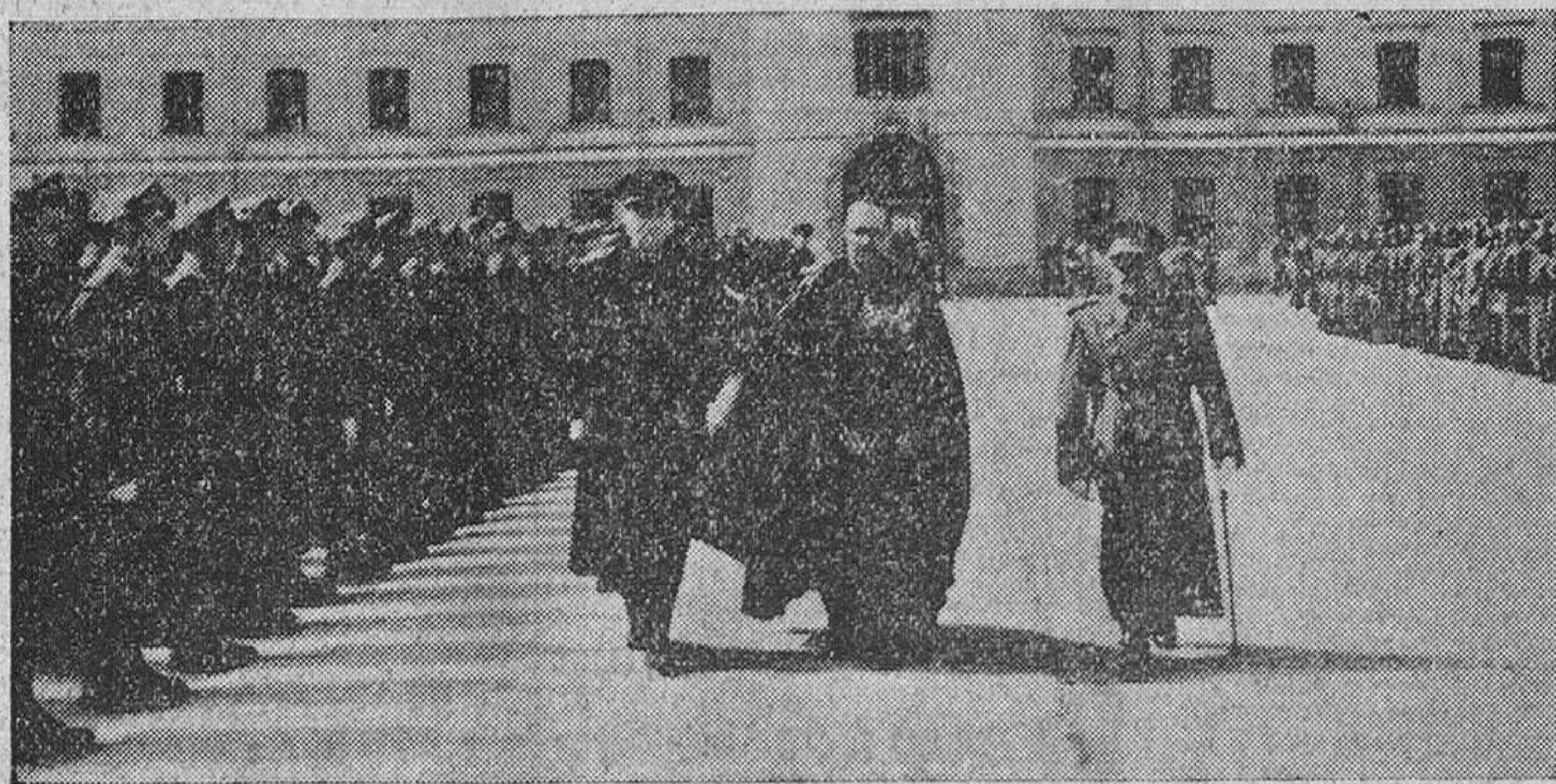
El Prelado y los gobernadores civil y militar pasan revista a la tropa momentos antes de comenzar la misa.

Se celebró con una misa de campaña y desfile por el patio del Cuartel