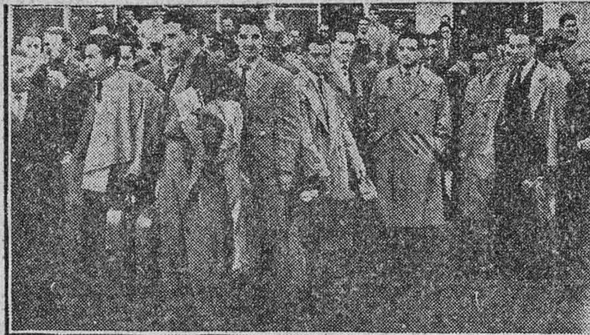
El equipo de fútbol español que habrá de jugar en Turquía, emprende la marcha desde el aeropuerto de Barajas.