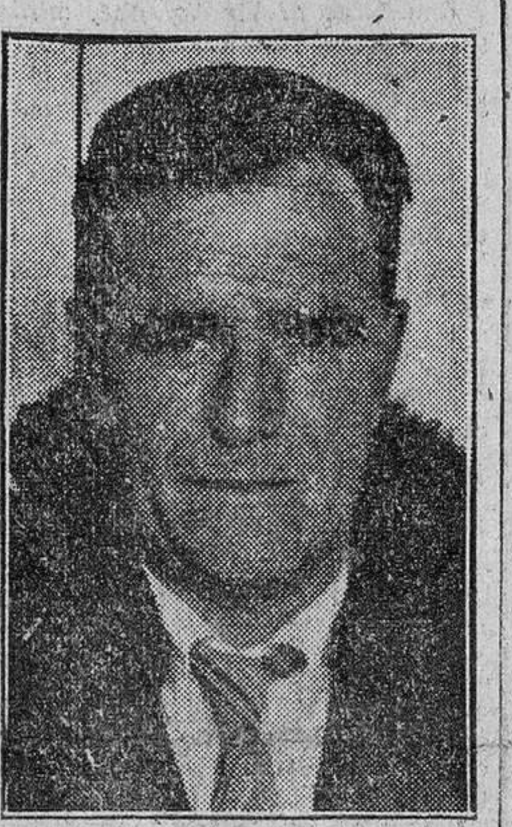
Al habla con el alcalde de Villamor de Cadozos

En un momento toda la historia de Giuliano, que parecía olvidada, vuelve a la memoria de las gentes y a las primeras páginas de los diarios. Se recuerda el interminable proceso (870 horas de Audiencia), la condena de los treinta y un cómplices de Giuliano el 4 de mayo de 1952 y salen a la luz nuevos detalles de la rocambolesca vida del bandido siciliano. Se recuerda que antes que Pisciotta otros dos hombres han pagado con la vida el haber demasiado: Un abogado que poseía la memoria redactada por Giuliano aparece muerto en el fondo de un pozo, y un diputado fué también hallado muerto con señales inequívocas de haber sido envenenado.