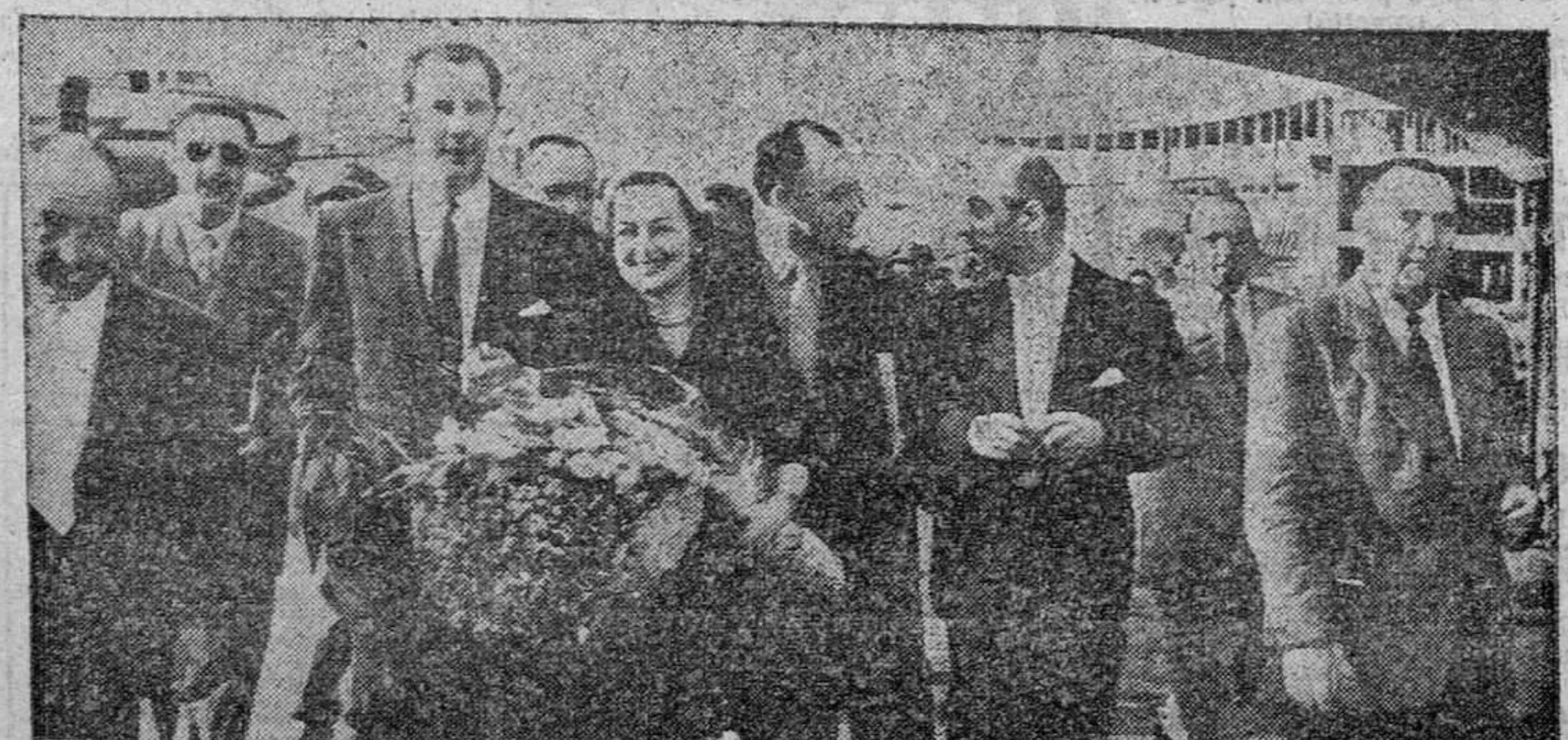
Llega a Madrid la famosa estrella del cine norteamericano, protagonista, entre otras, de "Lo que el viento se llevó", Olivia de Havilland, siendo recibida en Barajas por directores de cine españoles y el que va a dirigir la que va a rodar en España seguidamente.