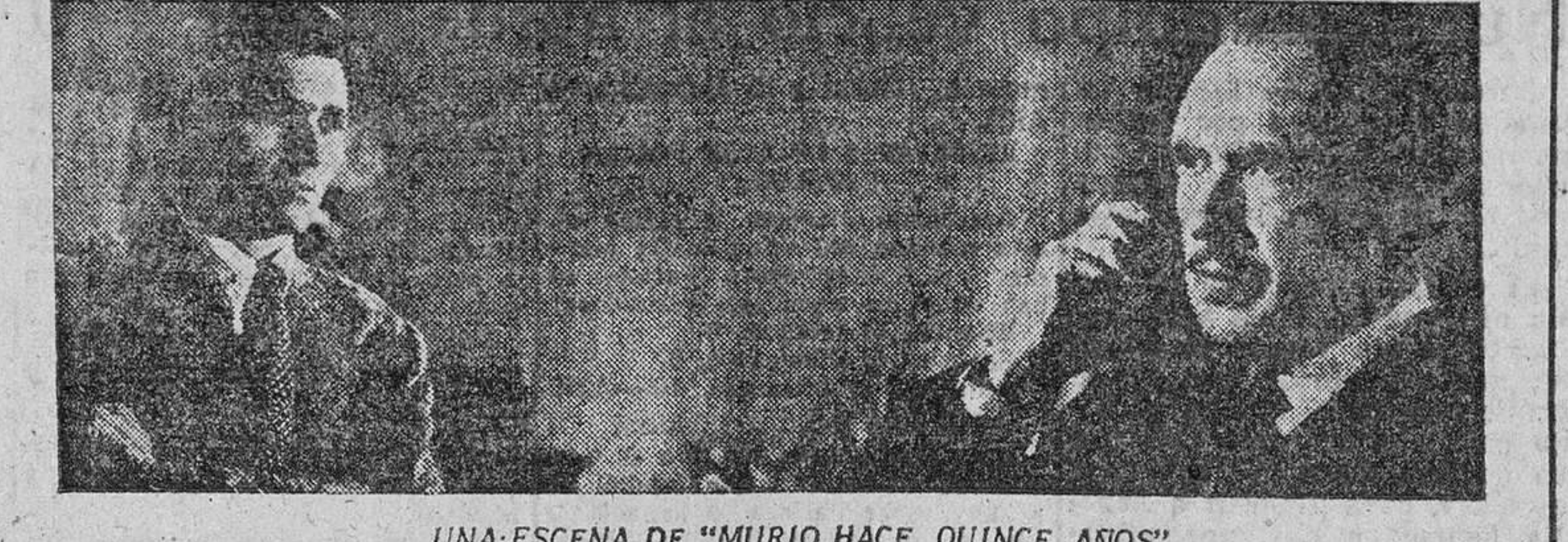
UNA-ESCENA DE "MURIO HACE QUINCE AÑOS"

Hay en rodaje dieciséis películas y otras tantas guardan turno Nuestros artistas se codean con los extranjeros, que cada día arriban en mayor número