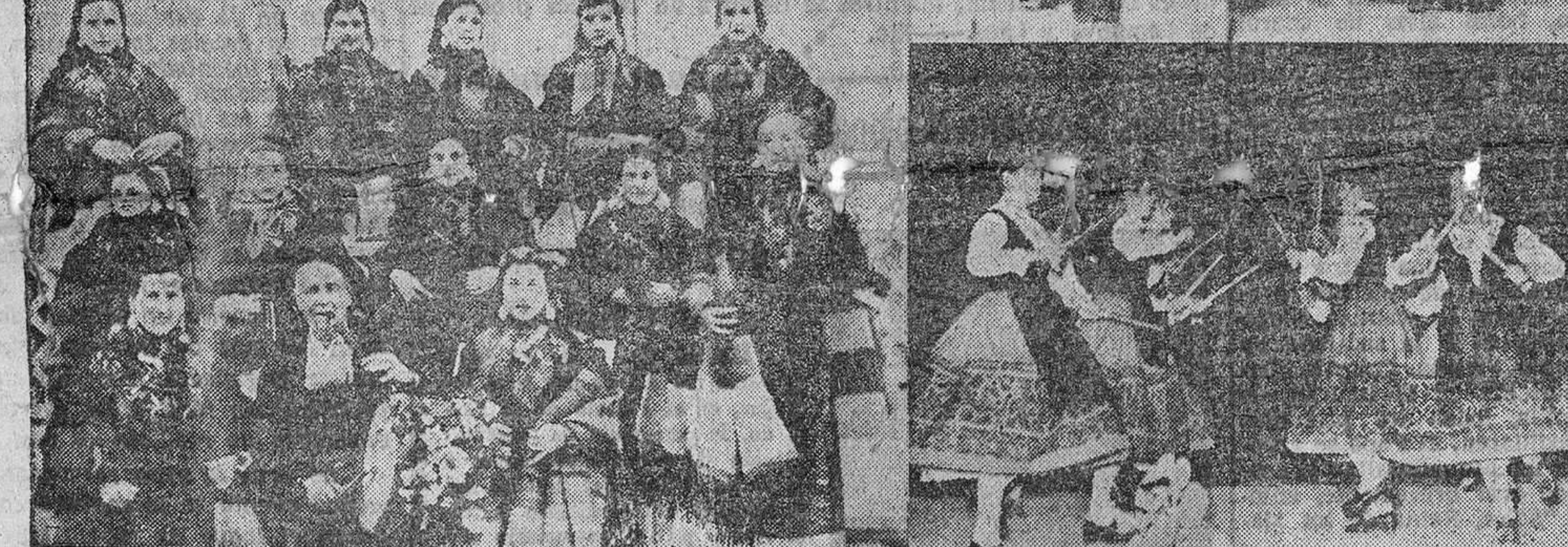
Presentamos a las triunfadoras. Las dos primeras "fotos" corresponden al grupo de Danzas de Zamora capital. Sucesivamente aparece el grupo de Benavente interpretando la "Danza del lazo"; el de Toro, en la "Virginia"; el de Fermoselle, posando antes de su intervención, y el de Fuentesauco, durante el "paloteo".