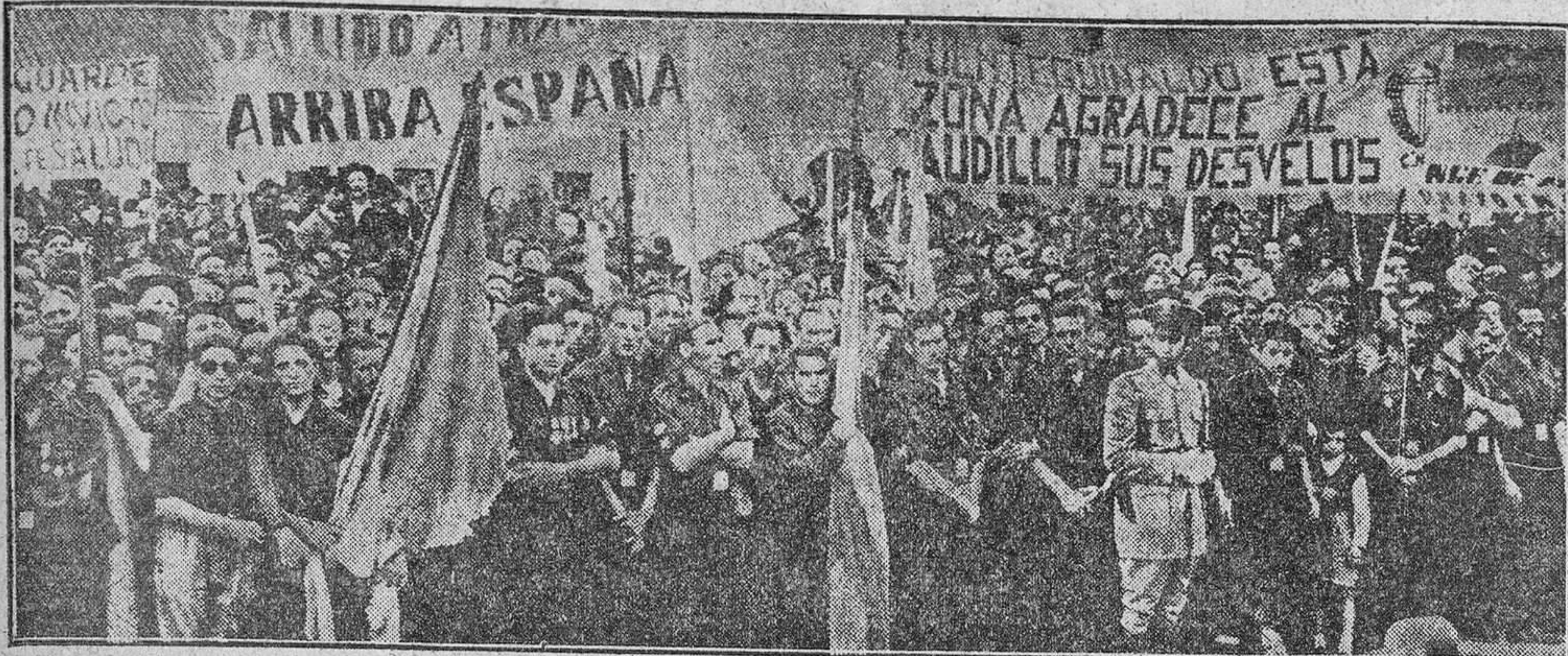
Entre los diversos actos que jalónaron la marcha del Caudillo por tierras de Salamanca, quizá ninguno llegue más al buen corazón campesino de España que éste acaecido el domingo en un nuevo pueblo surgido sobre las tierras castellanas. Más de veinticinco mil personas, labriegos en su mayoría, aclamaron a Franco cuando inauguraba con su paso Agueda del Caudillo, y luego, al verle entregar cincuenta y seis llaves de propiedad a otros tantos cabezas de familia y al escuchar su voz. En la primera línea del entusiasmo los antiguos mozos de la guerra, los del tiempo de la Cruzada, los de los campos de Rusia, los de siempre, con su camisa azul, sus banderas, sus vitores a los honrosos signos de su aventura. Cuando España está en la calle, siempre la primera línea es falangista, tanto a la hora de aclamar como a la de servir al Caudillo.