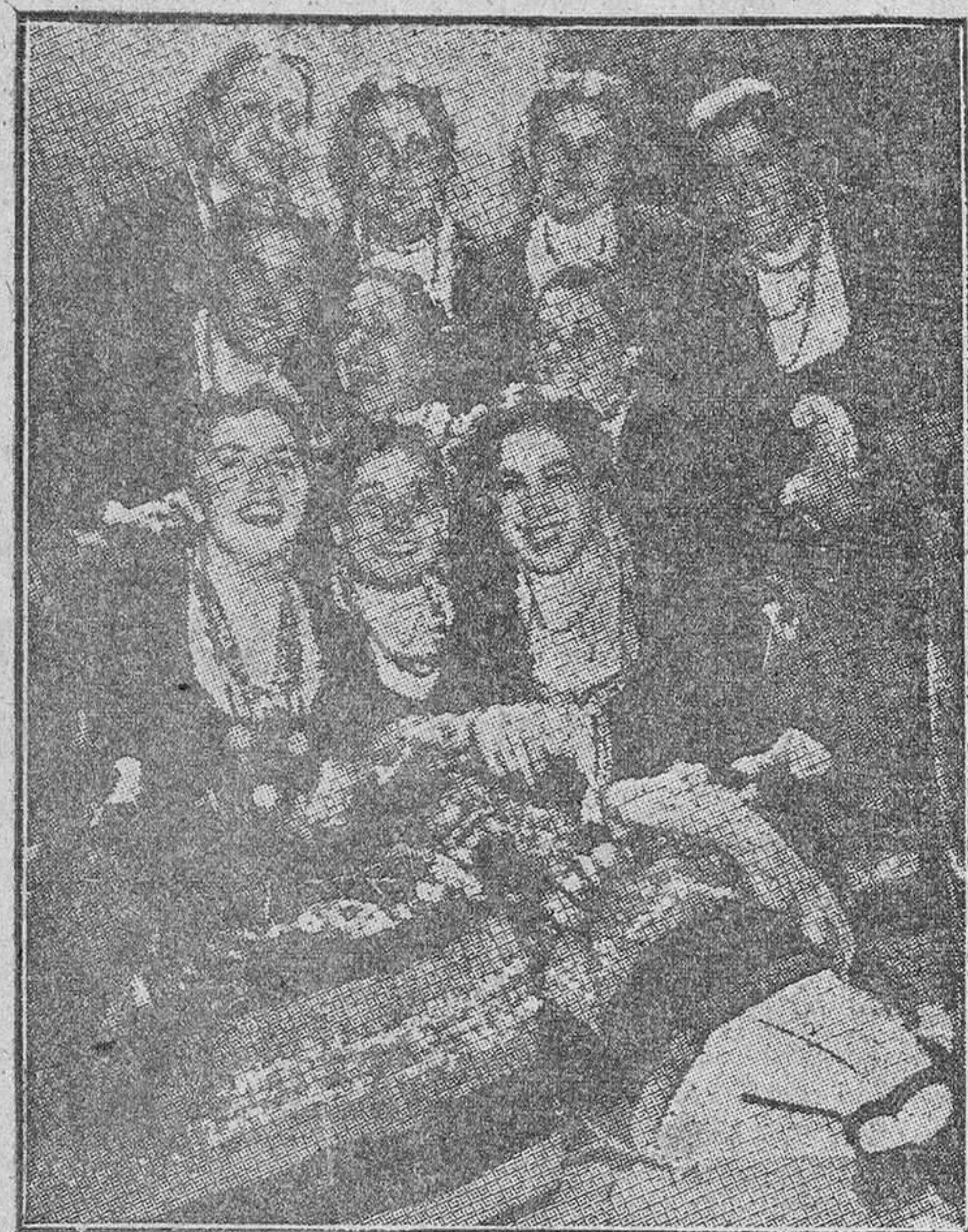
Muchachas de la Sección Femenina de Burgos que han actuado brillantemente en Irlanda en el Grupo de Danzas.