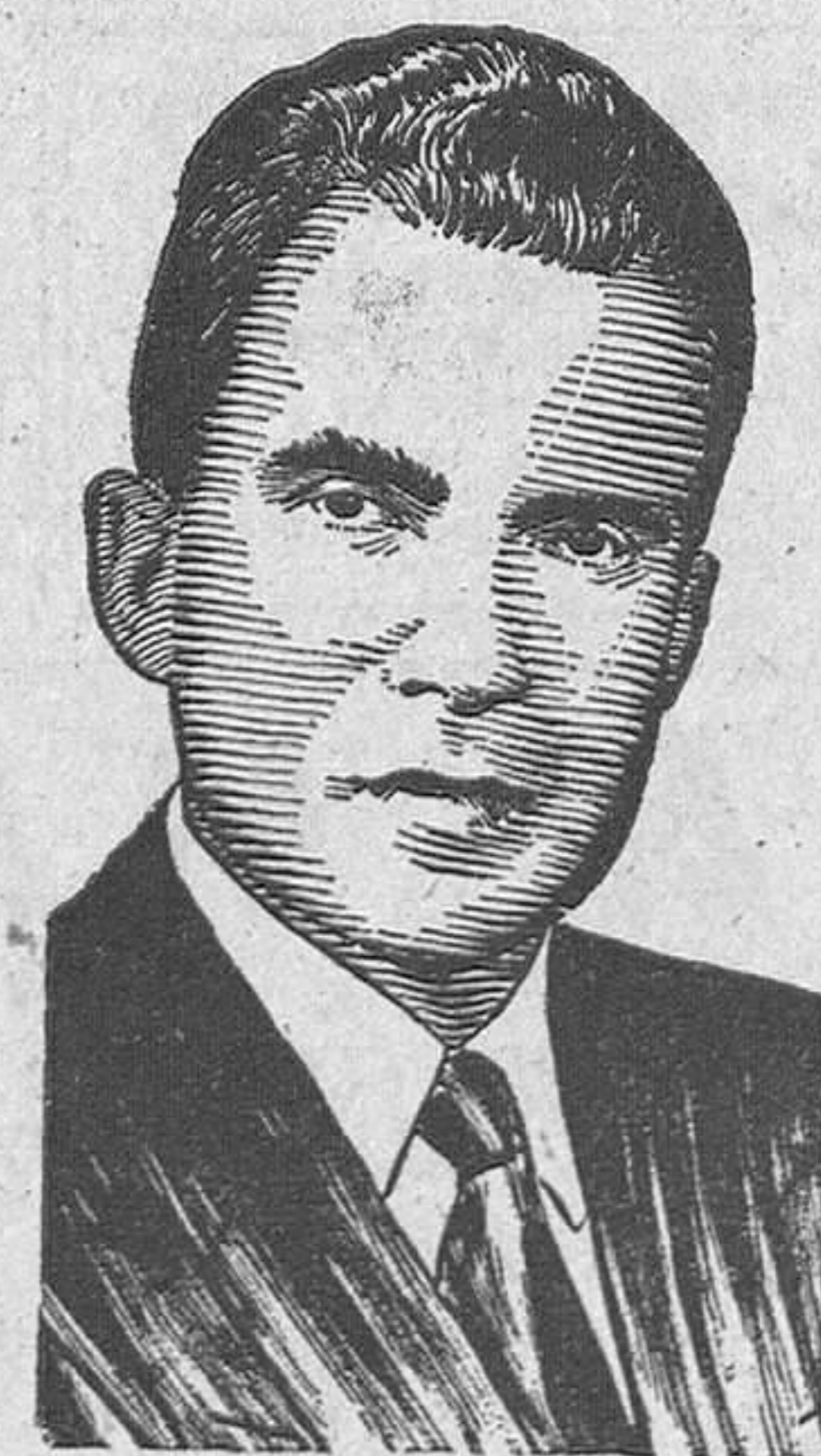
NIXON VICEPRESIDENTE ELECTO

A partir de ese momento, comienza a sonar el nombre de Dwight